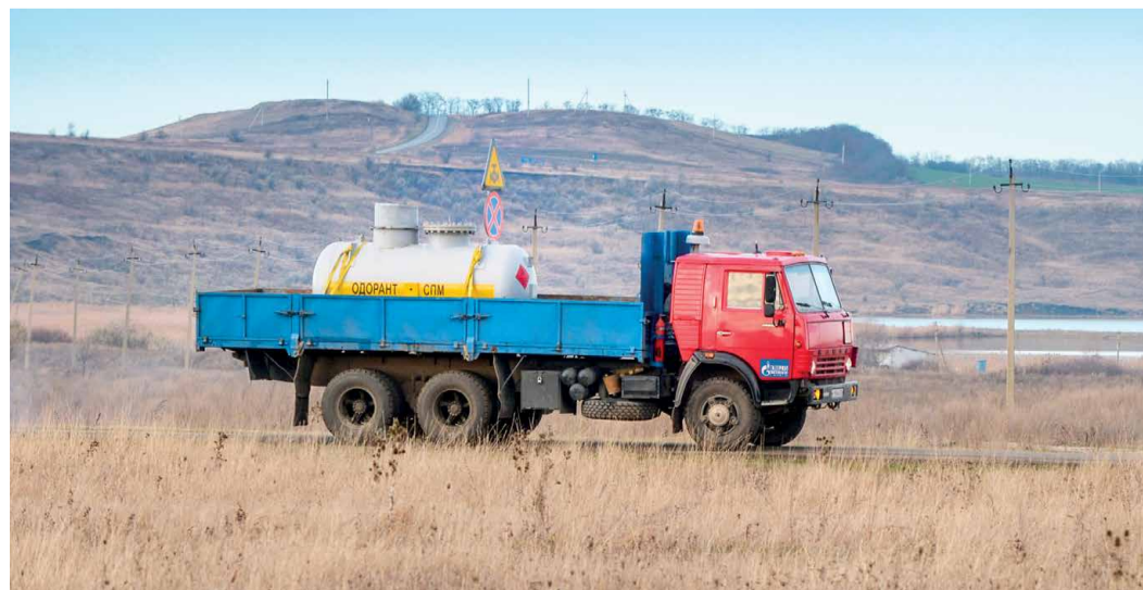
Перевозить одорант могут только водители со специальным допуском к транспортировке опасных грузов