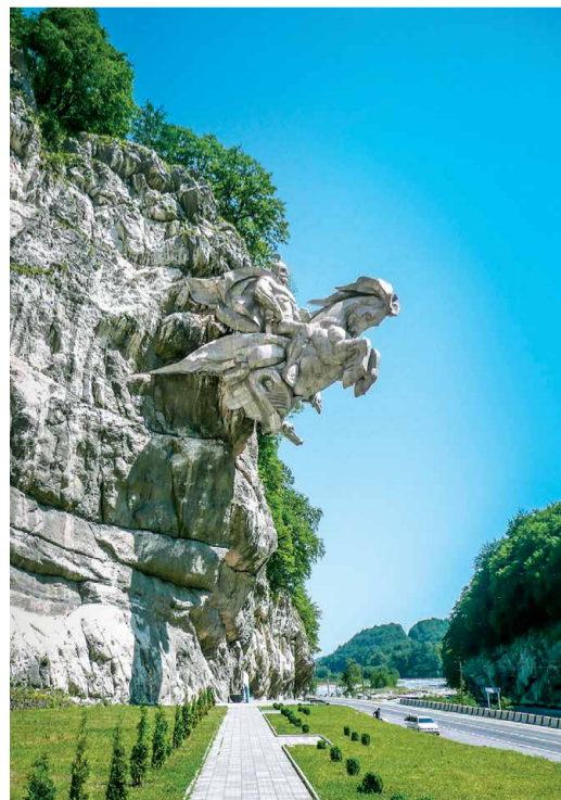
Памятник «Георгий Победоносец выскакивает из скалы»

Покровителем Алании считается Георгий Победоносец — святой, в честь которого построено множество храмов, часовен и памятников. Недалеко от Владикавказа есть необычный памятник «Георгий Победоносец выскакивает из скалы». Расположенная на двадцатиметровой высоте, скульптура словно парит в воздухе.