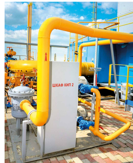
Шкаф с контрольно-измерительными приборами

В своей работе слесари КИПиА используют более сотни различных инструментов.