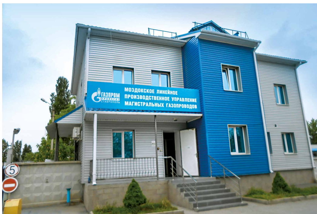
Здание Моздокского ЛПУМГ

Красивейшие пейзажи, минеральные источники, чистейшие воды горных рек – это все об Ингушетии. К слову, о реках. Согласно данным правительства Ингушетии, на территории республики находится 720 бассейнов средних и малых рек, суммарная протяженность которых превышает 1 350 километров, в среднем на каждый квадратный километр площади приходится свыше 590 м речной сети. Эти гидрографические показатели являются одними из самых высоких в масштабе Северо-Кавказского федерального округа.