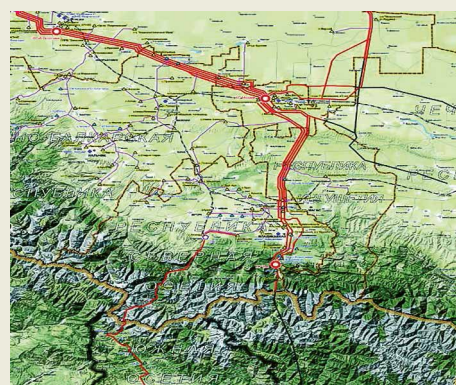
Зона ответственности Моздокского ЛПУМГ

В 80-е годы были введены в эксплуатацию магистральные газопроводы Новопсков – Аксай – Моздок, Казимагомед – Моздок, Невинномысск – Моздок, Северный Кавказ – Закавказье. Одновременно со строительством магистральных газопроводов интенсивно развивалась сеть газопроводов-отводов.