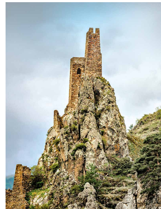
Крепость в селении Вовнушки

Эрзи – один из крупнейших средневековых башенных поселков замкового типа. Можно увидеть пяти- и шестизэтажные боевые, полубоевые, жилые башни, каменную оборонительную стену с широкими воротами времен позднего средневековья.