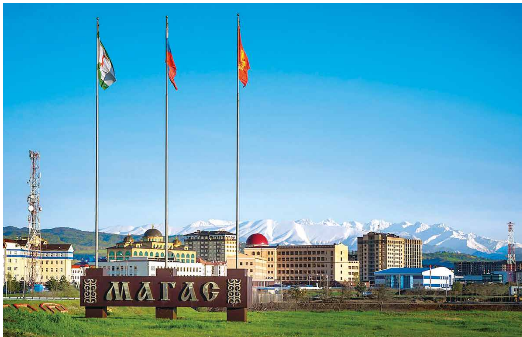
Столица Ингушетии – город Магас

Газификация Ингушетии началась в 60-е годы прошлого века. Голубое топливо в регион поступает по МГ Моздок – Тбилиси, Октябрьское – Ольгинское, Октябрьское – Ольгинское – Чми, Северный Кавказ – Закавказье.