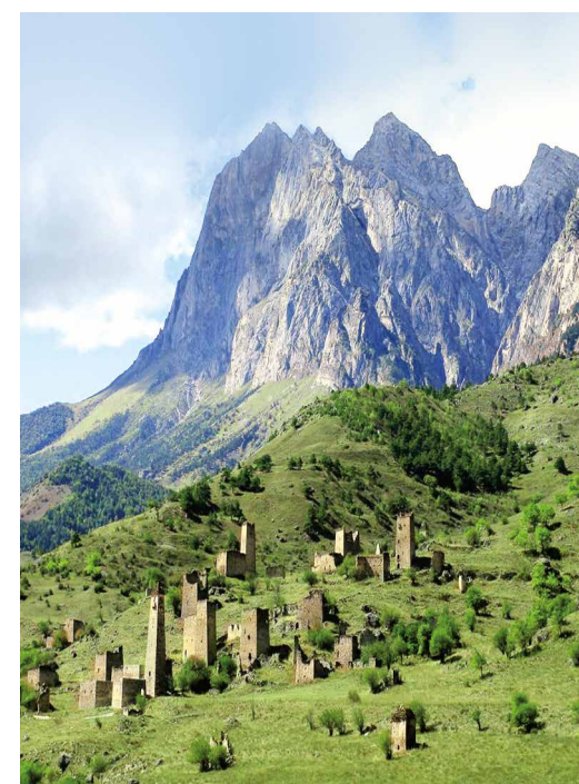
На территории Ингушетии десятки башенных комплексов