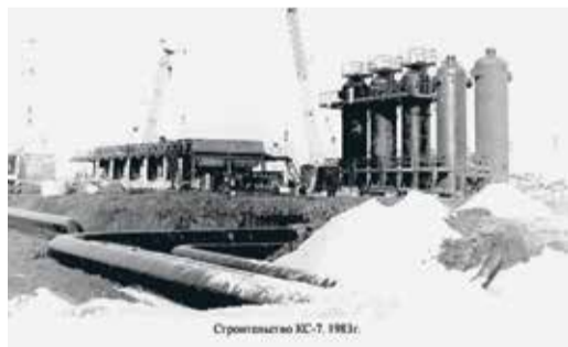
Строительство КС-7, 1983г.

Тридцать пять лет назад началась эксплуатация МГ Новопсков — Аксай — Моздок (НАМ). На тот момент это был современный и мощный газопровод диаметром 1220 мм, протяженностью в зоне ответственности предприятия — 475,4 км. Сегодня газовую магистраль эксплуатируют Привольненское, Изобильненское, Ставропольское, Невинномысское, Георгиевское и Моздокское ЛПУМГ.