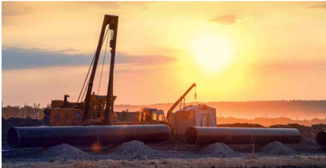
Последние приготовления к сварочно-монтажным работам