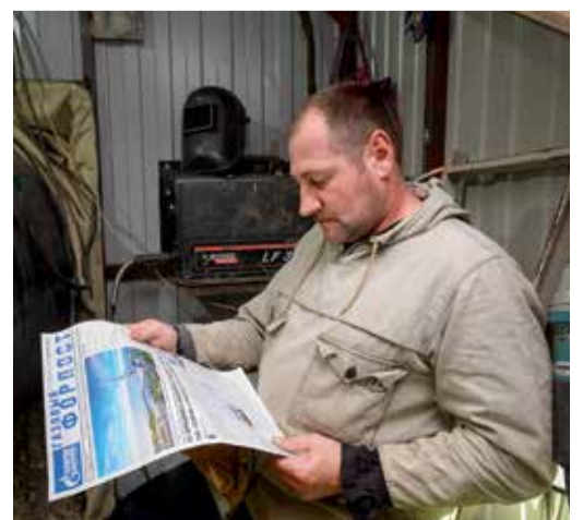
В минуты отдыха