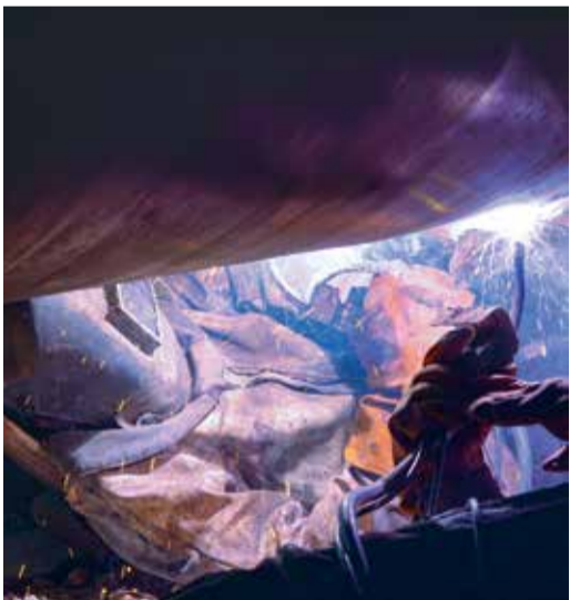
Яркие моменты вечерней смены