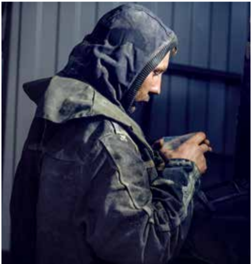
Сварной готовится к труду

В Ставропольском ЛПУМГ полным ходом идет переизоляция двух участков магистрального газопровода — Новопсков — Аксай — Моздок (Юг). В дневное время идут все подготовительные работы, а трубу варят в плеть рано утром и вечером.