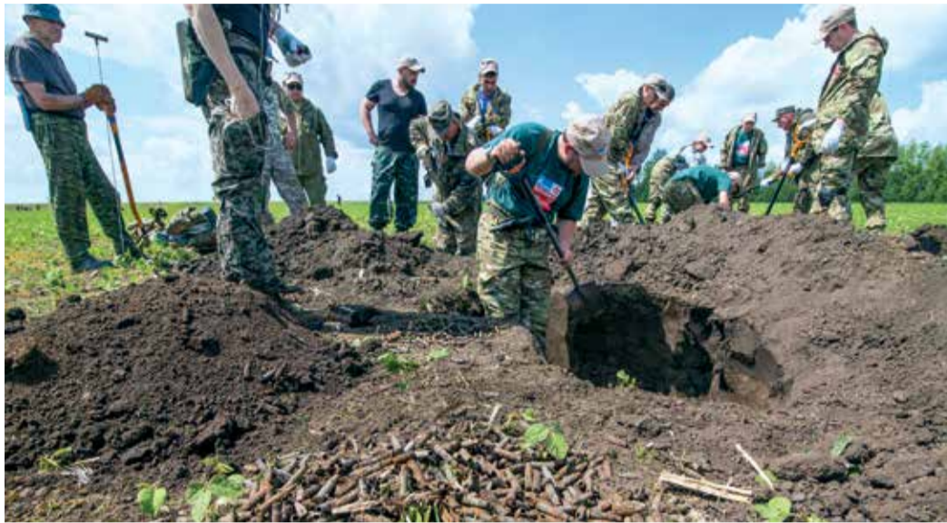
Поисковые работы в Воронежской области

сводного отряда «Лотос», под флагом которого собрались поисковики из всей Астраханской области. Совместными усилиями был разбит лагерь, обустроен быт, и начались тяжелые дни раскопок.