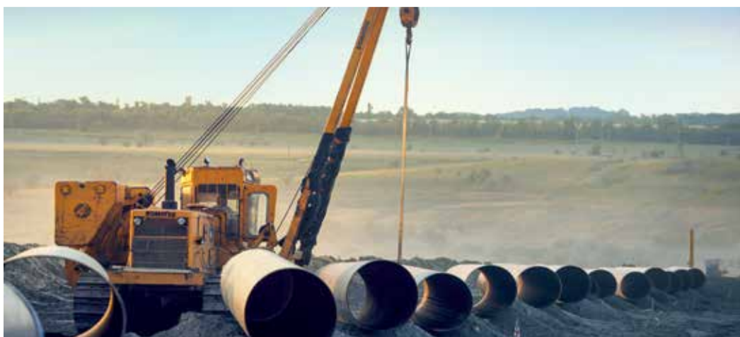
Отбраковка демонтированной трубы