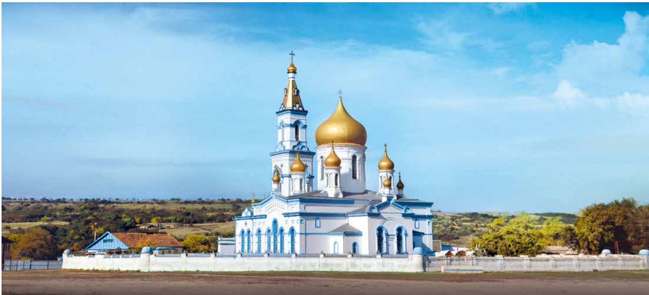
Свято-Никольский храм в селе Московском Ставропольского края