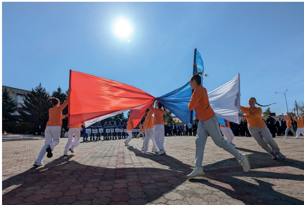
Танцевальный номер на торжественном открытии конкурса