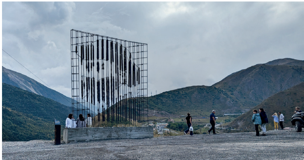
Арт-объект — портрет К. Хетагурова