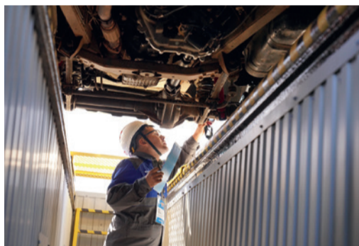
Выполнение технического задания

как сложно быть в числе организаторов такого мероприятия. Отмечу, что ставропольские коллеги достойно справились с задачей.