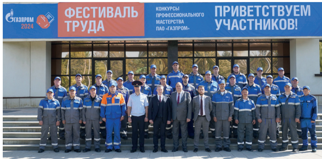
Участники и гости конкурса

Елена КОВАЛЕНКО.