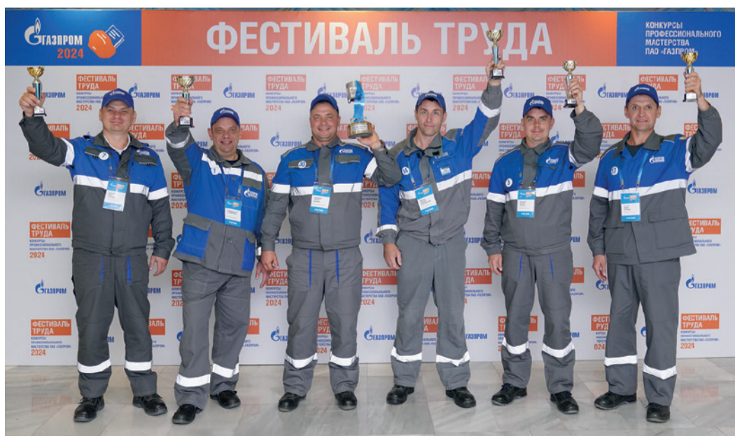
Победитель и призеры конкурса