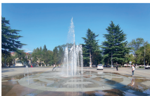
Фонтан в центре Цхинвала

Через десять километров Дзуарикау — Цхинвал проходит мимо природной жемчужины республики — озера Эрцо. Оно уни-