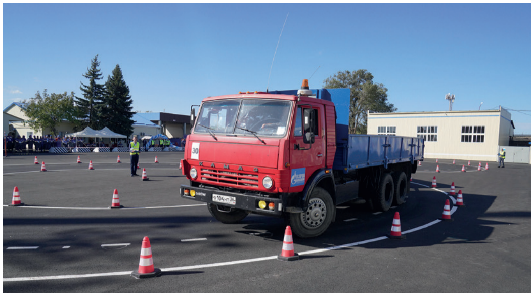
«Восьмерка» на КамАЗе

на автобусе ПАЗ: «восьмерка» и «змейка» передним и задним ходом, «стоп линия» и «автобусная остановка». На прохождение всех этих элементов вождения отводилось не более пяти минут.