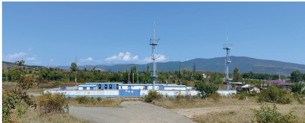
ГРС г. Цхинвала