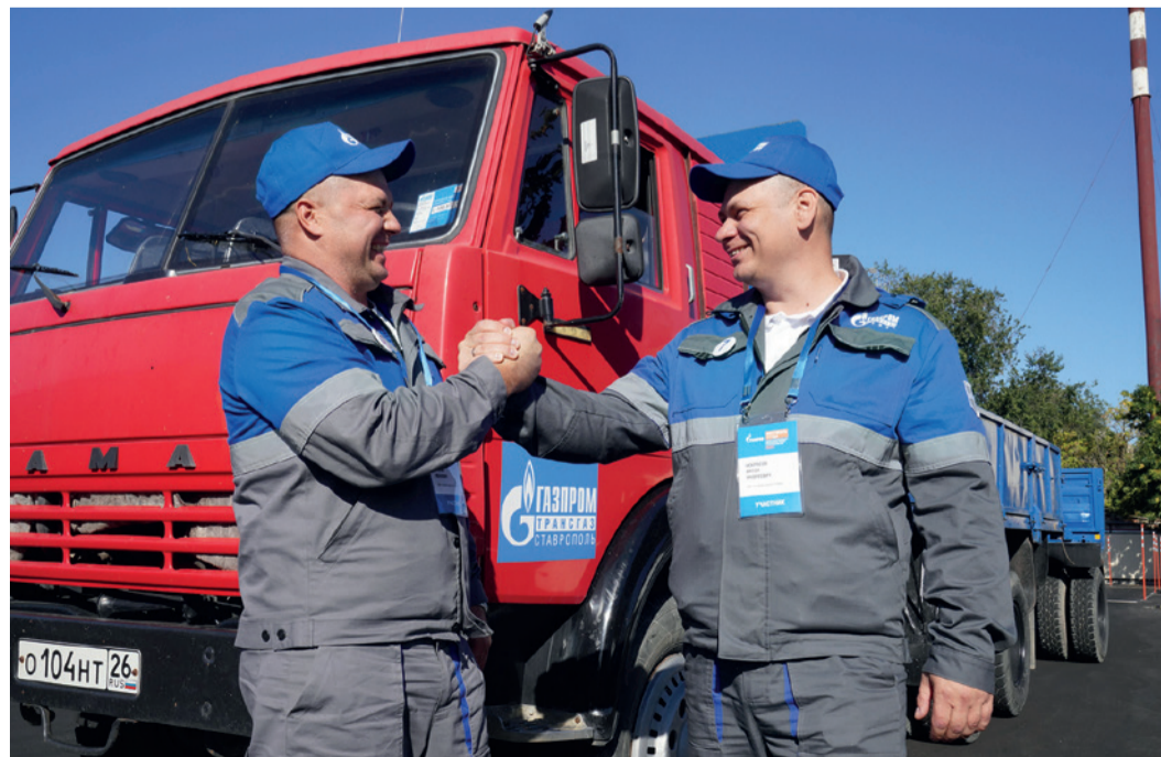
Конкурс подружил водителей

За исключением одного конкурсанта, все справились с заданием и показали достойные результаты. После перерыва водители приступили к выполнению практических заданий. На промышленной площадке Управления технологического транспорта и специальной техники они выполнили упражнения