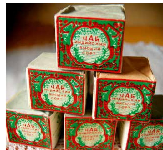
Из чайной коллекции героя

Наш герой – человек скромный и в то же время открытый, подкупающий своей