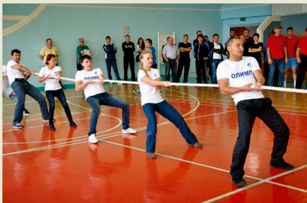
Команда администрации на соревнованиях по перетягиванию каната