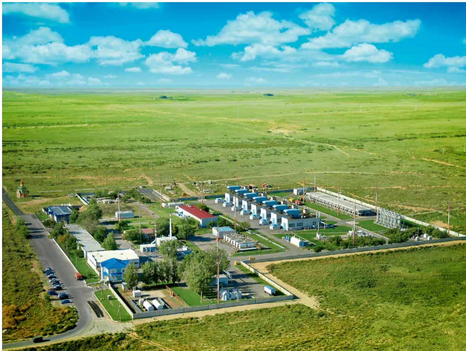
Зензелинскому ЛПУ МГ – 25 лет!