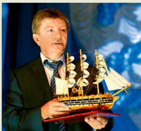
Директор Зензелинского ЛПУ МГ с подарком