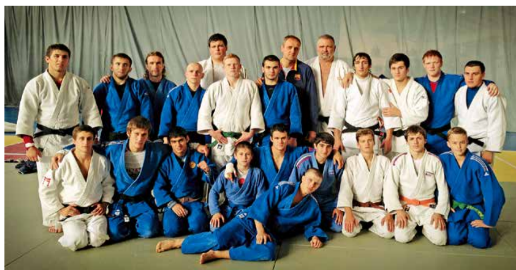
Дзюдоисты Общества на сборах в Кисловодске