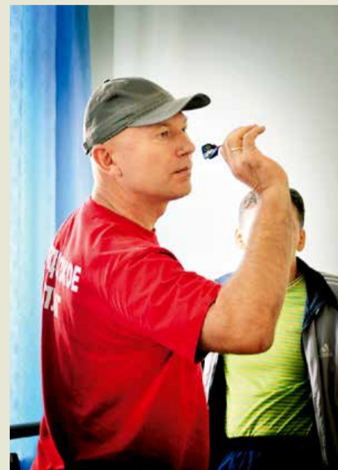
Состязания по дартсу