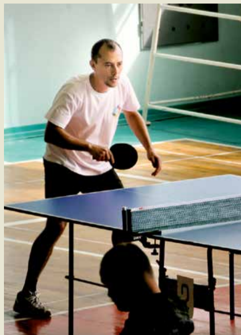
На теннисном матче