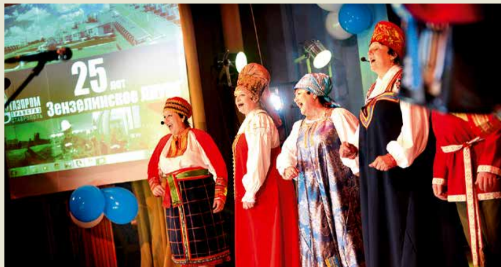
Фрагмент праздничного концерта