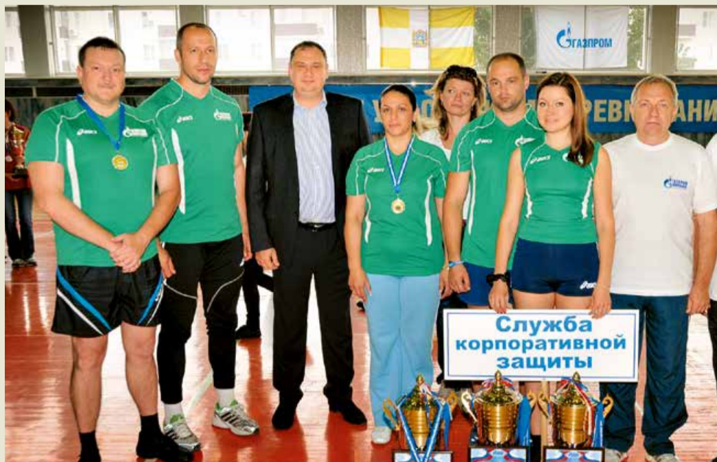
Команда Службы корпоративной защиты