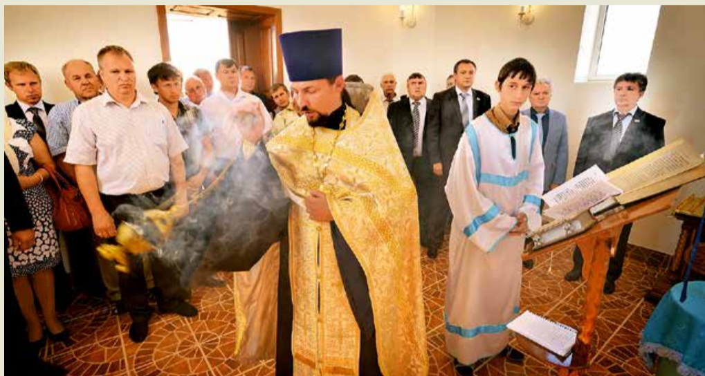
Освящение часовни Святого Георгия Победоносца