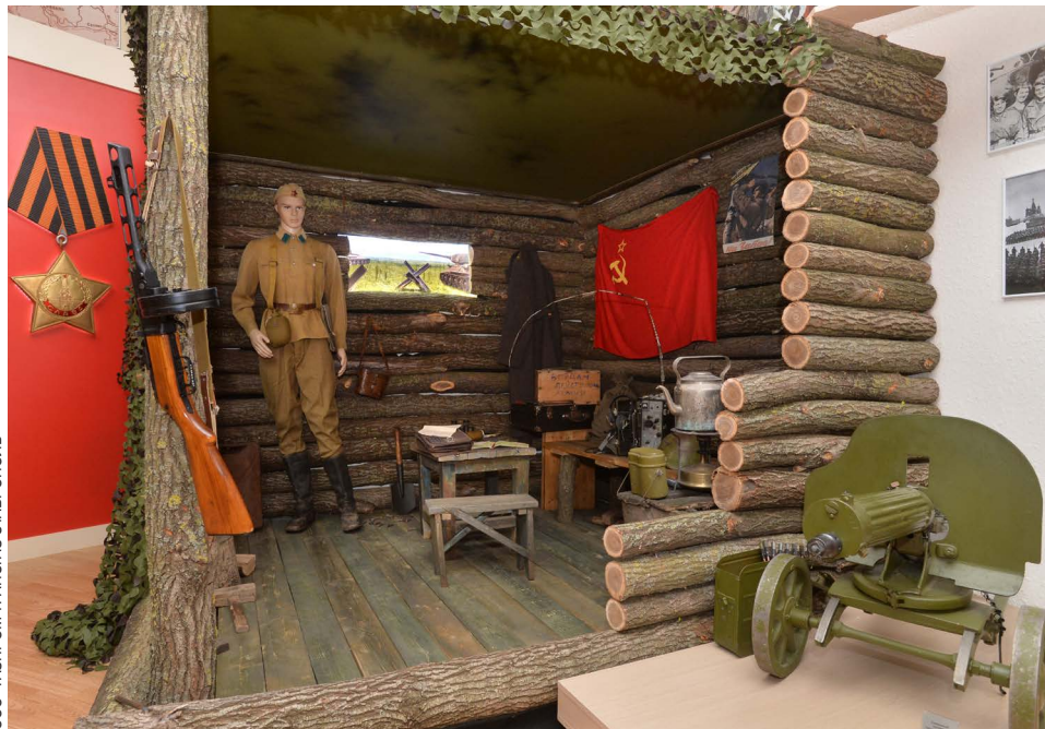
ООО «ГАЗПРОМ ТРАНСГАЗ СТАВРОПОЛЬ»

– Это праздник Великой Победы, память о которой передается из поколения в поколение. Уходят наши ветераны, кото-