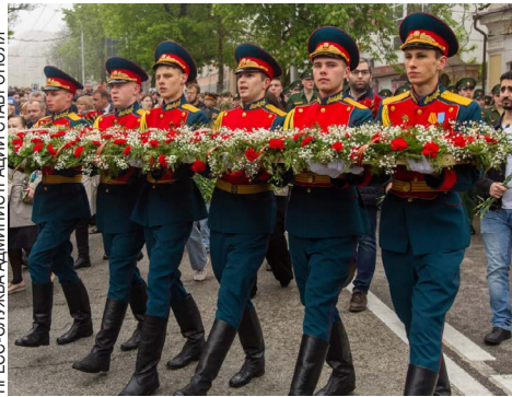
ПРЕСС-СЛУЖБА АДМИНИСТРАЦИИ СТАВРОПОЛЯ

Краевой центр отпраздновал 78-ю годовщину Победы в Великой Отечественной войне