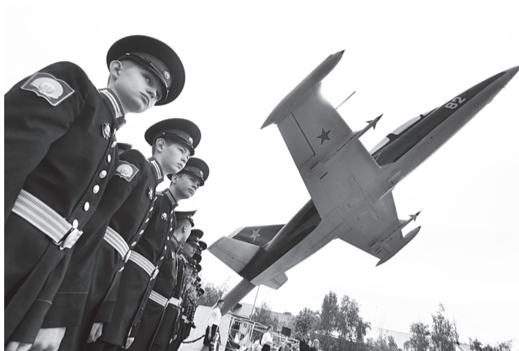
❶ Планер самолёта АЛ-39 «Альбатрос» стал ещё одним наглядным пособием для военно-патриотического воспитания молодёжи.

«Нет ни одной семьи, которой бы не коснулась война, ни одного дома, в котором бы не хранили память о родных, испытавших