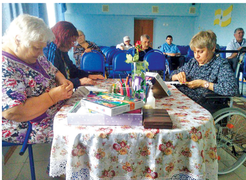
Занятия декоративно – прикладным искусством.

В 2019 году эту систему опробовали четыре стационарных учреждения – Левокумский и Александровский дома-интернаты для престарелых и инвалидов, а также Благодарненский и