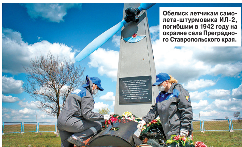
Обелиск летчикам самолета-штурмовика ИЛ-2, погибшим в 1942 году на окраине села Преградного Ставропольского края.

Газовики привели в порядок мемориалы в 50 городах и сёлах Юга России