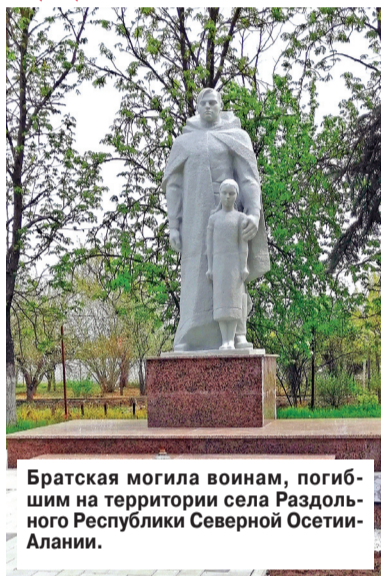
Братская могила воинам, погибшим на территории села Раздольного Республики Северной Осетии-Алании.

АЛЕКСЕЙ ЗАВГОРОДНЕВ: «ПАМЯТЬ ВОИНОВ ПОЧИМ У ОБНОВЛЕННЫХ ОБЕЛИСКОВ».