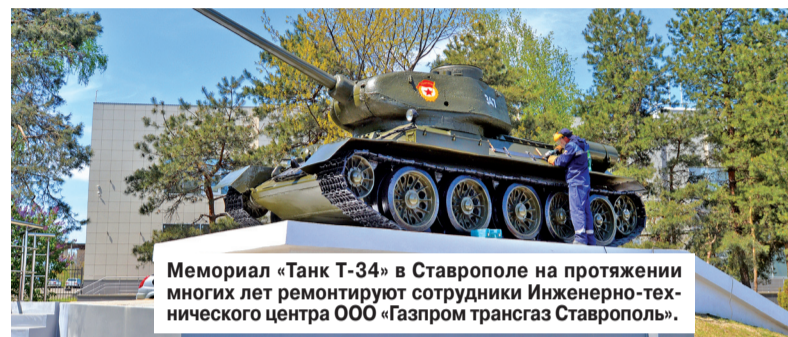
Мемориал «Танк Т-34» в Ставрополе на протяжении многих лет ремонтируют сотрудники Инженерно-технического центра ООО «Газпром трансгаз Ставрополь».

практически в каждом поселении Юга России, и работу по их ремонту и восстановлению мы проводим ежегодно. Уверен, что наша страна совсем скоро вернется к обычному ритму жизни, и мы вместе у обновленных обелисков почтим память воинов Великой Отечественной войны, которые 75 лет назад защитили Родину от фашизма. С Днем Великой Победы!».