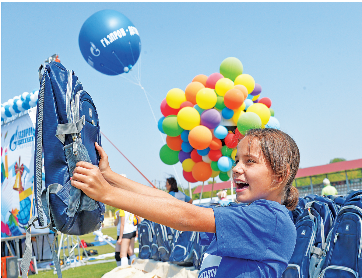
Только радость впереди.

Газовики поздравили воспитанников детских домов с началом учебного года