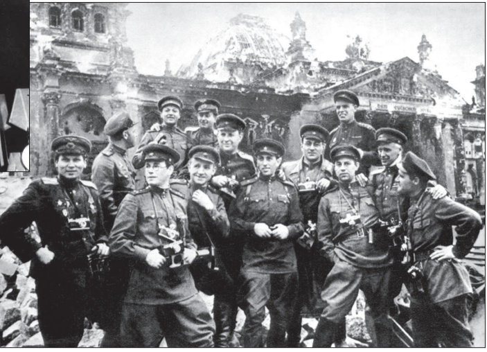
Военные фотографии у стен поверженного Рейхстага. Берлин, 1945 год.