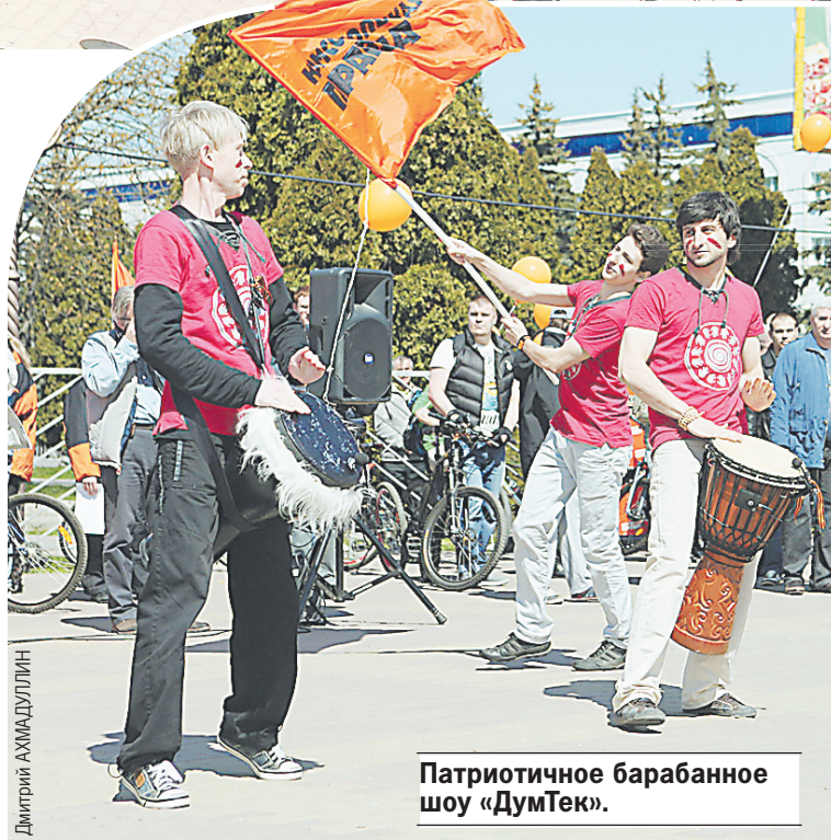
Патриотичное барабанное шоу «ДумТек».