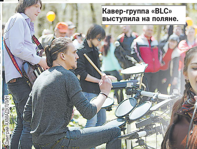
Кавер-группа «BLC» выступила на поляне.