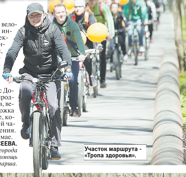
Участок маршрута - «Тропа здоровья».