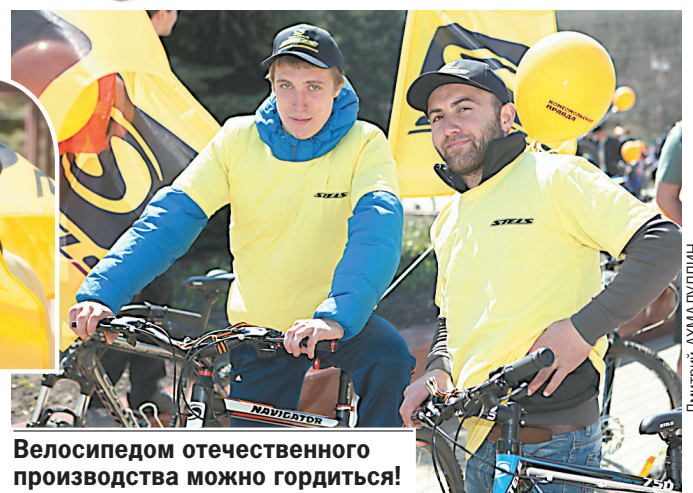
Велосипедом отечественного производства можно гордиться!