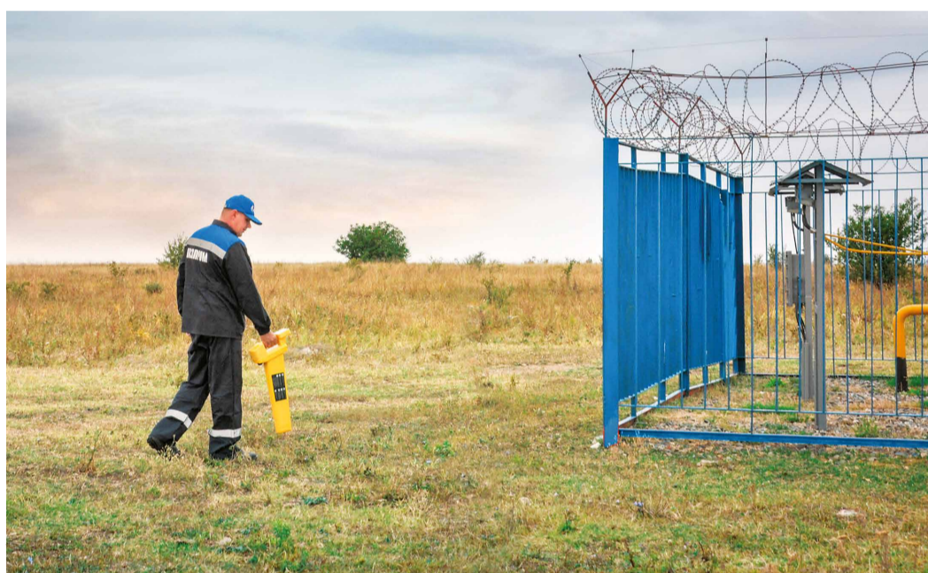
Определение трассы прохождения и глубины залегания кабеля с помощью кабелеискателя

– Поиск повреждения кабеля – задача не из простых, – делится рабочий. – Кабельные линии простираются на десятки километров, а дефект, к примеру, может быть размером с острие иглы. Оперативно обнаружить повреждение помогают измерительные приборы. После шурфовки кабеля определяется характер работы: либо монтаж муфты, либо за-