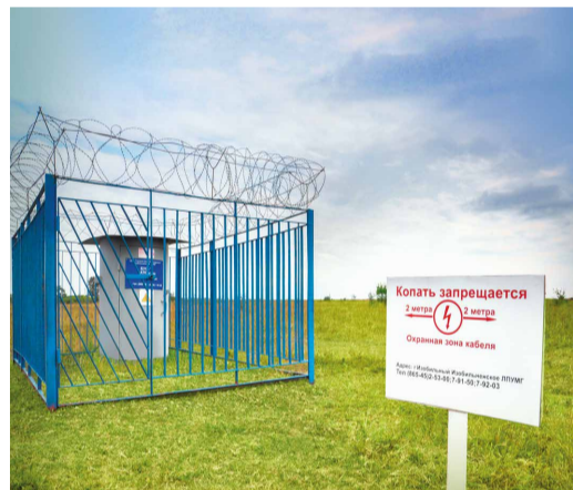
Необслуживаемый усилительный пункт

Кабельщик-спайщик – рабочий широкого профиля, который обслуживает, ремонтирует и эксплуатирует кабельные линии и наземные сооружения связи. Это целый комплекс разного рода оборудования, охватывающий все производственные и административные объекты Общества. Поэтому четкая и стабильная работа средств связи – важная составляющая надежной деятельности предприятия.