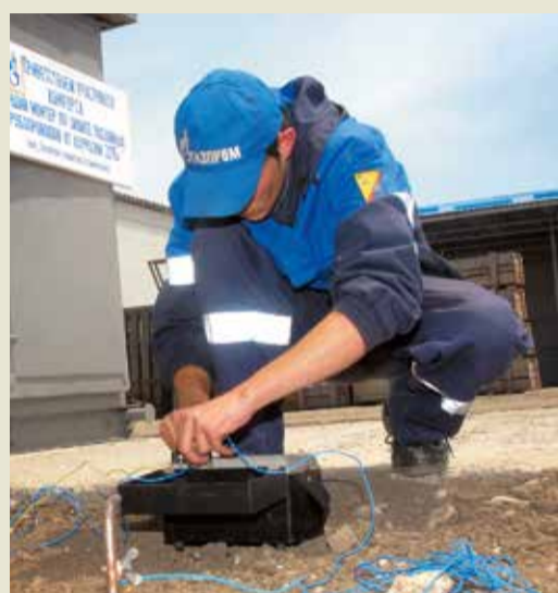
Определение коррозионной агрессивности грунта