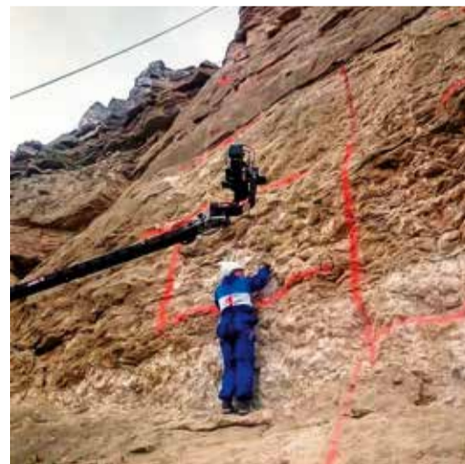
На отвесной скале