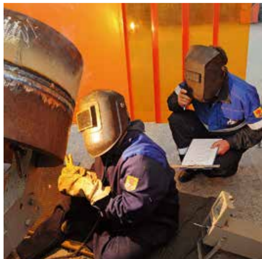
Выполнение конкурсного задания