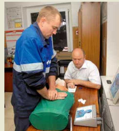
Практическое задание по сердечно-легочной реанимации