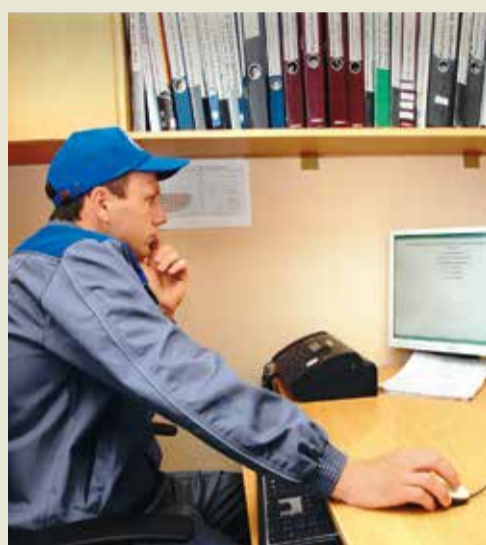
Выполнение теоретического задания