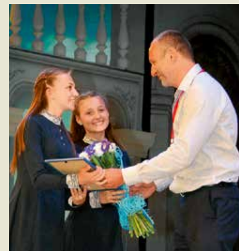
Награждение лауреатов фестиваля