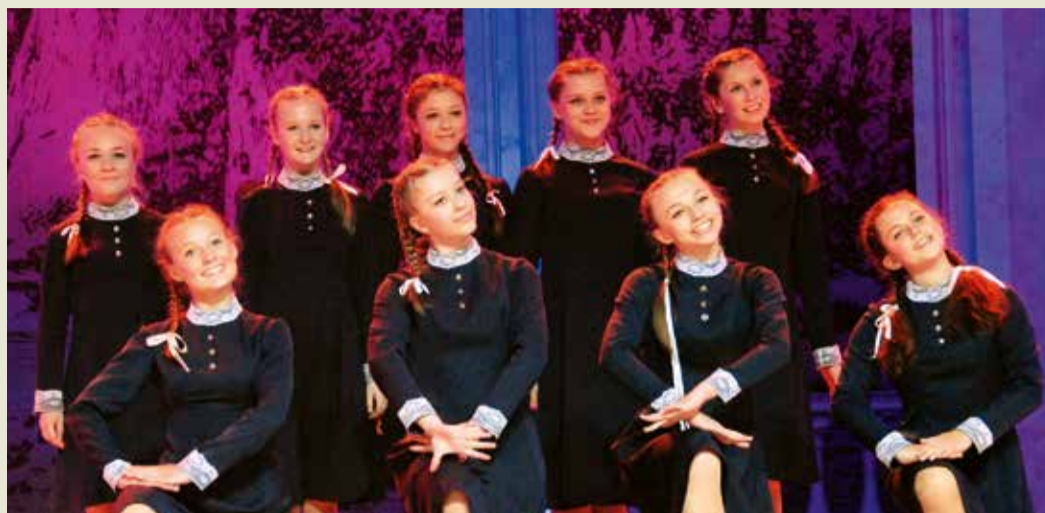
Выступление хореографического ансамбля «Незабудка»