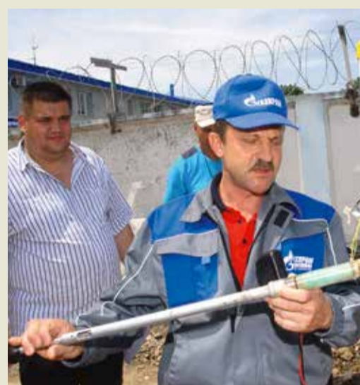
Подготовка электрода сравнения к замерам потенциалов