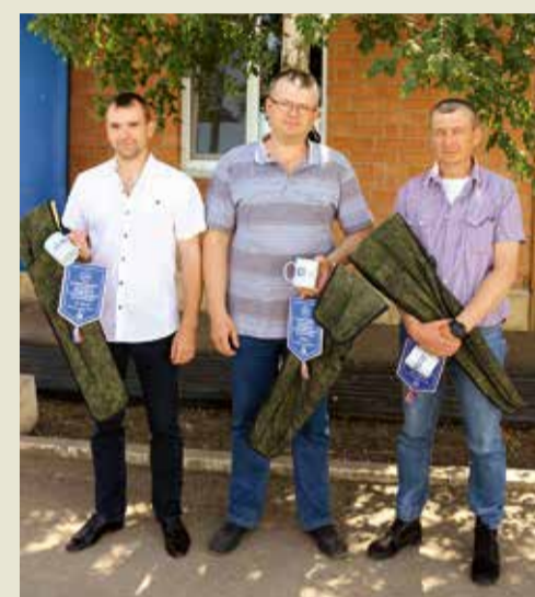
Победитель и призеры конкурса профмастерства