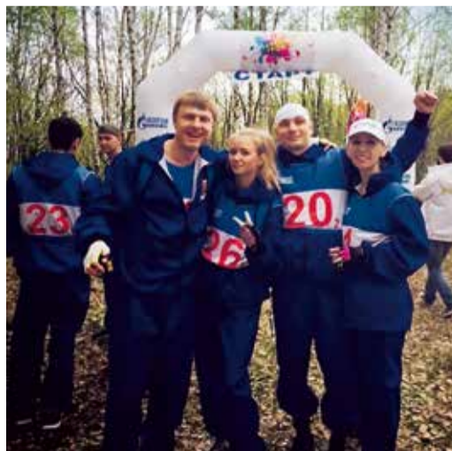
Наша команда перед стартом