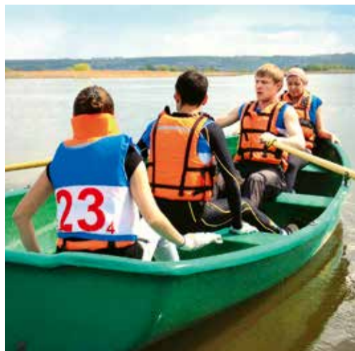
Заплыв на время