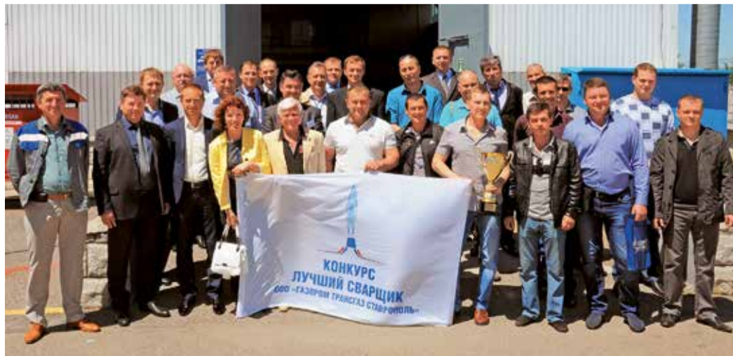
Участники смотр-конкурса «Лучший сварщик ООО «Газпром трансгаз Ставрополь» – 2015»