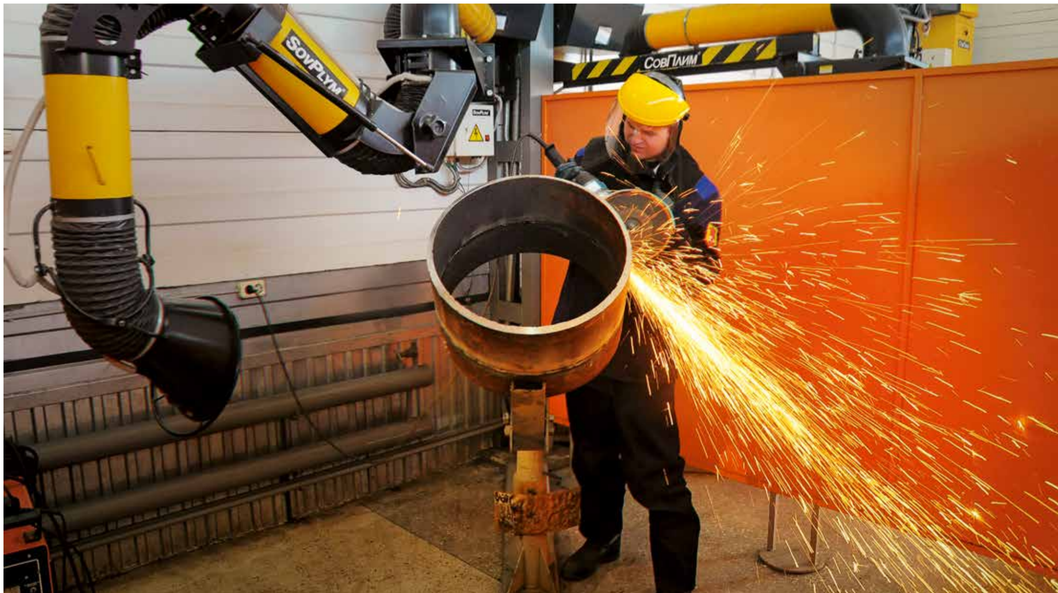
Конкурс сварщиков – одно из самых зрелищных состязаний в профессиональном мастерстве