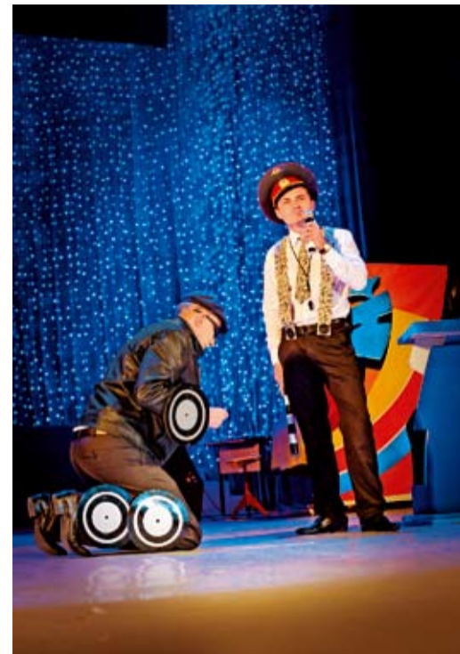
На сцене «человек-машина»