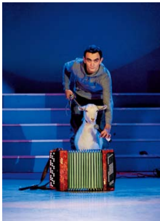
Коза с баяном