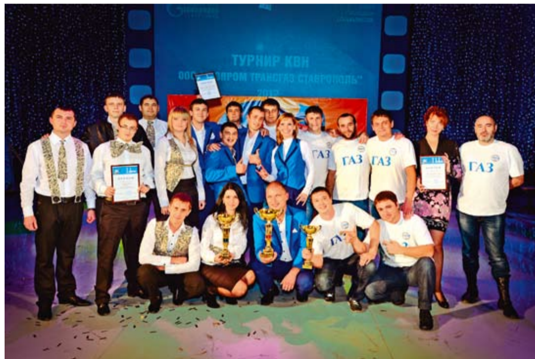
Победители и призеры турнира КВН-2012