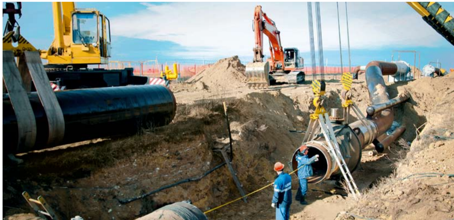
Работники ЛЭС готовятся к подключению камеры приема очистных устройств