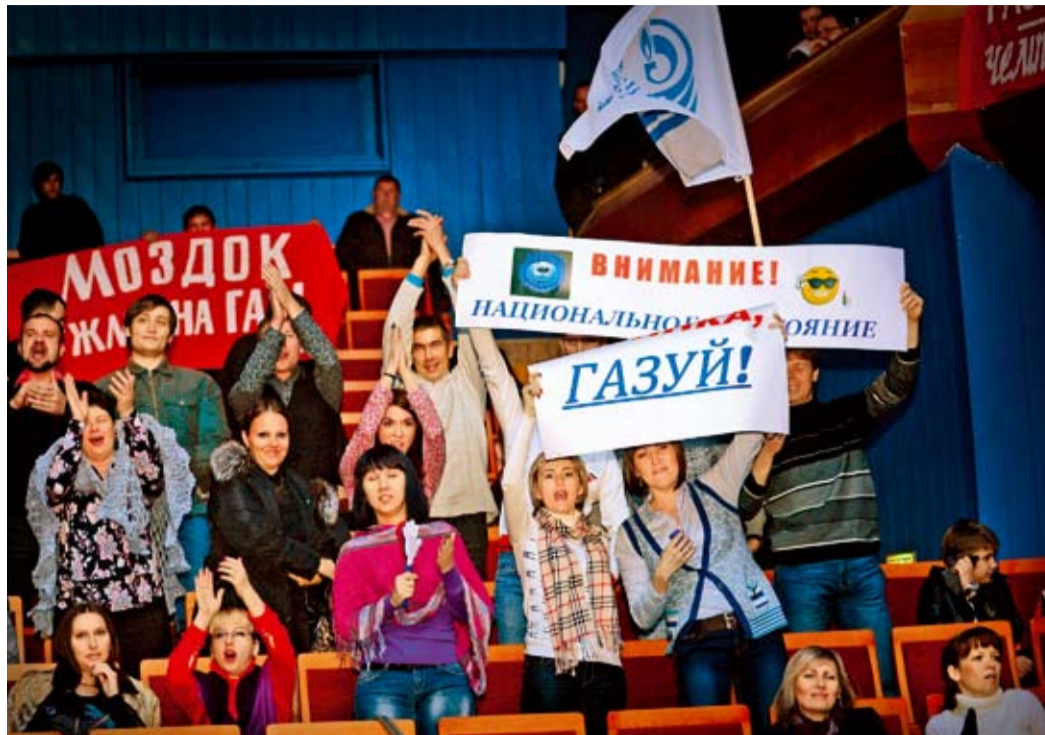
Болельщики горячо поддерживают свои команды