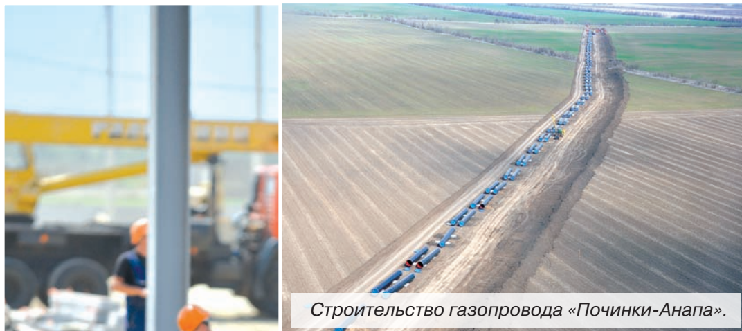
Строительство газопровода «Починки-Анапа».

Станция экономична и проста в эксплуатации. Для её обслуживания достаточно всего двух специалистов, значитель-