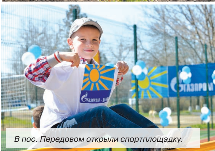
В пос. Передовом открыли спортплощадку.