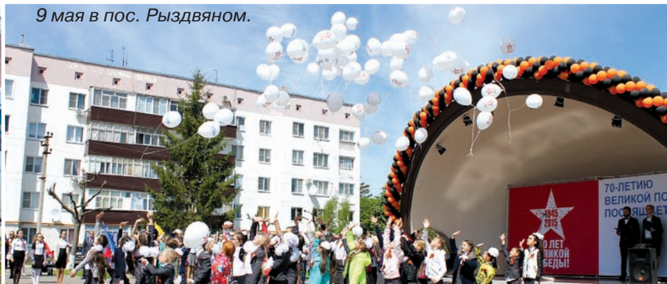
9 мая в пос. Рыздвяном.