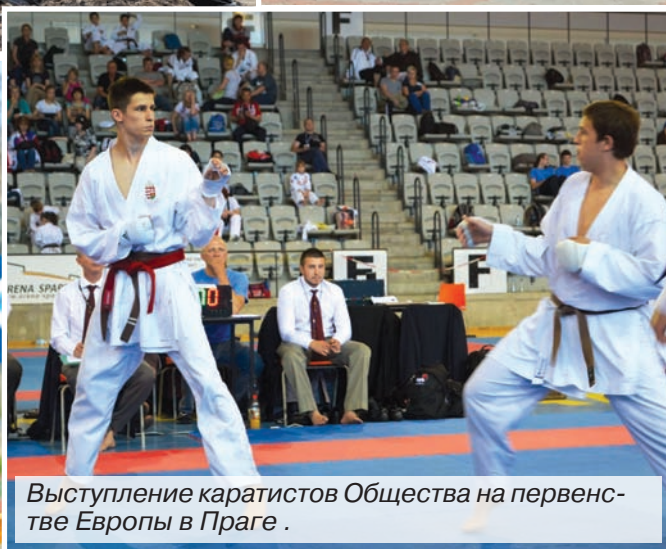
Выступление каратистов Общества на первенстве Европы в Праге.