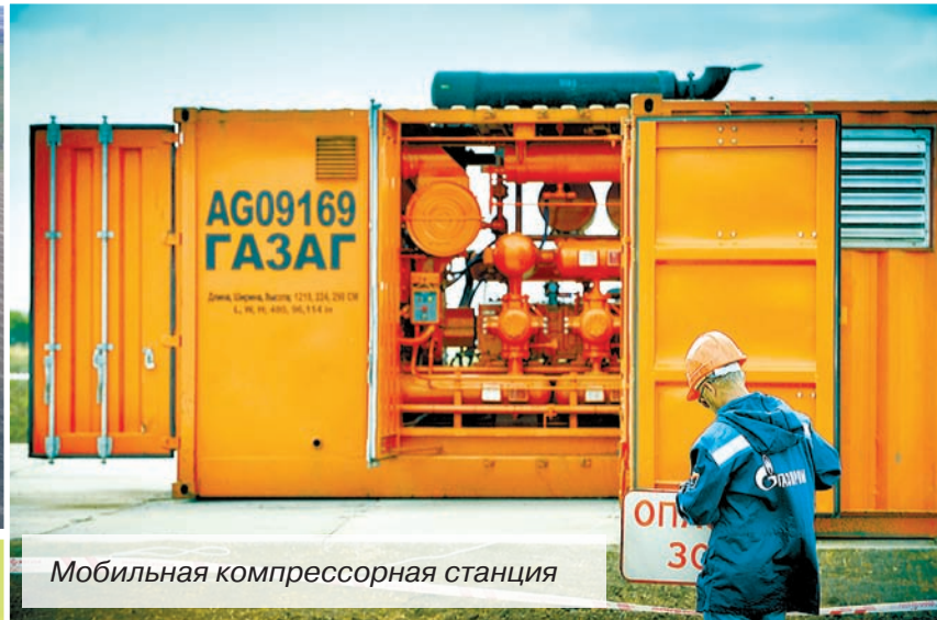
Мобильная компрессорная станция