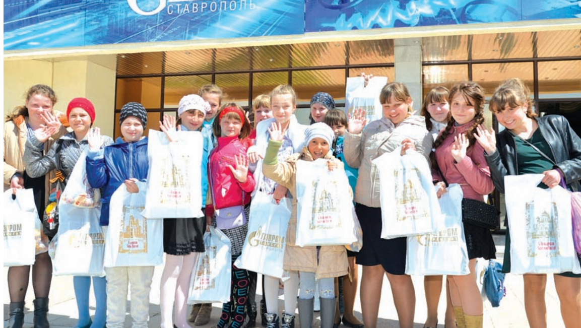
Благотворительный Пасхальный праздник. Более 500 ребят получили подарки.

- Газпром проводит по всей стране немало крупных социальных акций для детей и взрослых, множество благотворительных проектов. Как на вашем предприятии ре-