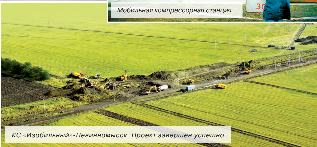
КС «Изобильный»-Невинномыск. Проект завершён успешно.