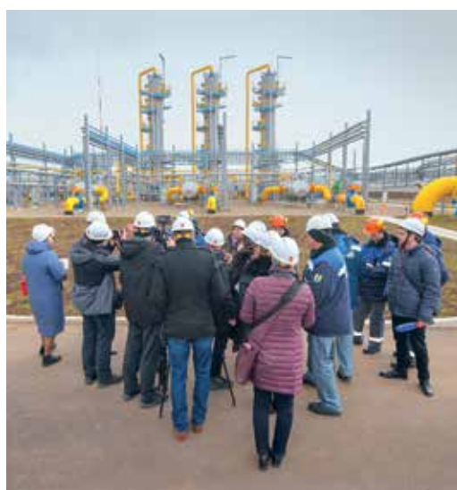
Журналисты на ДКС-2

кубометров газа в сутки. Высокотехнологичное оборудование ДКС-2 обеспечивает возможность максимальной суточной производительности Северо-Ставропольского подземного хранилища газа в условиях пиковых нагрузок осенне-зимнего периода.