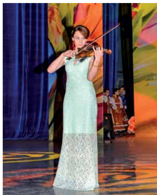
На юбилее УТТиСТ