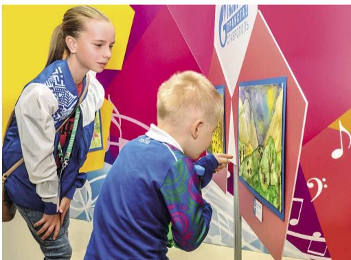
Выставка произведений юных художников