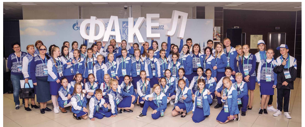
Команда Общества на зональном туре «Факела» в Казани