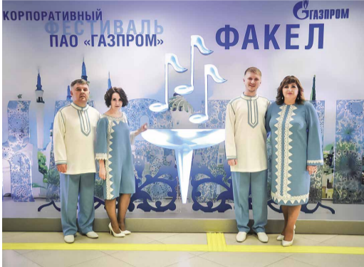
Ансамбль «Живая вода»