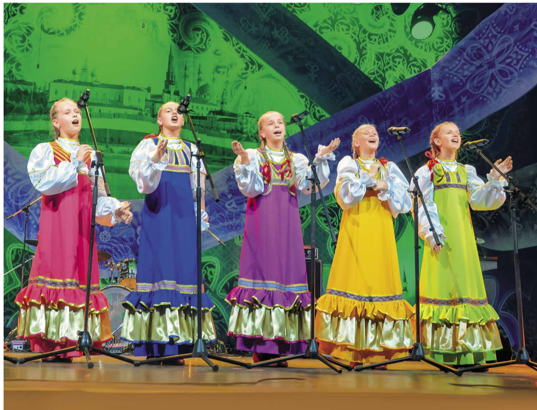
Выступает ансамбль «Родничок»