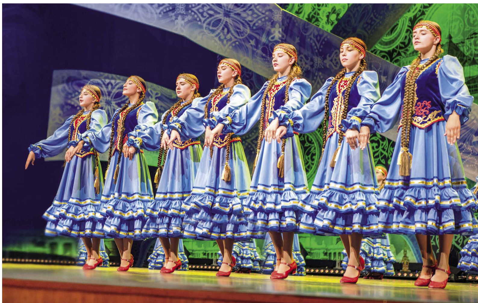
Народный детский хореографический ансамбль «Задумка» выступил с башкирским танцем