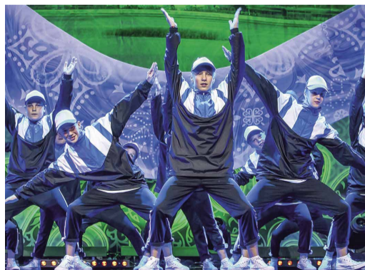
Коллектив «Lucky Jam»