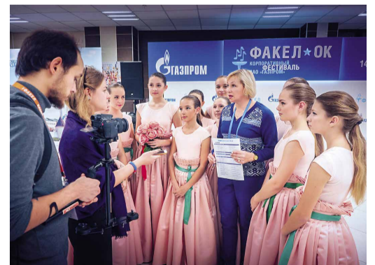
Интервью у ансамбля «Незабудка»