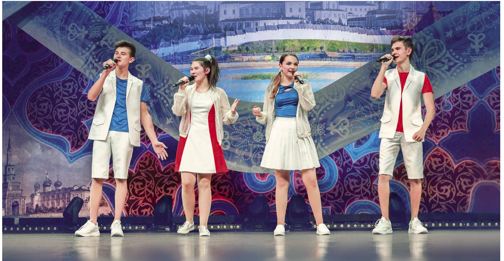
Ансамбль «Новый день»