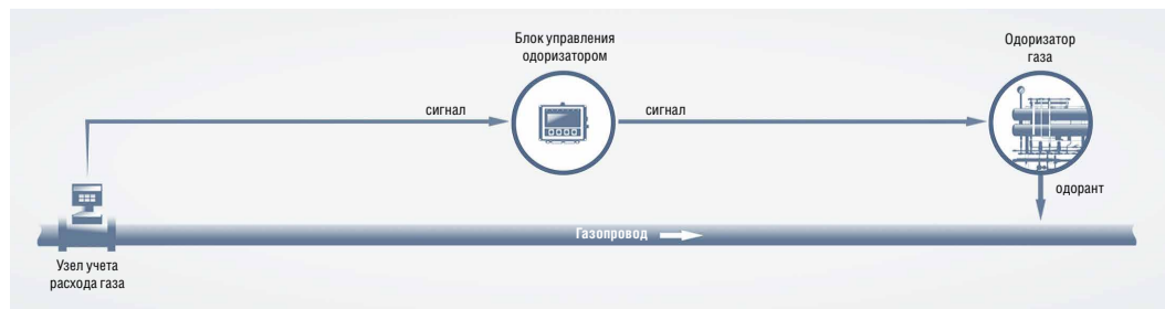
Схема процесса одоризации газа