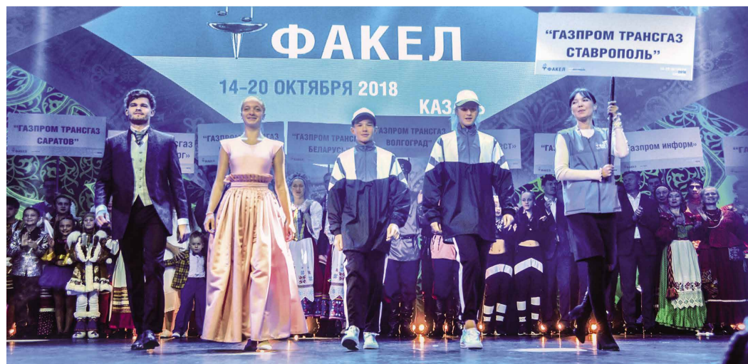
Представители ООО «Газпром трансгаз Ставрополь» на параде делегаций фестиваля