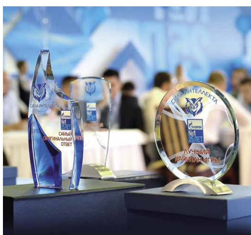
Награды — лучшим игрокам