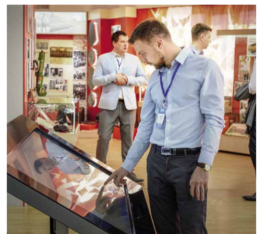
В выставочно-информационном комплексе Общества