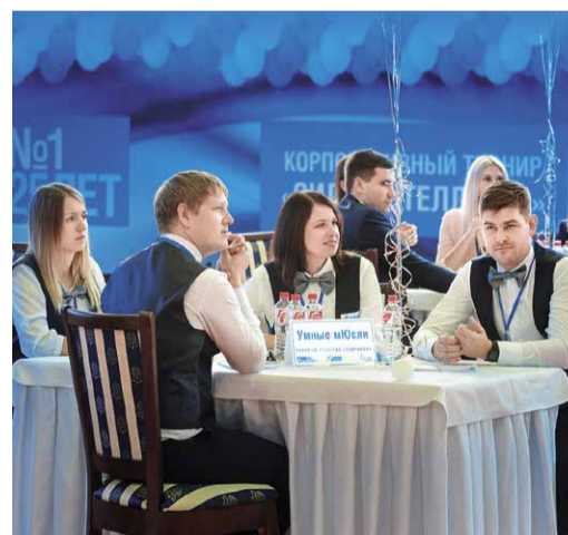
Команда ООО «Газпром трансгаз Ставрополь»