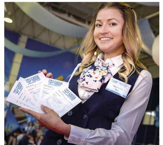
К турниру готовы!

— Много лет вместе с Обществом «Газпром трансгаз Ставрополь» мы реализуем проекты, связанные с интеллектуальными играми. У нас уже были турниры, посвященные таким непростым, но очень важным аспектам деятельности предприятия, как экология, охрана труда и техника безопасности. Сегодня встреча праздничная — посвящена 25-летию ПАО «Газпром». За четверть века Россия совершила рывок вперед и продолжает развиваться. Поэтому сегодня мы вспоминали историю страны, историю компании. Несмотря на то, что призовые места распределились в соответствии с результатами, я все же считаю, что главный победитель этого турнира один — ПАО «Газпром», где работает талантливая, активная, эрудированная молодежь.