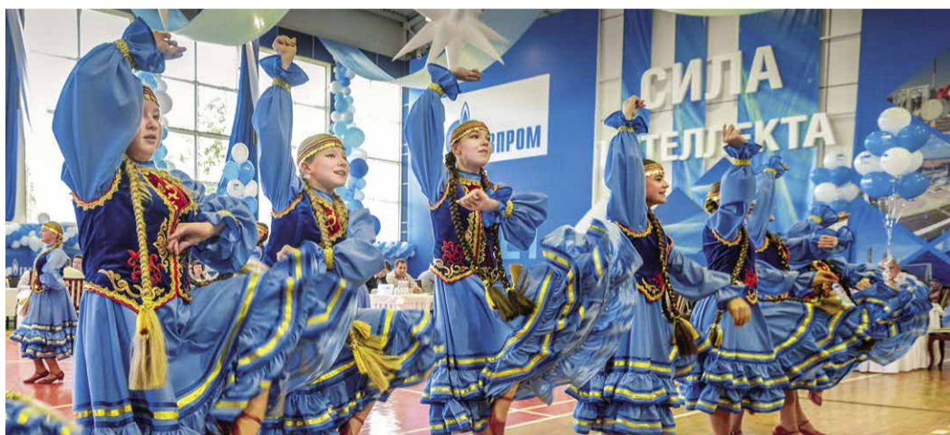
Выступление хореографического ансамбля «Задумка»