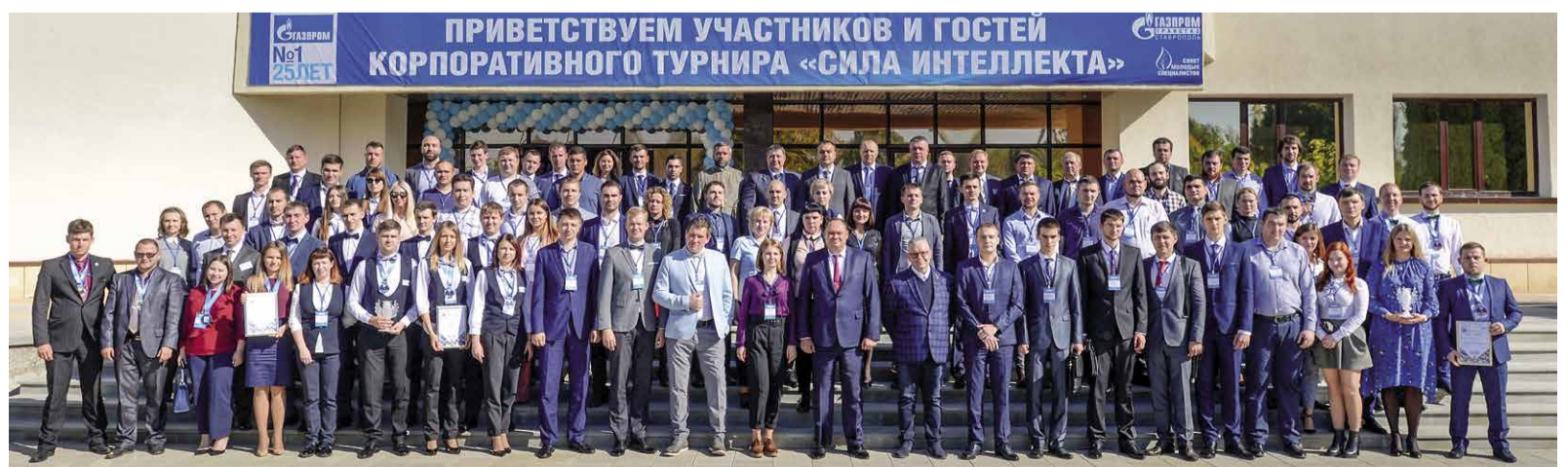
Участники и гости турнира «Сила интеллекта»