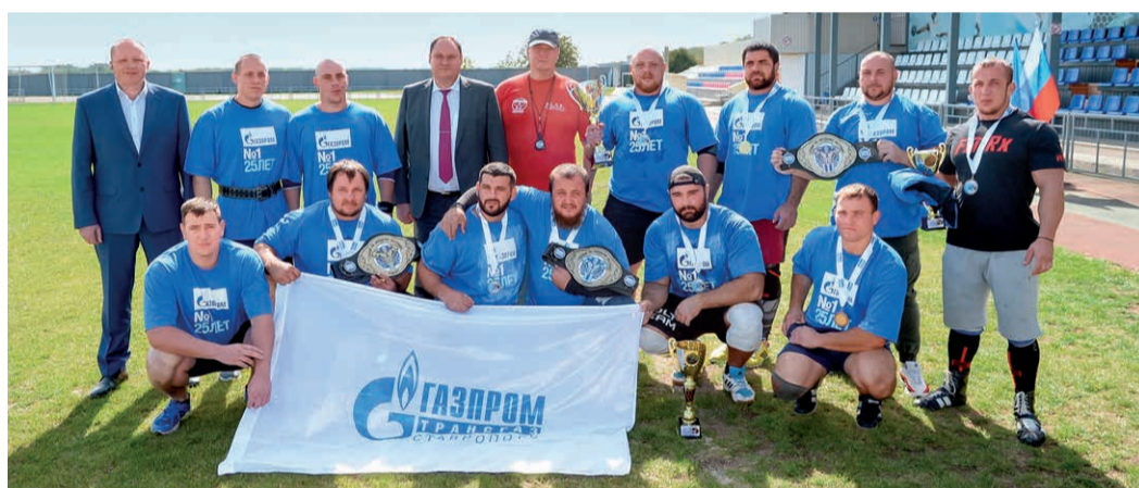
Руководство Общества с победителями и призерами соревнований