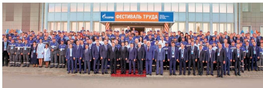
Участники и гости первого Фестиваля труда

Фестиваль труда — новый формат организации корпоративных конкурсов профессионального мастерства. Он предусматривает проведение сразу нескольких конкурсов в рамках