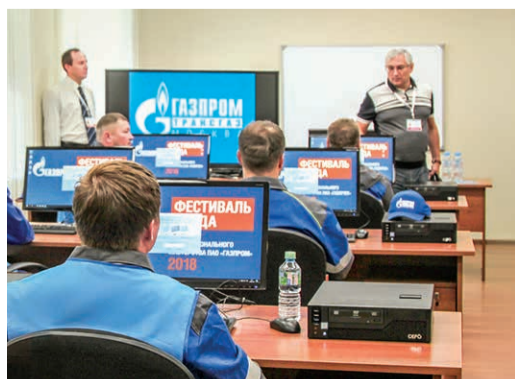
Испытание по теории