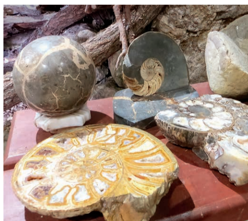
Фрагмент выставки в монастыре