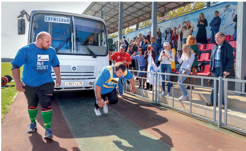
Трек-пул — самое зрелищное упражнение турнира

Насыщенная соревновательная программа позволила проверить выносливость и силовые качества атлетов. Спортсмены поднима-