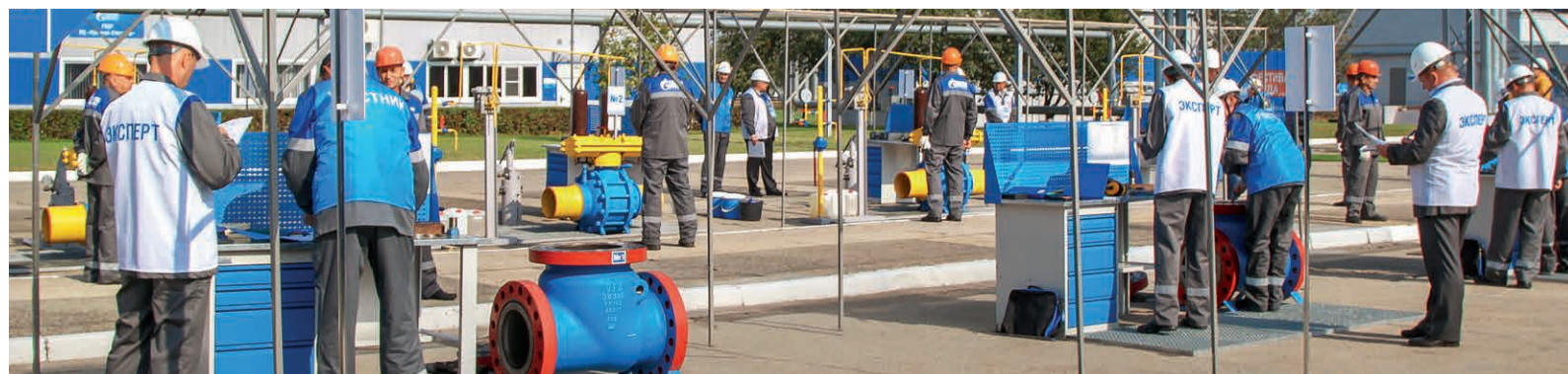
Выполнение практического задания