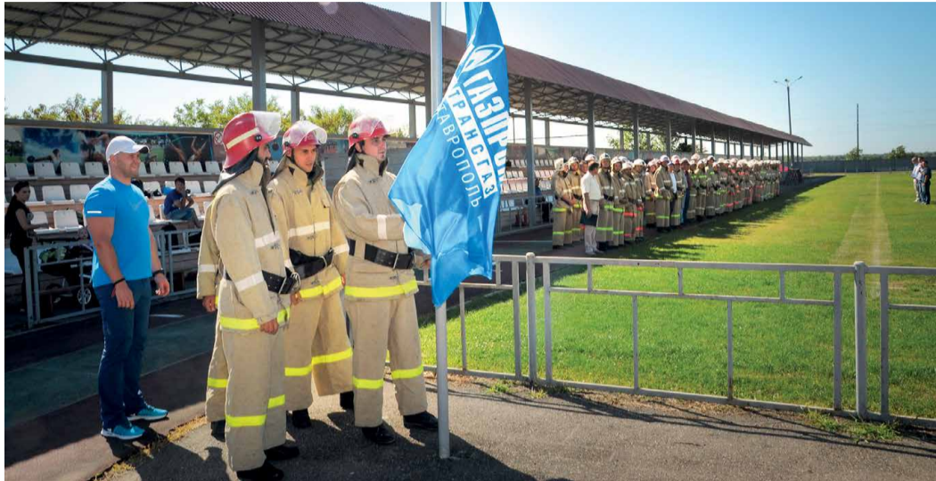
Подъем флага на торжественном построении

предприятия. Огнеборцы продемонстрировали мастерство в двух упражнениях: пожарной эстафете и боевом развертывании. В общем зачете победителем стала команда УТТИСТ. Второй результат — у бойцов Невинномысского ЛПУМГ. Третье место завоевали представители Моздокского ЛПУМГ. Победителей и призеров поощрили памятными медалями, кубками и дипломами.