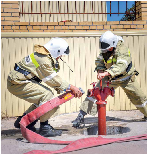
Установка пожарной колонки на гидрант