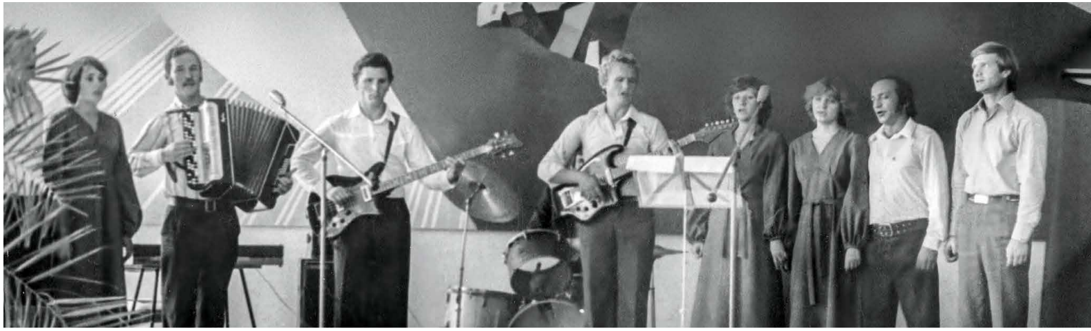
Выступление коллектива художественной самодеятельности в Светлоградском УДТГ