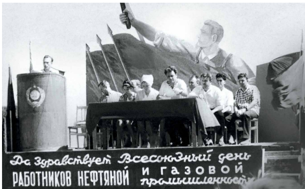
Первое празднование Дня работников нефтяной и газовой промышленности в Привольненском ЛПУМГ

Первый праздник нефтяников и газовиков пришелся уже на 5 сентября 1965 года. В подавляющем большинстве это празднование свелось к организации в трудовых коллекти-