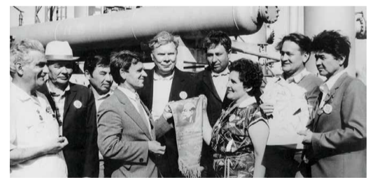
Чествование передовиков производства