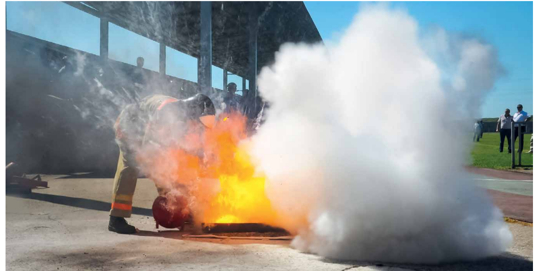
Тушение огня порошковым огнетушителем