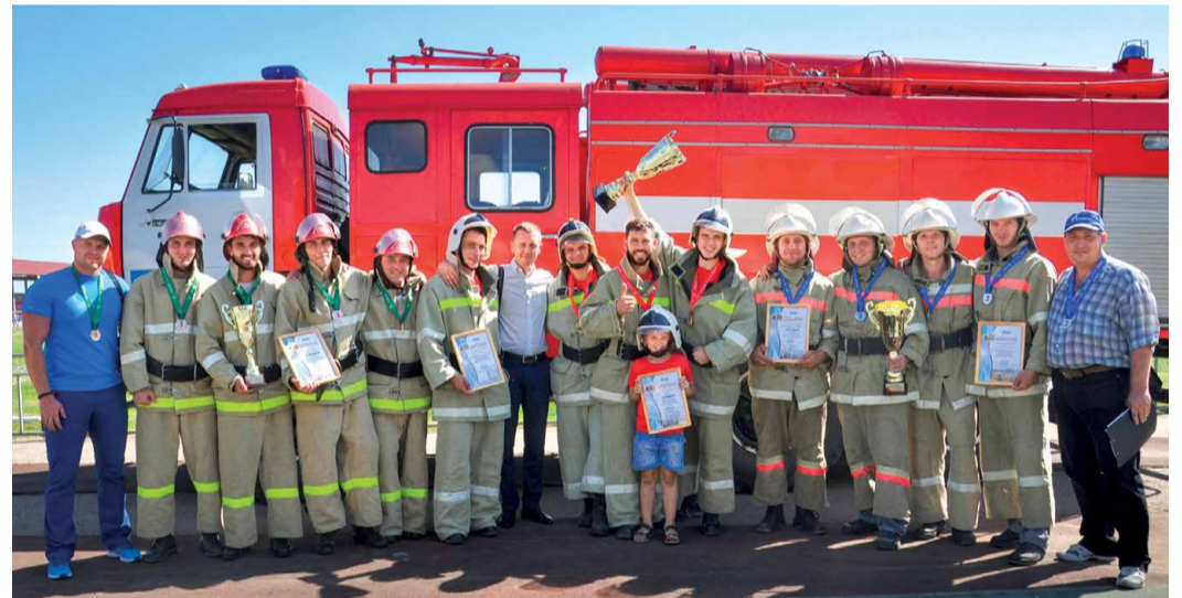
Победители и призеры состязаний