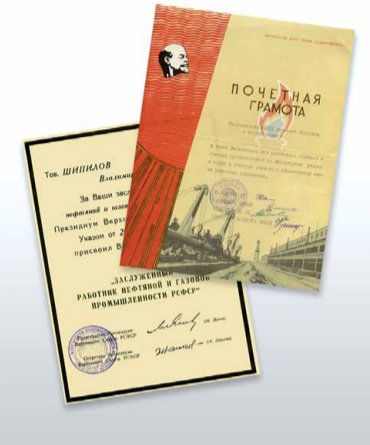
Награды минувших лет