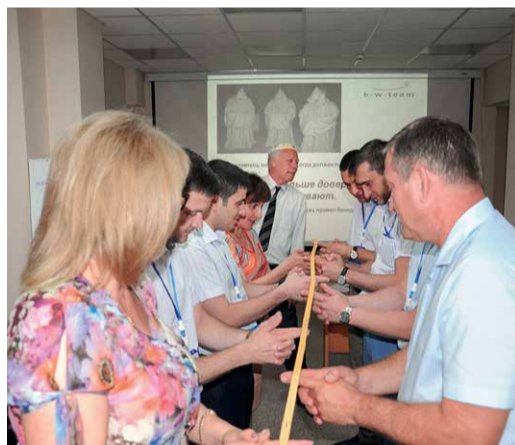
Тренировка управленческих компетенций