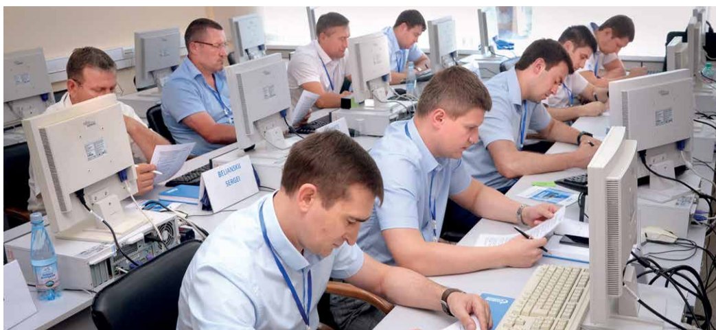
Практическое задание для участников семинара