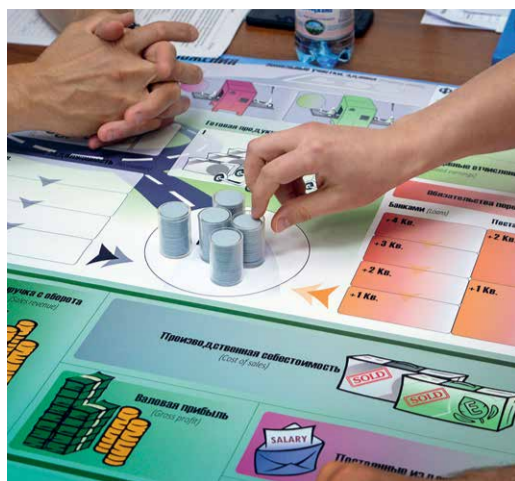
Предпринимательская игра «WikiSim»