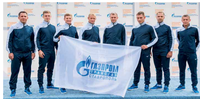
Команда ООО «Газпром трансгаз Ставрополь»