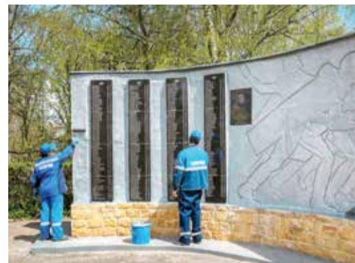
Станица Барсуковская, Невинномысское ЛПУМГ