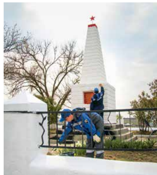
Город Светлоград, Светлоградское ЛПУМГ