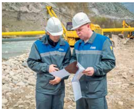
Обсуждение рабочих моментов

Сварочно-монтажные работы, монтаж и демонтаж воздушного перехода, а также замена одной из опор также легли на плечи бригад УАВР. Газовики предварительно сварили трубу в плет и, уложив ее на опоры, провели пневматические испытания на прочность и герметич-