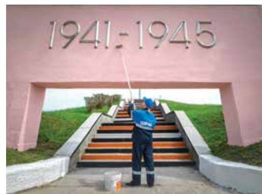
Поселок Солнечнодольск, Изобильненское ЛПУМГ