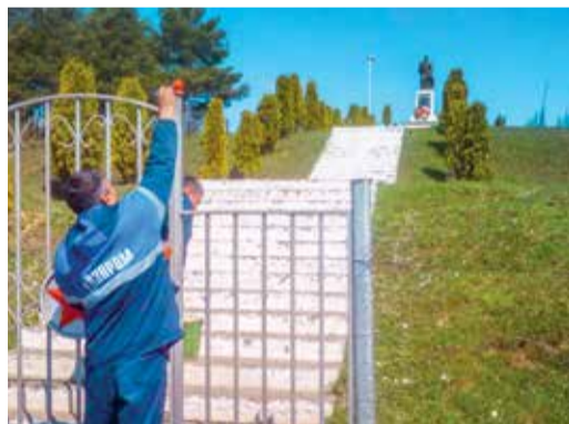
Селение Тбет (Южная Осетия), Моздокское ЛПУМГ