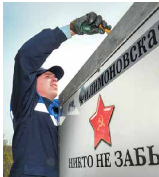
Станица Филимоновская, УТТиСТ