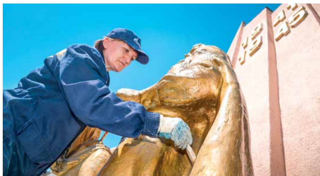
Ремонт памятника в селе Птичьем, Изобильненское ЛПУМГ

Сотрудники Общества завершают работы по ремонту и реставрации памятников и мемориалов в память о погибших в Великой Отечественной войне. Всего под опекой филиалов предприятия находятся около 50 объектов в Северо-Кавказском и Южном федеральном округах и Республике Южная Осетия. Это мемориальные комплексы, расположенные в городах, обелиски, братские могилы, захоронения неизвестных солдат в небольших поселениях.