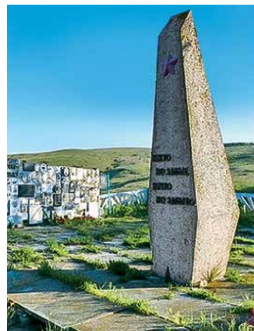
Братская могила, село Юркино, Крым