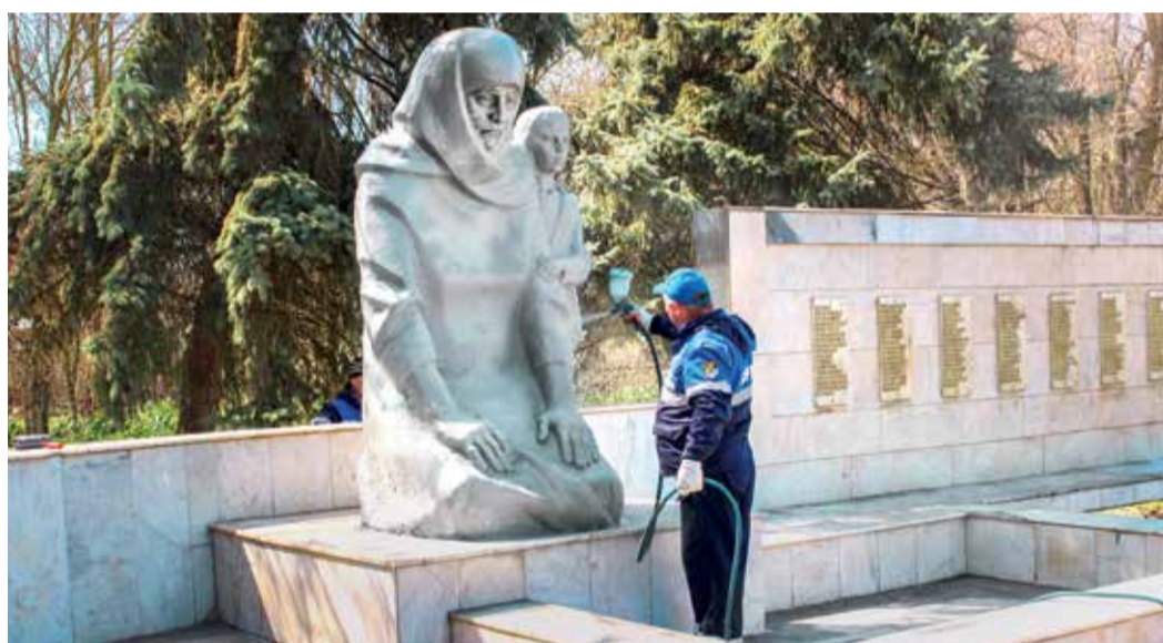
Село Ачикулак, Нефтекумское ЛПУМГ