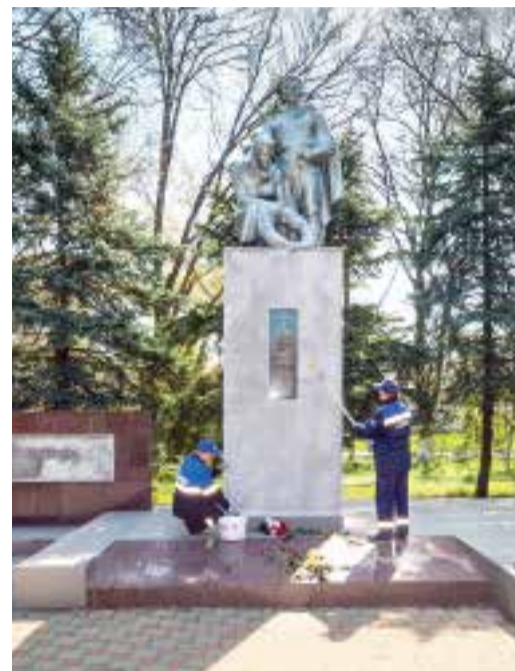
Мемориал в городе Изобильном