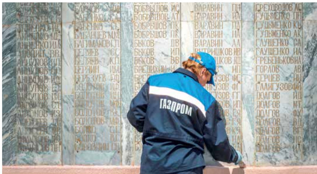
Мемориал в селе Птичьем, Изобильненское ЛПУМГ