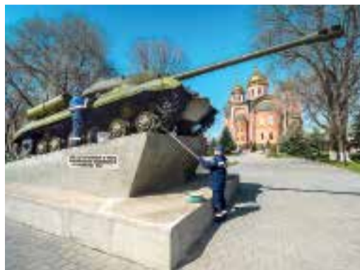
Мемориал в городе Изобильном, Изобильненское ЛПУМГ