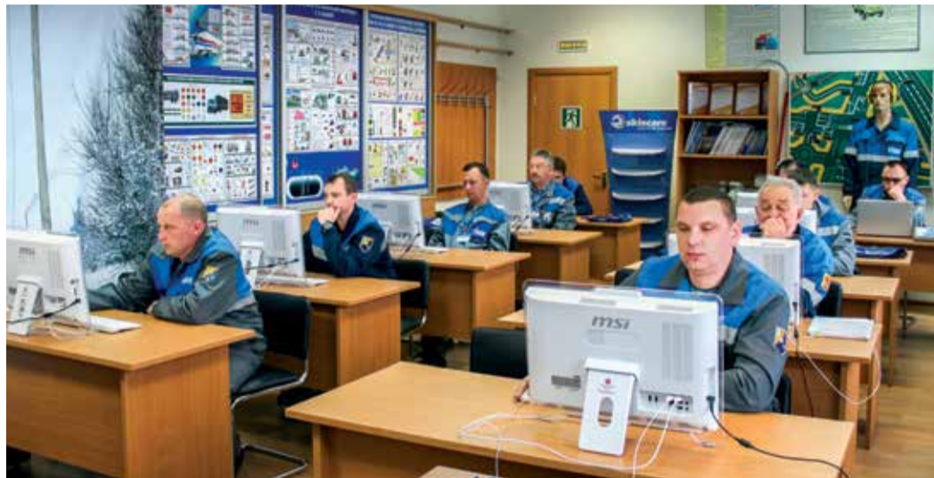
Первый этап конкурса — проверка теоретических знаний