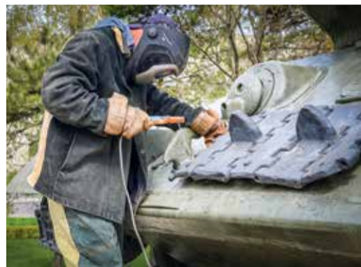
Танк в Ставрополе, ИТЦ