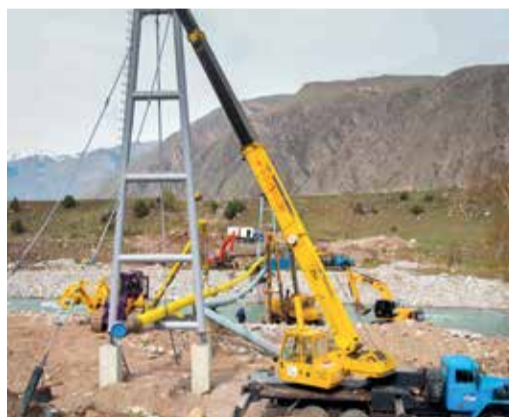
Укладка воздушного перехода на проектные отметки