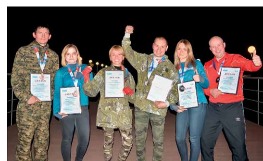
Победители и призеры турслета в личном зачете