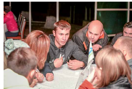
Брейн-ринг, посвященный Году экологии в ПАО «Газпром»