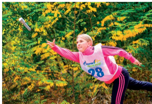
Метание спортивного снаряда

Кубки, медали, грамоты... День молодого работника завершился торжественным награждением победителей и призеров. Масштабный праздник, объединивший десятки