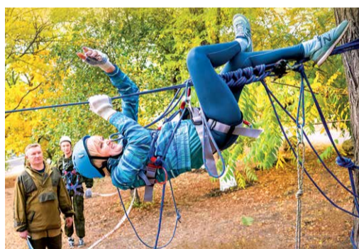
Преодоление навесной переправы

молодых газовиков из разных подразделений Общества, подарил целую гамму ярких впечатлений. Удовлетворение от побед, чувство дружеской поддержки и взаимовыручка, ощущение родства в большой семье газовиков. А еще оставил в сердцах молодых искреннее желание — через два года непременно встретиться вновь!