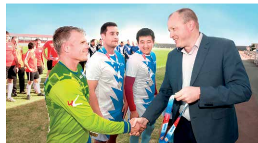
Награждение лучших игроков