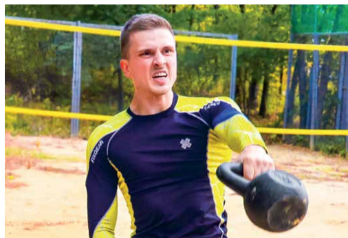
Нормы ГТО сдают гиревики