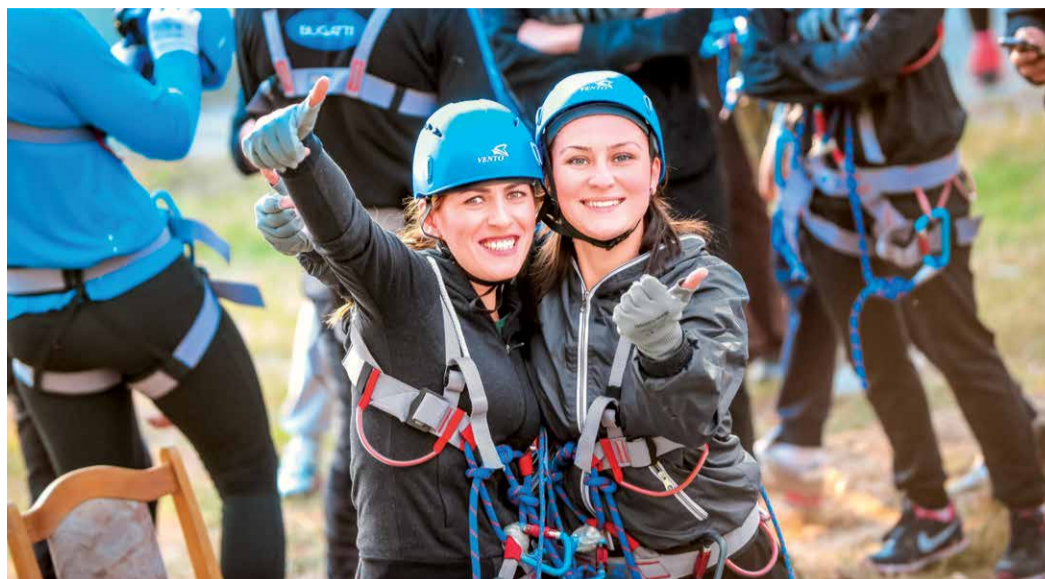
Радость после прохождения дистанции

Бег, подтягивание на перекладине, наклоны вперед из положения стоя, поднимание туловища из положения лежа, прыжки в длину, метание спортивного снаряда, стрельба из пнев-