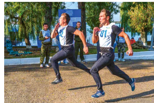
Бег на сто метров