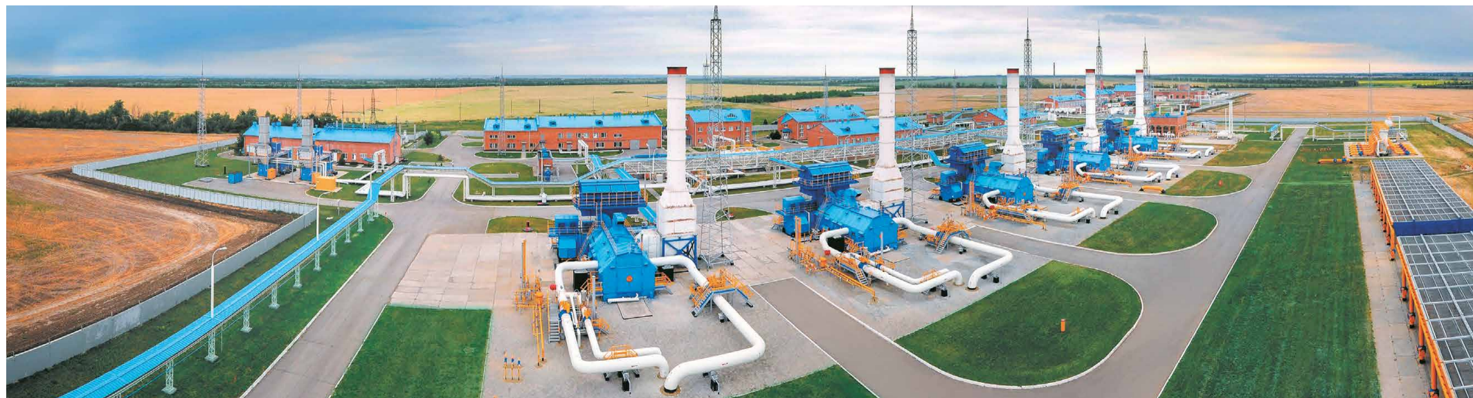
Компрессорная станция «Сальская»