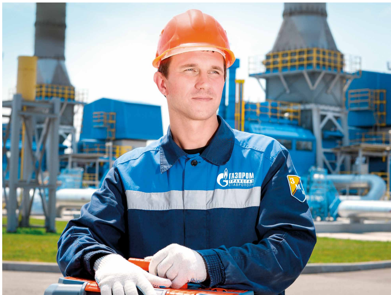
Газовики ООО «Газпром трансгаз Ставрополь» подвели итоги полугодовой работы