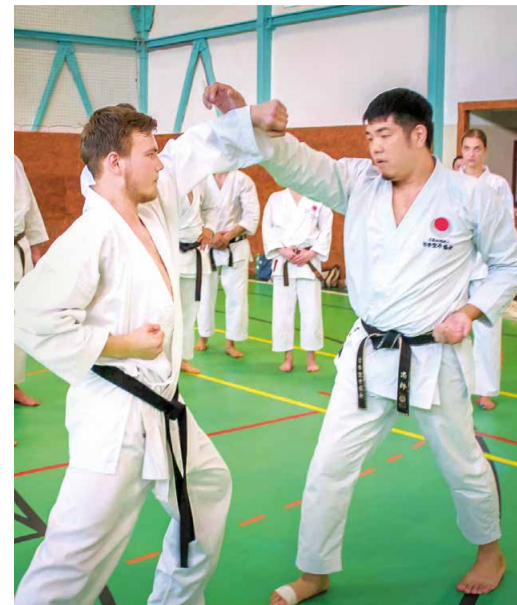
Отработка базовой техники

Из Прахатицы каратисты ООО «Газпром трансгаз Ставрополь» отправились на учебно-