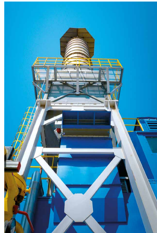
Газоперекачивающий агрегат на компрессорной станции