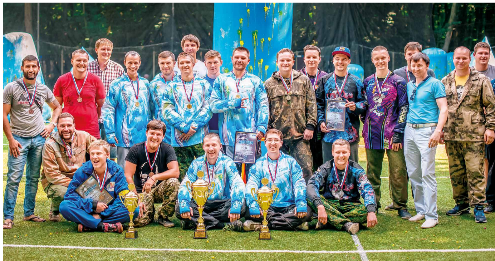
Лучшие пейнтболисты ООО «Газпром трансгаз Ставрополь»