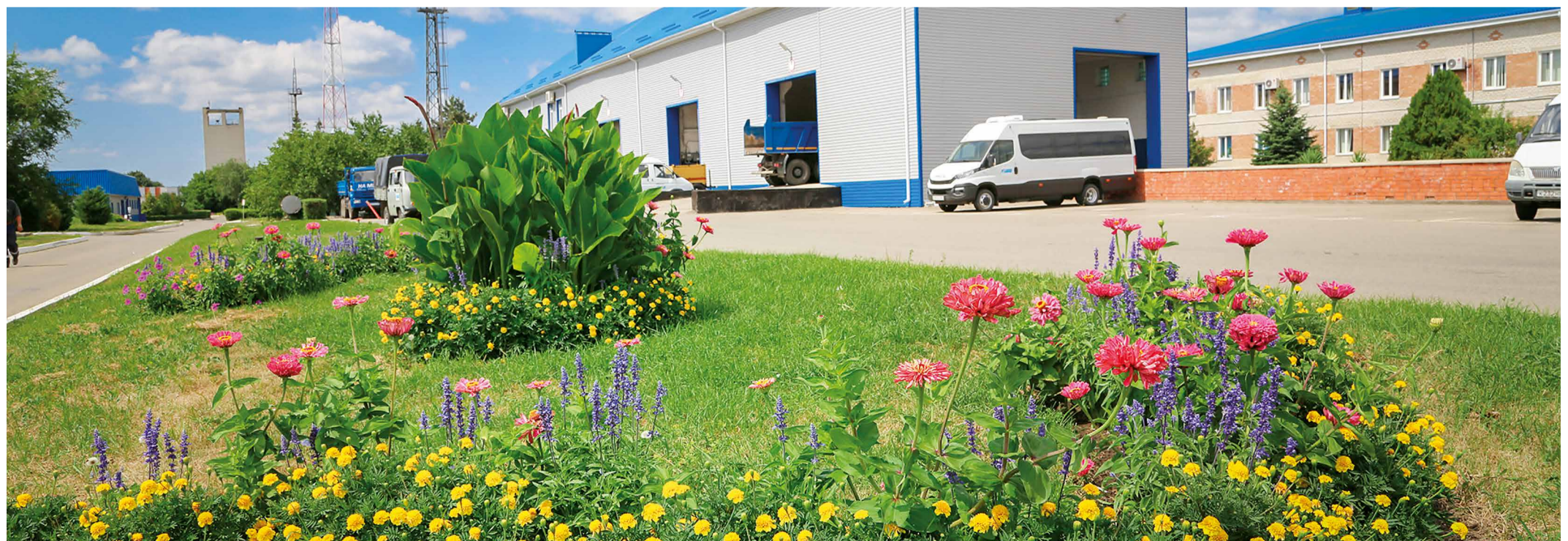
Ухоженные клумбы на территории Невинномысского ЛПУМГ