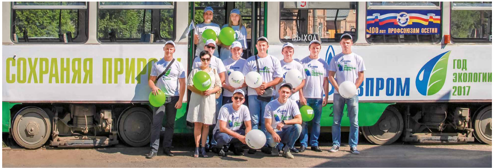
Участники экологической акции «Зеленый трамвай»

Во Владикавказе – столице Республики Северной Осетии – Алании – работники ООО «Газпром трансгаз Ставрополь» провели масштабную экологическую акцию «Зеленый трамвай».