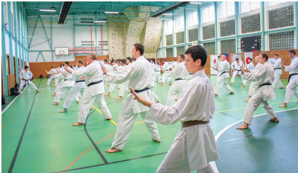
Каратисты ООО «Газпром трансгаз Ставрополь» на мастер-классе

Формат семинара предполагал занятия в группах, проходившие в режиме нон-стоп. Начинались тренировки рано утром, а заканчивались поздно вечером. Перерывов между