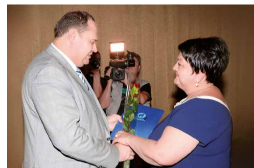
Чествование лучших работников Общества

0 АВАРИЙ И ИНЦИДЕНТОВ, СВЯЗАННЫХ С ПРОИЗВОДСТВОМ