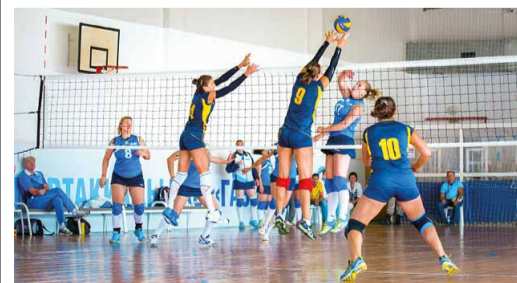
Женская волейбольная команда Общества