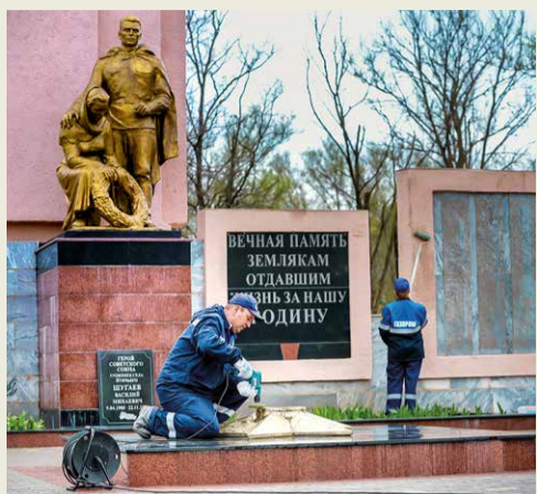
Село Птичье Ставропольского края

округах. Это мемориальные комплексы, расположенные в больших городах, обелиски, братские могилы, захоронения неизвестных солдат в селах и хуторах. В ремонтные работы входили реставрация покрытия памятников, обновление надписей, благоустройство и озеленение.