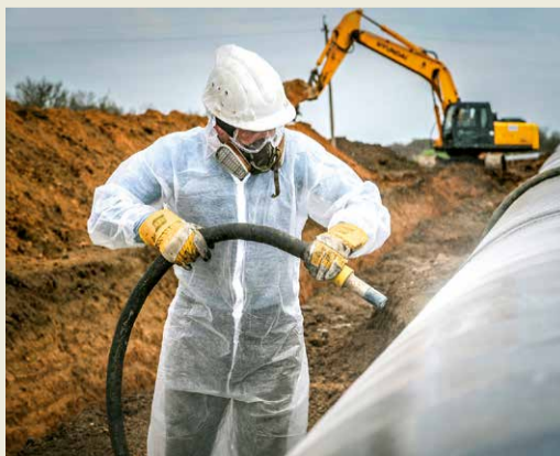
Подготовка трубы к изоляции