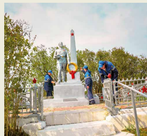
Село Побегайловка Ставропольского края