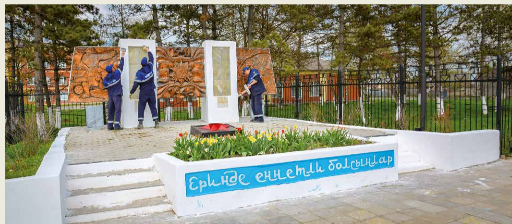
Село Кангли Ставропольского края