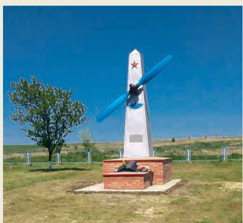
Село Преградное Ставропольского края