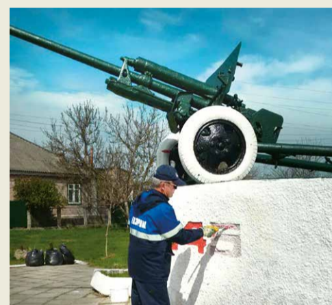
Поселок Калининский, РСО – Аляния