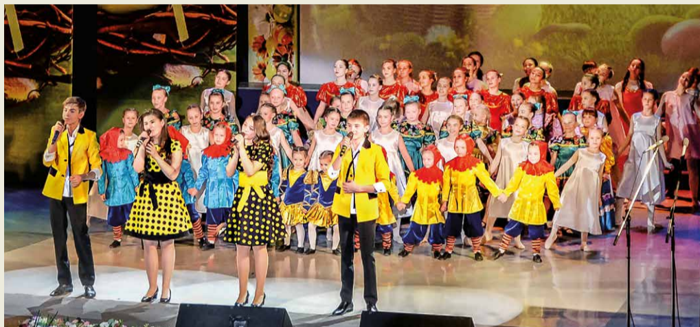
Выступление артистов и творческих коллективов Дворца культуры и спорта Общества