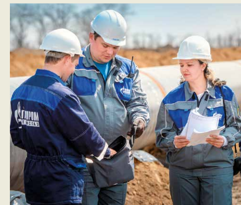
Обсуждение производственных вопросов