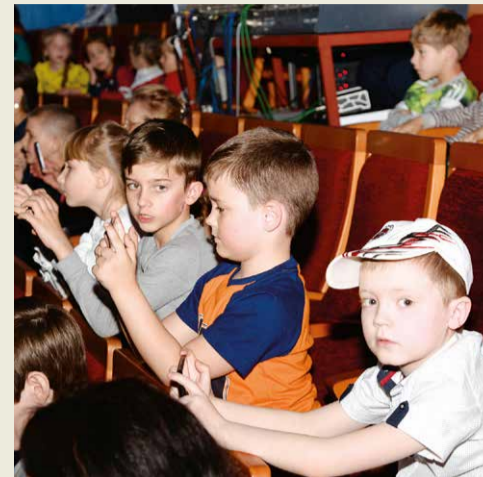
В зрительном зале