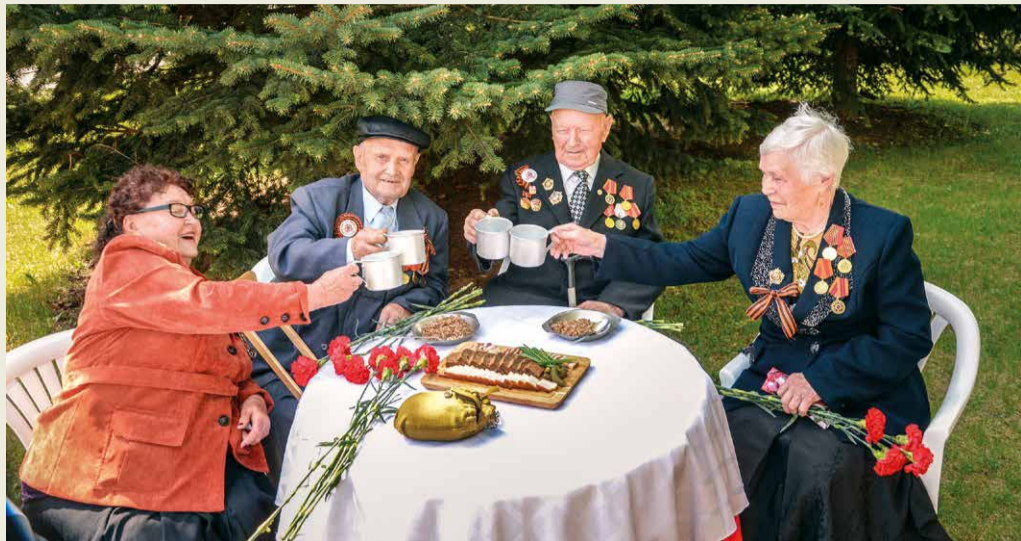
Традиционная встреча ветеранов

разведывательной роты Гвардейского десантно-штурмового Кавказского казачьего полка. После минуты молчания участники митинга вместе с ветеранами возложили цветы к Вечному огню. Празднование продолжилось во Дворце культуры и спорта, где гостей ждал концерт, подготовленный участниками лучших творческих коллективов предприятия.