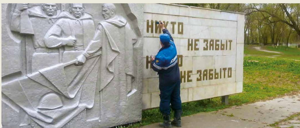
Село Каясула Ставропольского края