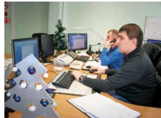
В диспетчерской Астраханского ЛПУМГ