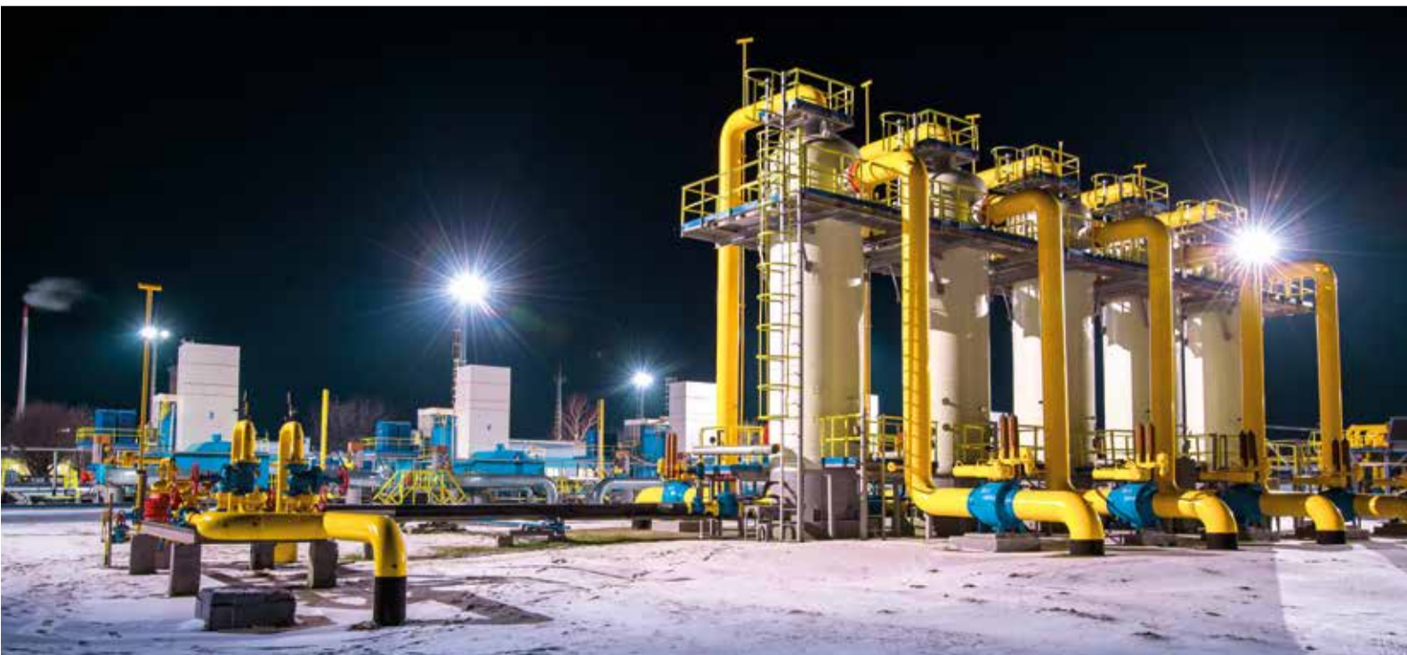
КС «Изобильненская» в полной готовности к новогоднему празднику

– С полным спокойствием воспринял известие о том, что предстоит дежурить в новогоднюю ночь. Родные тоже отнеслись с пониманием – работа есть работа. В праздник режим дежурства всегда усилен. Повышенное внимание и к безопасности в здании, и к контролю прилегающей территории. Ничто не должно омрачить праздник. Ну а в Новый год атмосфера в здании администрации царит совершенно особенная. Ходить на обходы в удовольствие – новогодние украшения в коридорах очень поднимают настроение. Да и вокруг здания ощущается торжественность. Елка, гирлянды, радостные улыбки прохожие – все говорит о наступлении главного зимнего праздника.