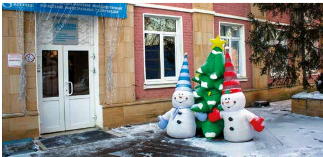
В Привольненском ЛПУМГ к встрече Нового года готовы