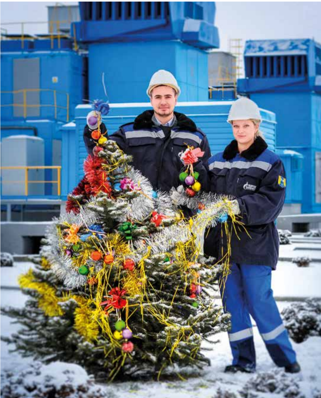
Символ новогоднего праздника на ДКС-1

Под чутким контролем обслуживающего персонала будут работать в новогоднюю ночь газораспределительные станции Общества. Их отлаженное и надежное функционирование