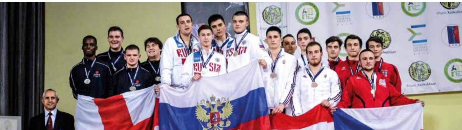
На пьедестале почести в Халкиде