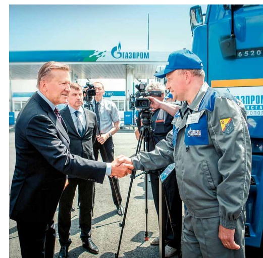
Водители Общества общаются с Виктором Зубковым