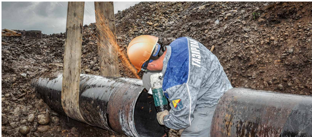
Обработка кромки трубы для дальнейшей сварки катушки

В траншеях плечом к плечу работают специалисты сразу нескольких филиалов: Невинномысского, Георгиевского, Моздокского ЛПУМГ и УАВР. Стараются трудиться качественно и оперативно. От мастерства газовиков зависит надежность снабжения голубым топливом полумиллиона жителей