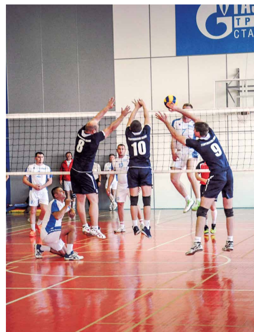
Финал мужского турнира