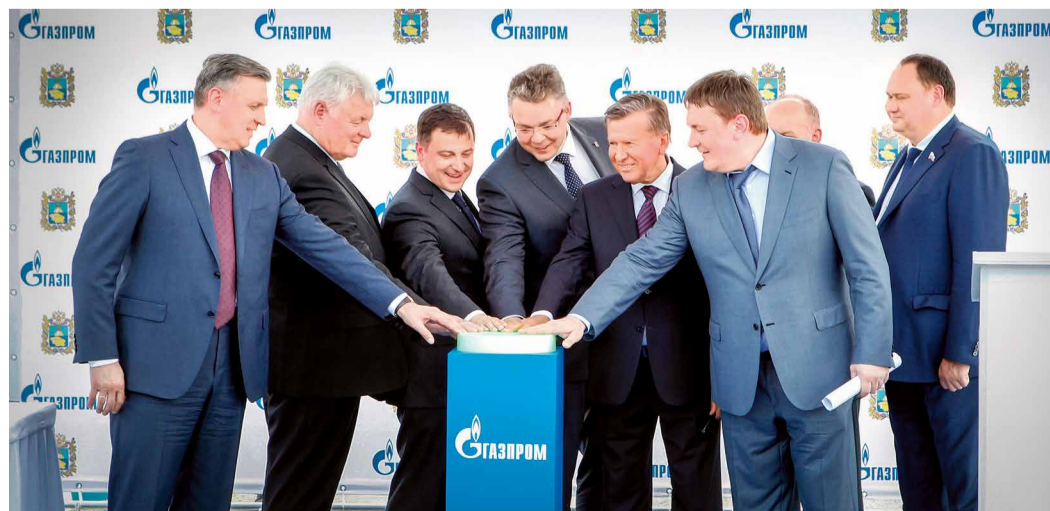
Торжественный пуск автомобильной газонаполнительной компрессорной станции в г. Новоалександровске