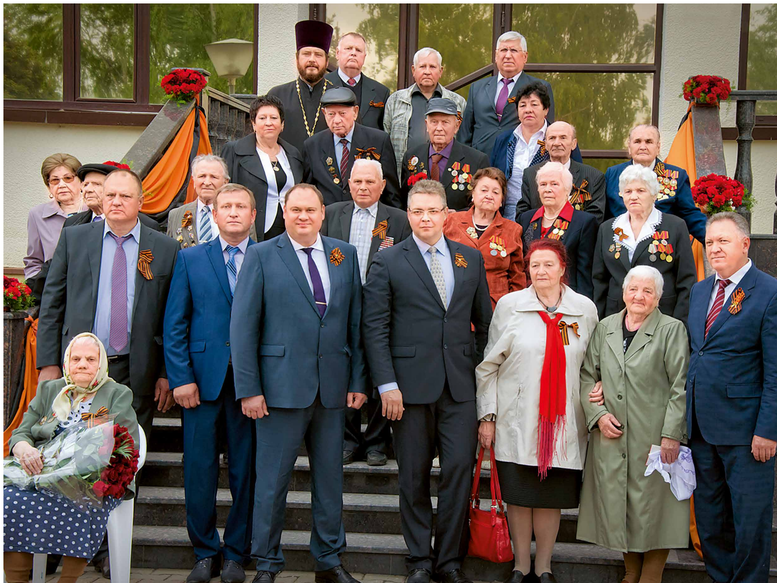
Чествование ветеранов войны и тружеников тыла в поселке Рыздяном