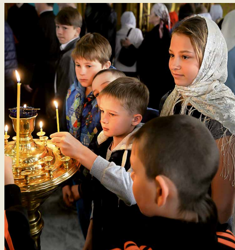
Дети на службе