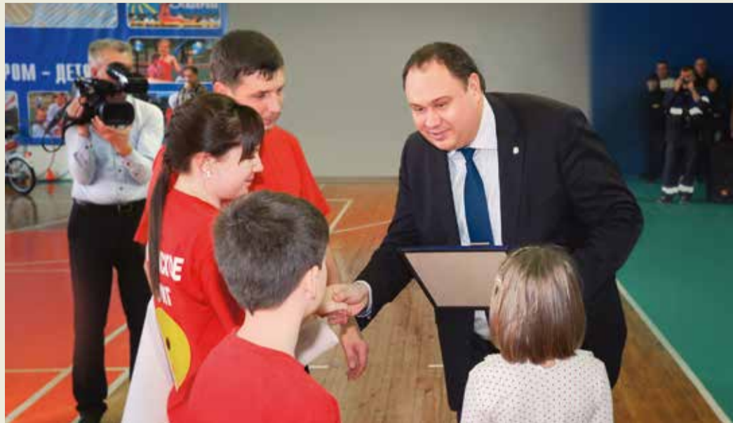
Лучшие спортивные семьи предприятия награждает генеральный директор