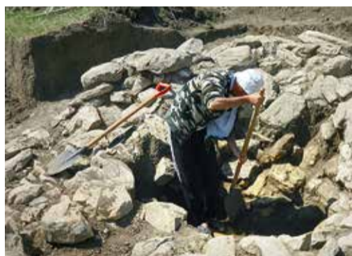
Расчистка объекта исследования

Захоронения этого периода на территории Ставропольского края находили и ранее. К примеру, в 1966 году к северу и западу от станции Суворовской было раскопано 17 курганов. Работы велись в рамках строи-