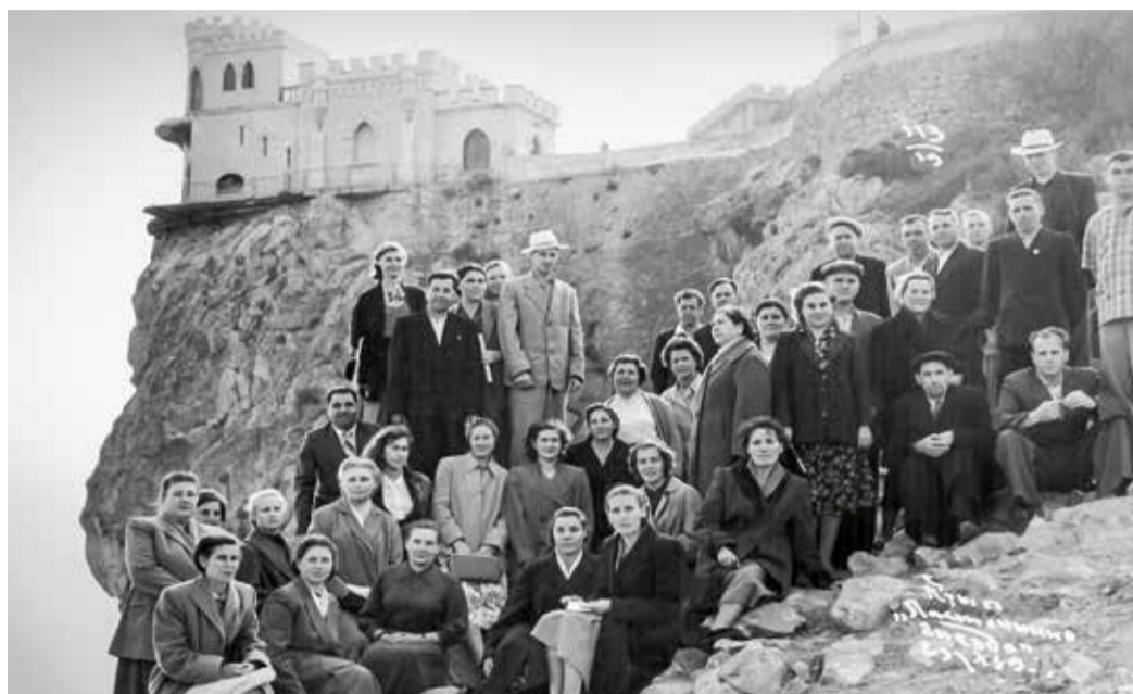
«Ласточкино гнездо», октябрь 1959 г.

Собираясь в Ялту, запланировала исполнить одно из своих сокровенных желаний – посетить замок «Ласточкино гнездо». Дело в том, что год назад, разбирая архив по-