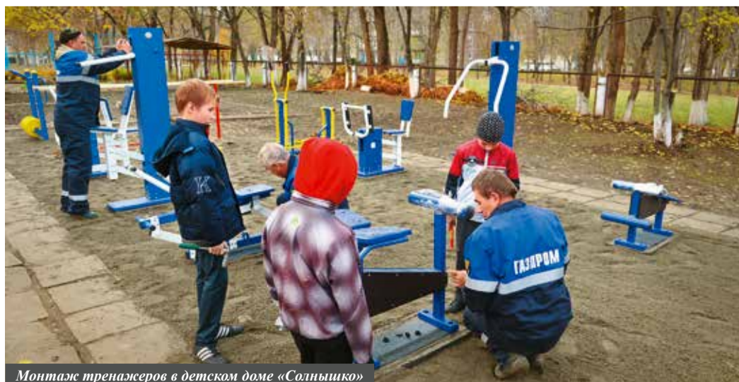
Монтаж тренажеров в детском доме «Солнышко»