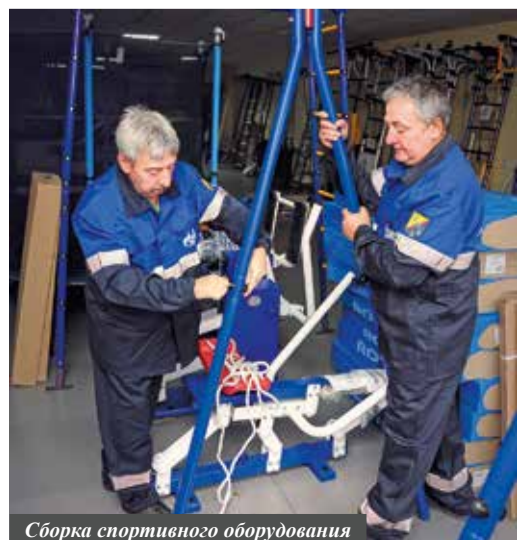
Сборка спортивного оборудования