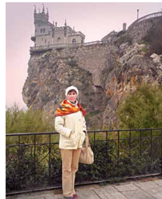
Там же 56 лет спустя

Много необычного удалось увидеть в Ялте и ее окрестностях. Порадовали плантации виноградников – возрождается благодатный