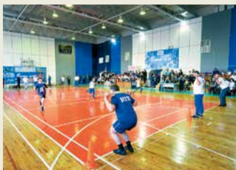
В эстафетах участвовали все члены семьи