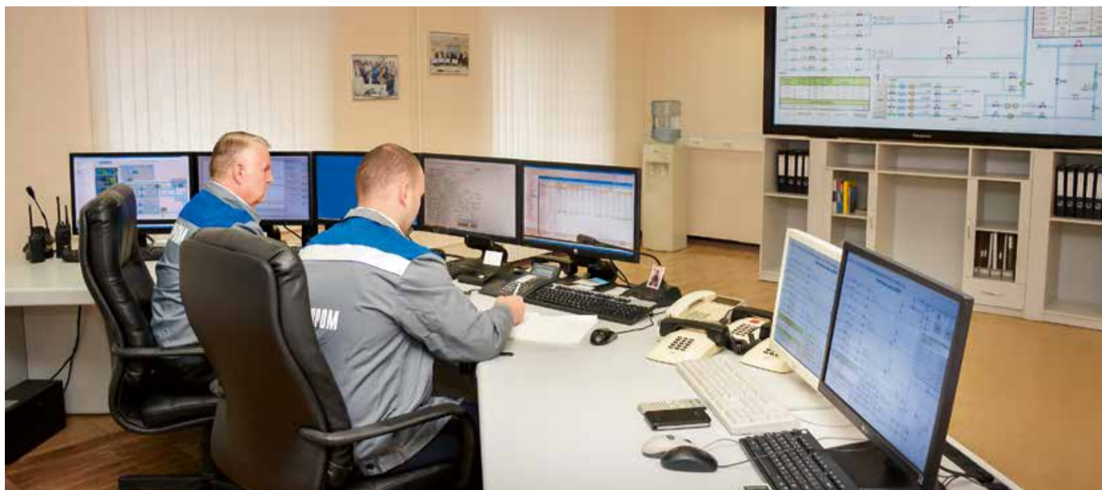
Диспетчерская Изобильненского ЛПУМГ

При работе по проекту «Голубой поток» сотрудники PSI AG установили самые тесные контакты как с проектировщиками, так и с инженеринговыми компаниями России. Главным вкладом в успешную реализацию проекта стало активное привлечение к работам специалистов служб эксплуатации газотранспортных обществ. Взаимодействие не закончилось и после сдачи системы в работу. Специалисты ООО «Газпром трансгаз Ставрополь», хорошо освоившие средства конфигурирования и редактирования PSIGamos, своими силами суще-