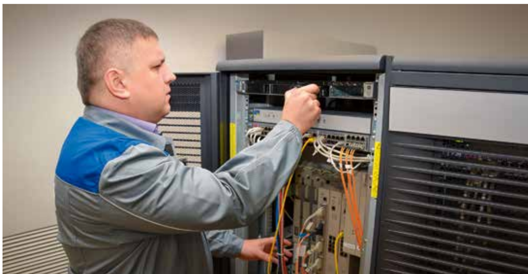
Диагностика оборудования АСУ ТП

Более того, помимо программного обеспечения прорабатываются вопросы использования отечественного оборудования. ООО «ПСИ» успешно проведено тестирование ПО на совместимость с аппаратной платформой «Эльбрус».