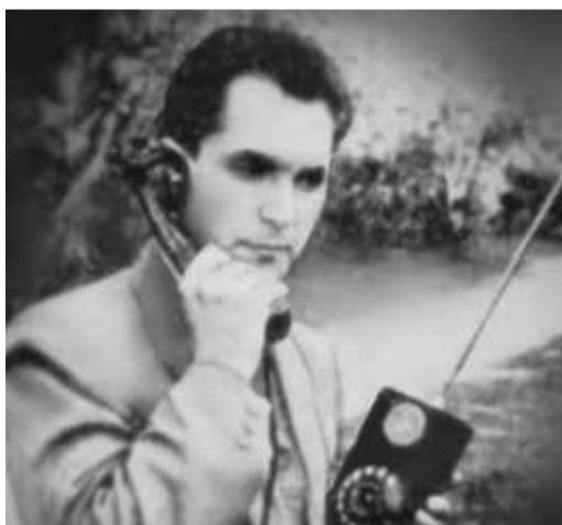
Телефон Л. Куприяновича в действии

Да, как ни странно звучит, но мобильная связь – это вовсе не достижение нашего времени, как многие считают, и вовсе не иностранное изобретение! Еще в 1957 году Леонид создал необычную для того времени вещь – рацию размером со спичечный коробок и весом всего 50 граммов (вместе с источниками питания), которая могла работать без смены питания 50 часов и обеспечивала связь на дальности до двух километров. О своем изобретении ученый поведал миру в книге «Карманные радиостанции». Во втором издании этой книги в 1960 году описывался прототип современных умных часов Smart Watch – простая радиостанция всего на трех транзисторах, которую можно носить на руке. Ее почти воспроизвели как рацию-часы в фильме «Мертвый сезон».