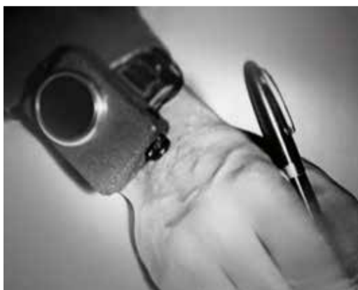
Рация-часы Л.И. Куприяновича

Куприянович предлагал рацию-часы для использования туристам и грибникам, но в жизни к этой конструкции интерес проявили в основном студенты – для подсказок на экзаменах, что даже вошло в эпизод знаменитой кинокомедии Леонида Гайдая «Операция Ы».