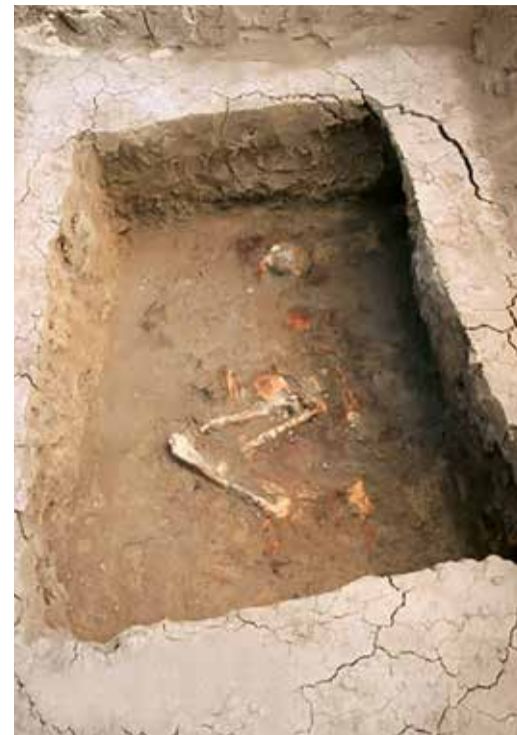
Курганный могильник «Родионов-1»

Происхождение всей катакомбной общности остается загадочным. Большинство исследователей считает, что она не связана с изначально степными культурами Восточной