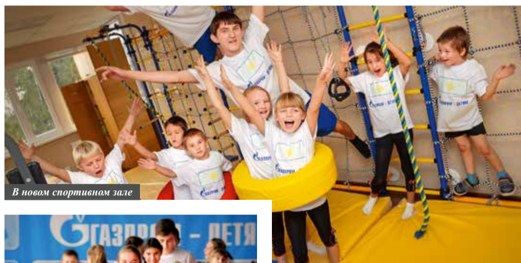
В новом спортивном зале