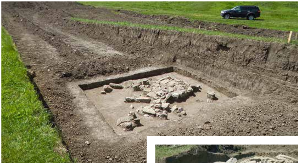
Подкурганное захоронение в районе Новотроицкого водохранилища

Племена ямной и катакомбной культур вели полукочевой образ жизни: занимались скотоводством, строили временные жилища, в основном передвигались вдоль водных ар-