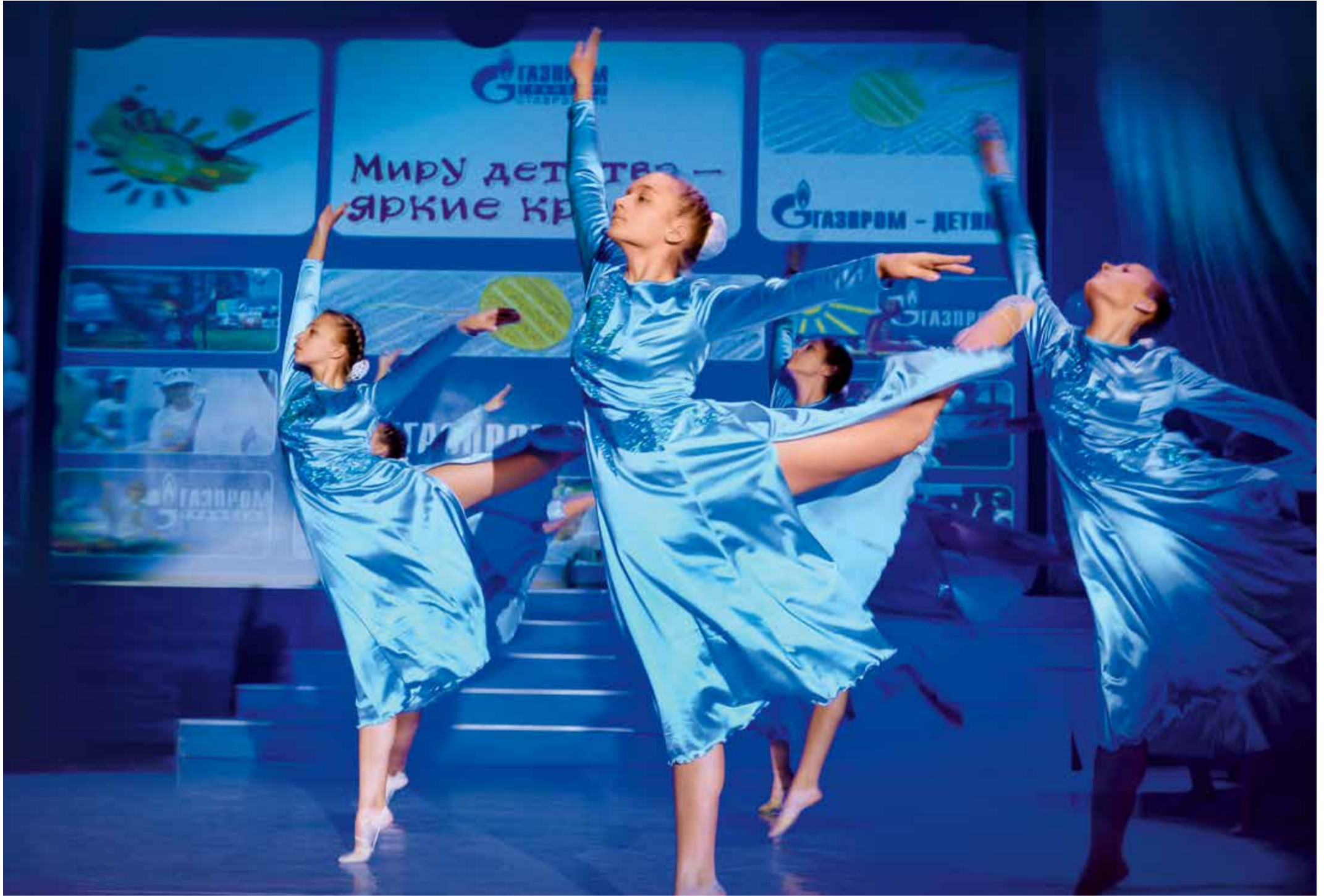
«Финальный аккорд» двухнедельной акции «Миру детства – яркие краски!». Подробности читайте на 3-й полосе