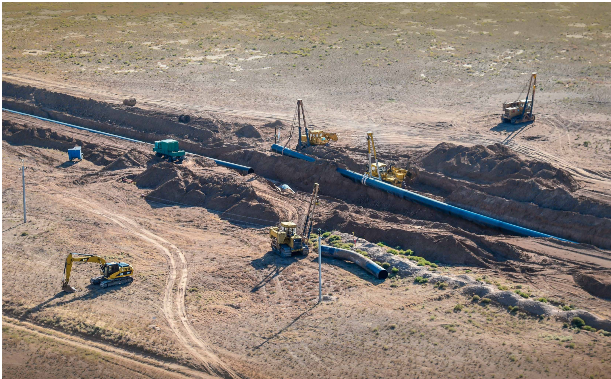
Подключение отремонтированного участка магистрального газопровода Магат – Северный Кавказ