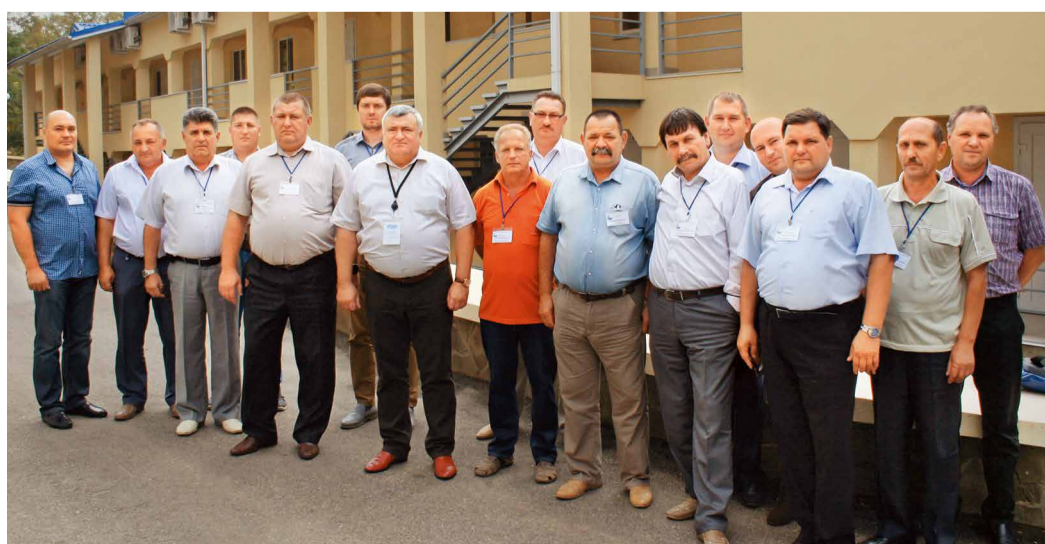
Участники совещания инженеров по гражданской обороне и чрезвычайным ситуациям