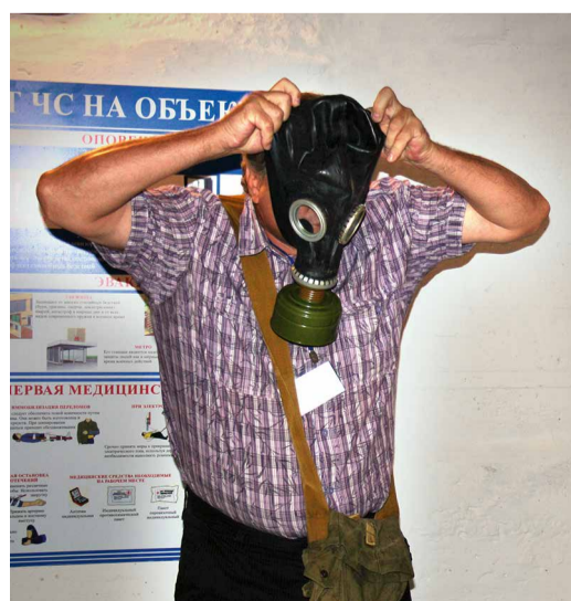
Отработка практических навыков