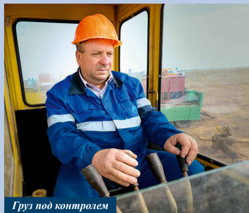
Груз под контролем

Одновременно на четырех участках магистрального газопровода Магат – Северный Кавказ в зоне ответственности ООО «Газпром трансгаз Ставрополь» прошли ремонтные работы. В них были задействованы сводные бригады общей численностью около двухсот человек из Зензелинского, Астраханского, Невинномысского, Ставропольского, Привольненского, Камыш-Бурунского, Изобильненского ЛПУМГ, АВР-4 УАВР, УТТиСТ. В результате был полностью заменен участок магистрального газопровода длиной почти в восемь километров, врезаны новые крановые узлы на 490, 671 км и кран № 729 на ГИС «Артезиан». Выполнение этих работ значительно повысило надежность газотранспортной системы ПАО «Газпром».