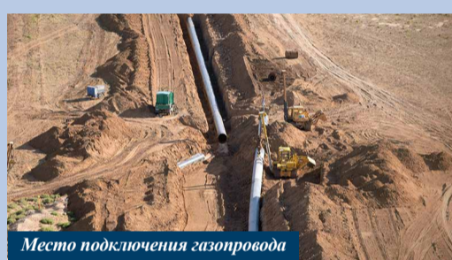
Место подключения газопровода