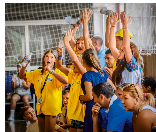
Поддержка болельщиков – важный психологический фактор