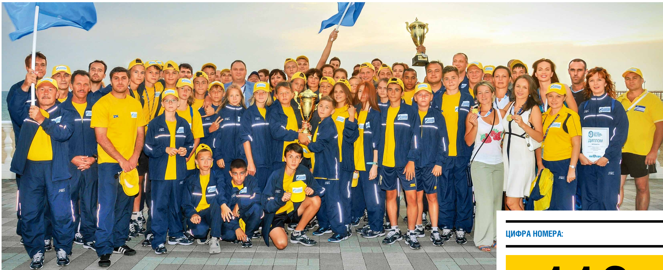
Команда ООО «Газпром трансгаз Ставрополь» на XI летней Спартакиаде ПАО «Газпром»