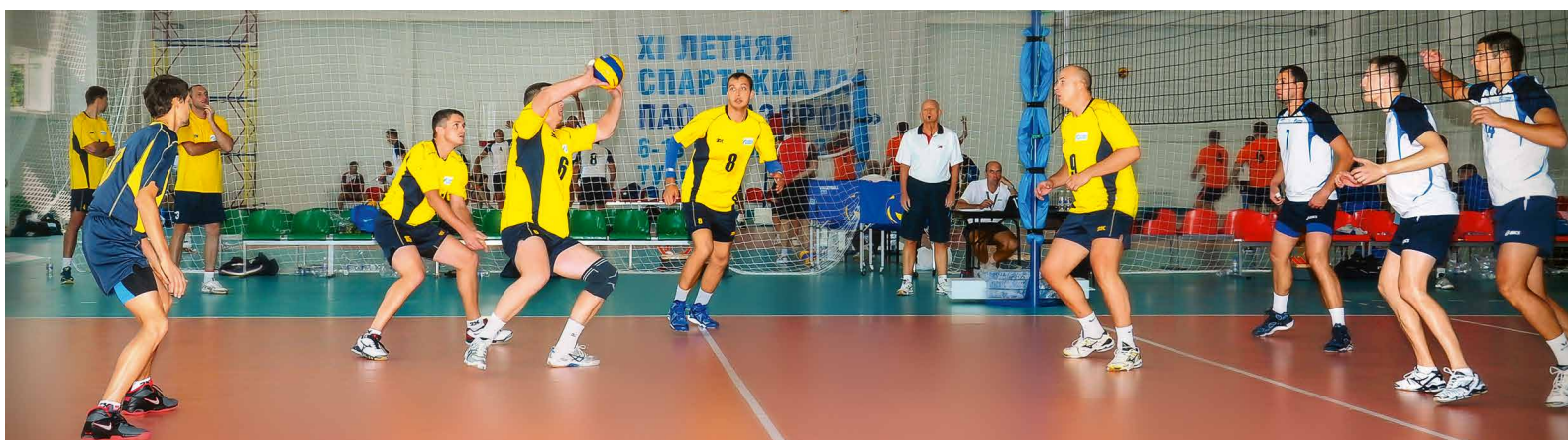
Волейбольный матч с участием спортсменов из ООО «Газпром трансгаз Ставрополь»