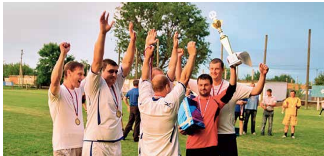
Победители корпоративных соревнований