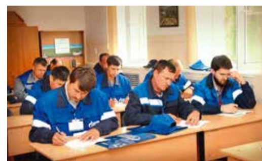
Проверка теоретических знаний