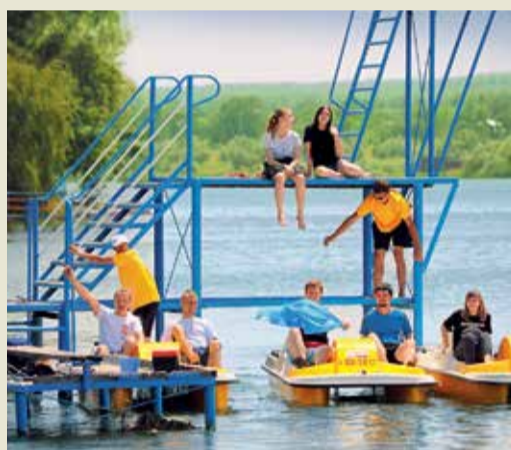
Отдыхающие готовы к «летним приключениям»