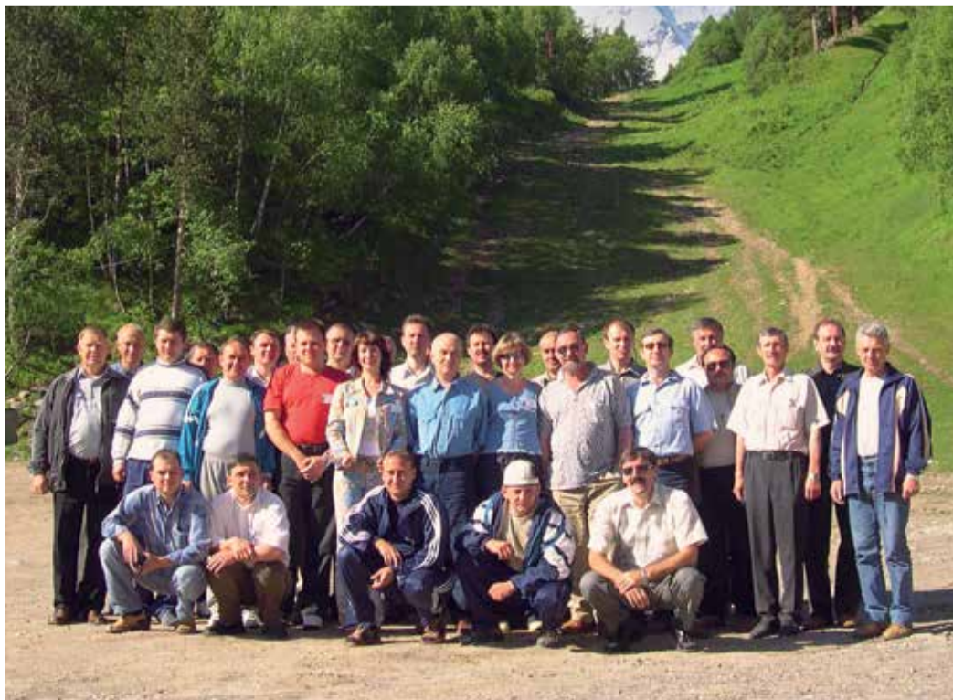
Ежегодное совещание энергетиков ООО «Газпром трансгаз Ставрополь», 2003 год