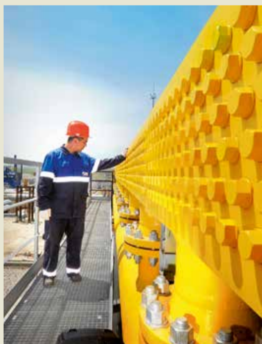
Аппарат воздушного охлаждения газа