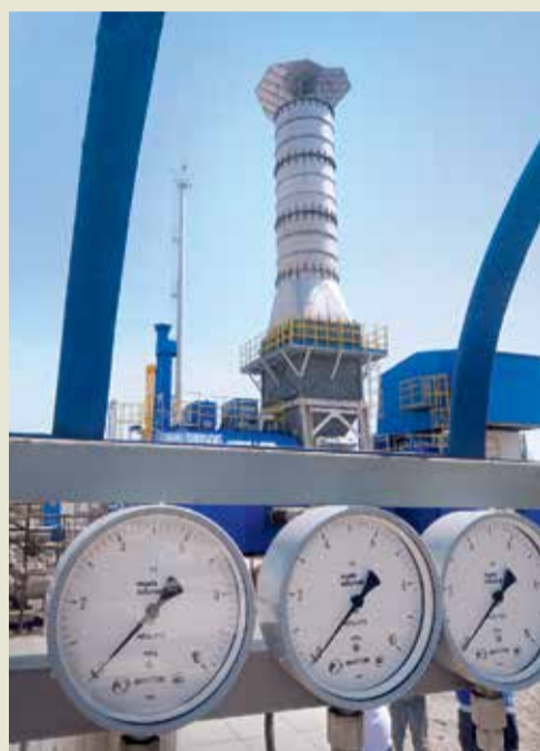
Измерительные приборы готовы к эксплуатации