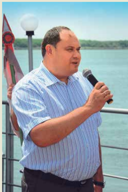
Добрые пожелания от генерального директора