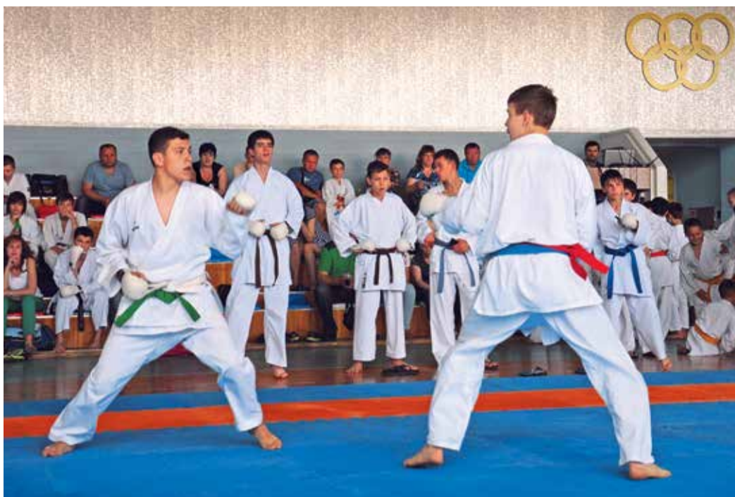
В турнире приняли участие более ста каратистов юга России