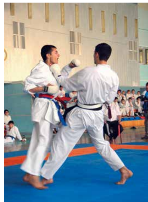
Бой за первое место