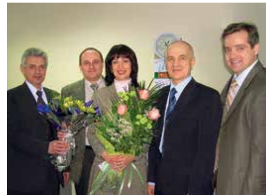
День энергетика, 22 декабря 2006 года

— Появилось еще больше ответственности за конечный результат — бесперебойную, безопасную и экономичную работу всего энергетического оборудования предприя-