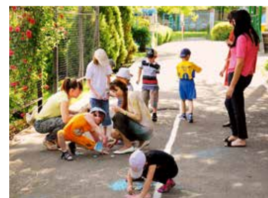
Конкурс рисунков на асфальте