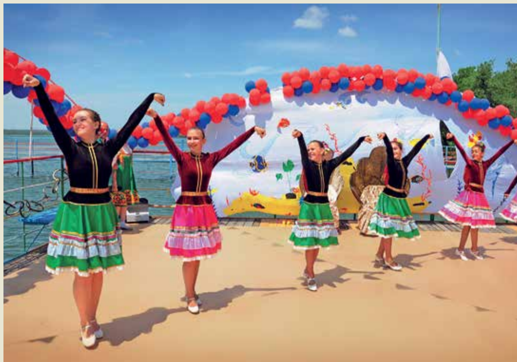
Зажигательный танцевальный номер