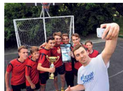
Селфи с юными футболистами