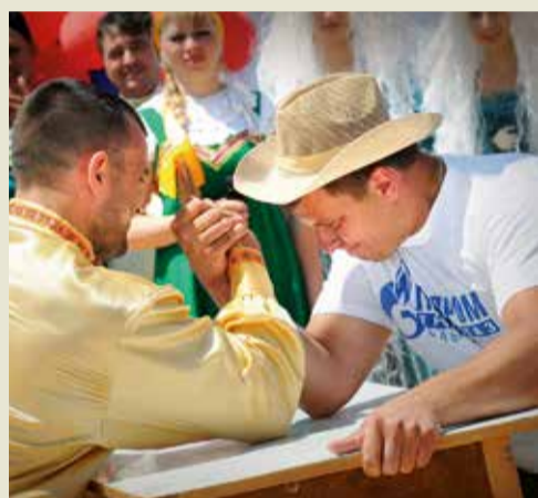
Соревнования по армрестлингу