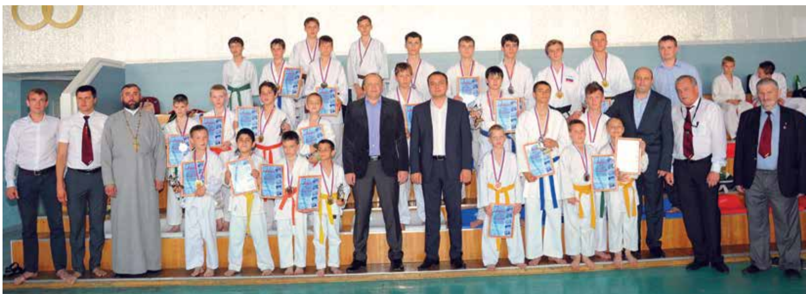
Победители и призеры открытого краевого турнира по сетокан карате-до на призы ООО «Газпром трансгаз Ставрополь»