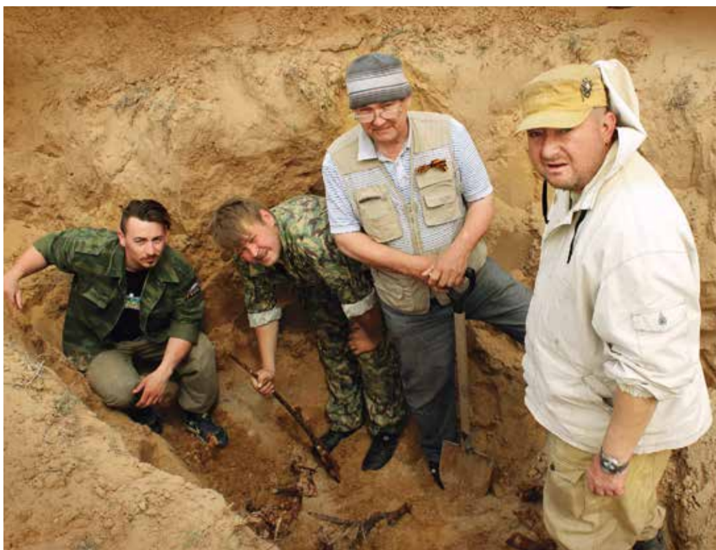
Археологические раскопки – кропотливая и непростая работа

В ходе тяжелых оборонительных боев, благодаря мужеству и стойкости воинов 28-й армии, гитлеровские войска были остановлены в 120 км от Астрахани в районе поселка Хулхута, который был взят советскими войсками 21 ноября. В ночь с 31 декабря 1942 года на 1 января 1943-го была освобождена Элиста, а к 21 января – территория всей Калмыкии. Наступление советских воинов успешно развивалось на всех участках фронта. 28-я ар-