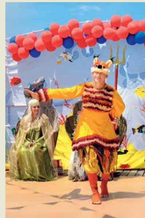
Газовиков встречали сказочные герои