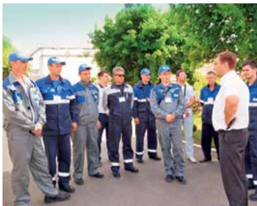
Экскурсия по объектам ДКС-1

Конкурсантам было предложено сделать контрольку пяти резьбовых соединений на агрегате АУ-10 системы регулирования авиационного двигателя. Проще говоря, закрепить проволокой резьбовые соединения. Поскольку все это делалось в условиях, далеких от реальных, конкурсанта ограничили