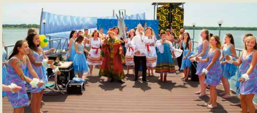
Открытие купального сезона на базе отдыха «Голубые огни»