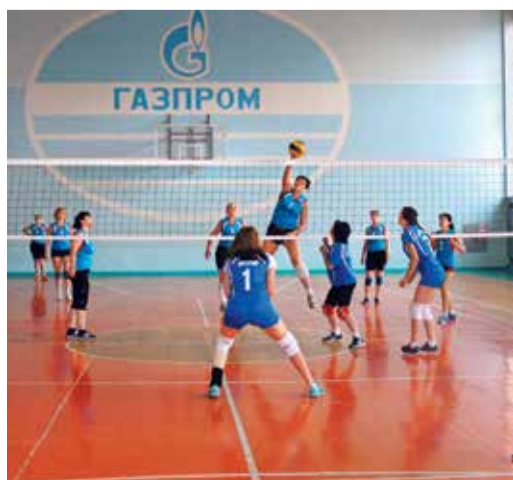
Матч за «бронзу» в женском зачете