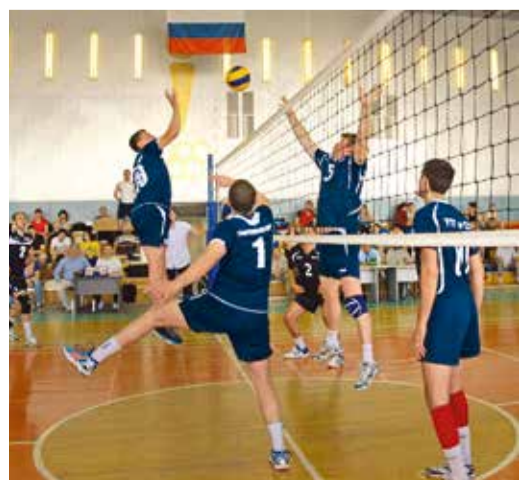
Финальный поединок среди мужских команд