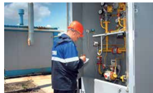
Поиск на ГРС нарушений охраны труда

«Считаю, что у меня ответственная и нужная работа. Когда прихожу зимой после смены домой, несмотря на непогоду за окном, мне тепло и уютно. Я знаю, что в этом есть частичка моего труда. И горжусь этим».