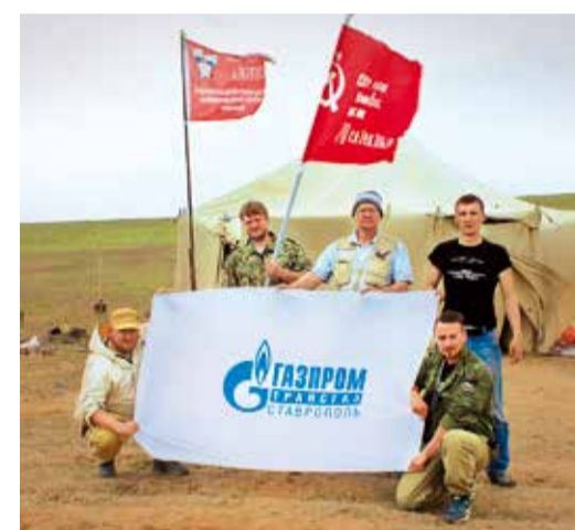
Поисковый отряд «Южный форпост»