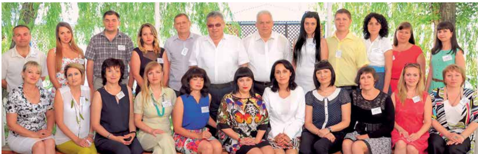
Участники семинара-совещания службы по связям с общественностью и СМИ ООО «Газпром трансгаз Ставрополь»

На базе отдыха «Голубые огни» состоялся семинар-совещание службы по связям с общественностью и СМИ и представителей филиалов ООО «Газпром трансгаз Ставрополь», ответственных за информационную работу.