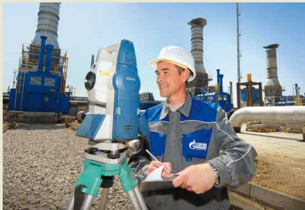
Определение высотных отметок трубопроводов