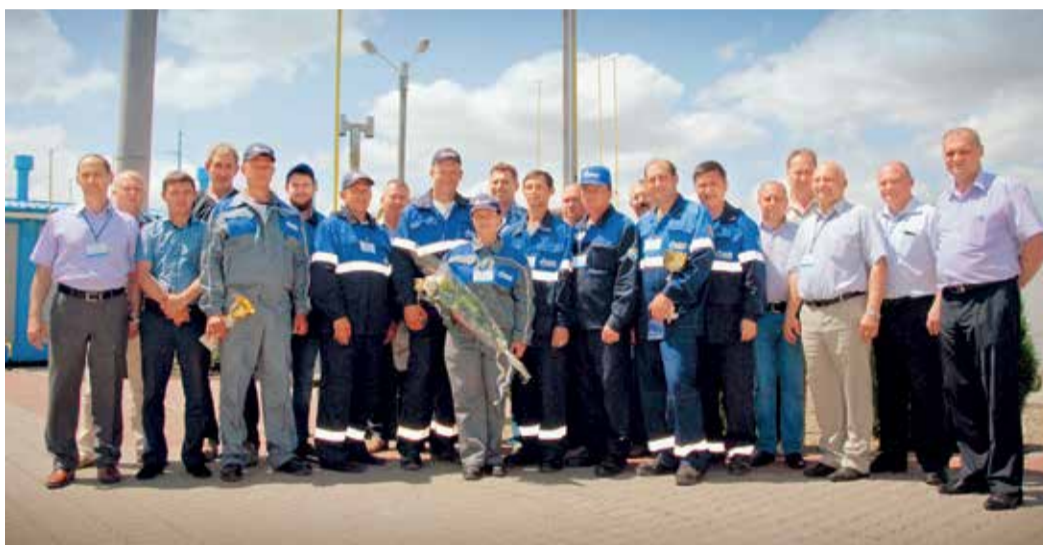
Общая фотография участников конкурса на память

готовки конкурсантов, но и расширить кругозор операторов ГРС, которые еще не работали с таким оборудованием. К слову, чтобы избежать ситуации «кота в мешке», всем участникам конкурса была предоставлена возможность заранее приехать на место испытаний и ознакомиться с техническим оснащением станции.