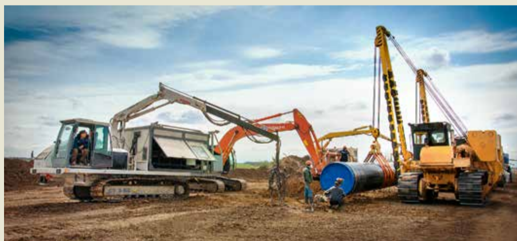
Подготовка к наращиванию плети