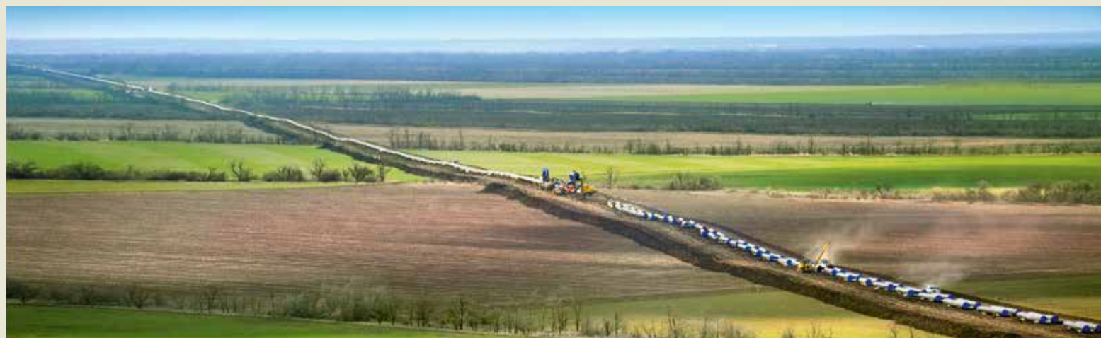
Трасса нового газопровода

В зоне ответственности Привольненского ЛПУ МГ – на границе Песчанокопского и Сальского районов Ростовской области – начаты масштабные работы по строительству участка МГ Починки – Анапа и «ГИС «Сальская» Южно-Европейского газопровода», входящих в состав проекта «Расширение ЕСГ для обеспечения подачи газа в газопровод «Южный поток». Работы ведут подрядные организации, в них заняты более 80 ИТР и рабочих, задействовано 25 единиц техники. Полным ходом идет подготовка трассы, на которую произведен вывоз трубы. Сварено в единую нитку более шести километров линейной части газопровода. Для обеспечения строительного контроля над качеством выполняемых работ в Привольненском ЛПУ МГ создана рабочая группа. Также контроль на месте осуществляют специалисты филиала Кавказского управления ООО «Газпром газнадзор».