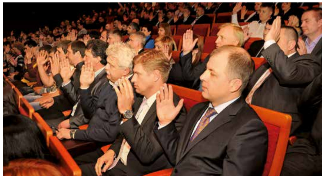
Голосование по вопросам повестки дня