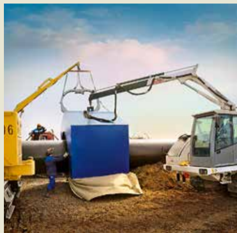
Установка укрытия сварочного поста