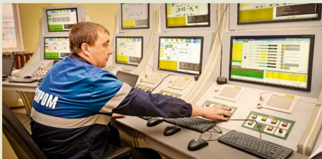
В новой операторной КС