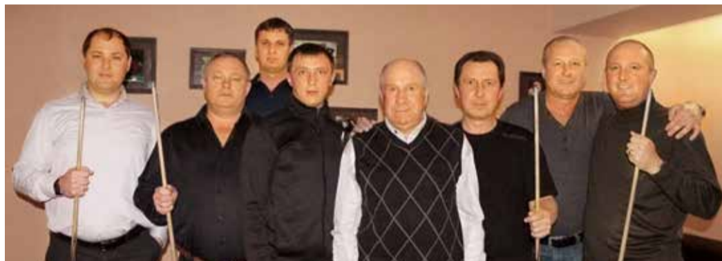
Участники турнира в Георгиевском ЛПУ МГ