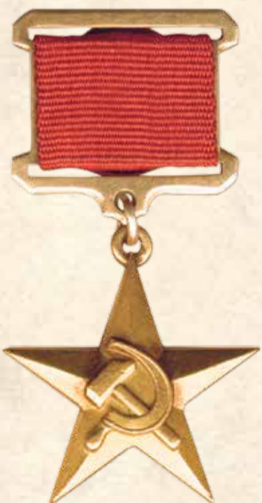
Золотая звезда Героя Социалистического Труда СССР