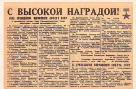
Статья с указом о награждении, 1966 год

Социалистического Труда с вручением ордена Ленина и золотой медали «Серп и Молот». Эти высокие награды на груди ветерана расположились рядом с орденом Отечественной войны II степени, медалью «За оборону Кавказа» и различными юбилейными наградами.