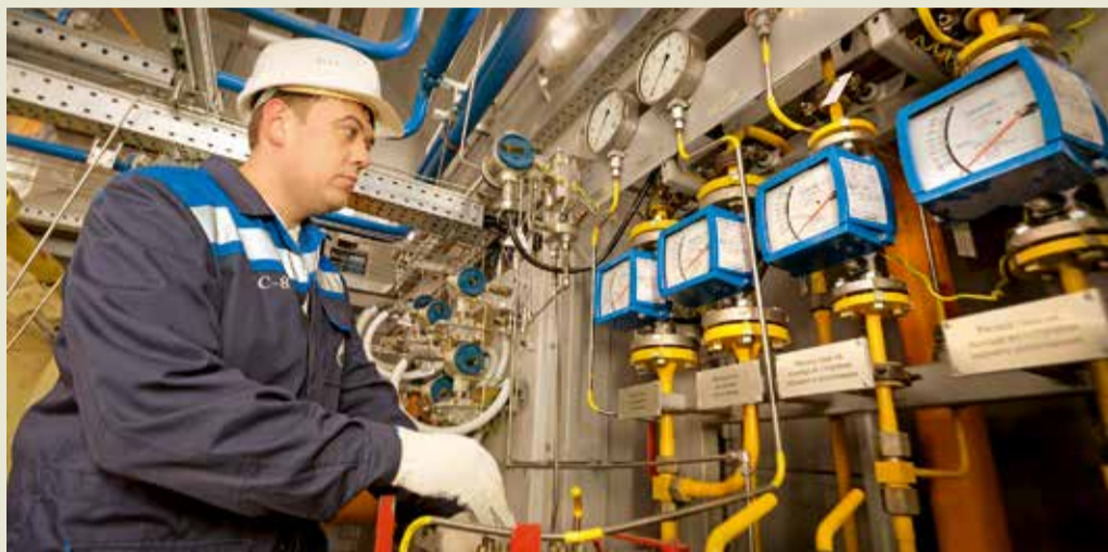
Наладка блока установки подготовки топливного и импульсного газа

В Георгиевском ЛПУ МГ продолжается реконструкция компрессорной станции «Георгиевск» (КС-8) системы газопроводов Северный Кавказ – Центр. В настоящее время на объекте трудятся около 200 человек из нескольких подрядных организаций. В ходе пусконаладочных работ успешные 72-часовые испытания прошли два газоперекачивающих агрегата. Ранее были введены в эксплуатацию четыре пылеуловителя и пять аппаратов воздушного охлаждения газа. Кроме того, заканчиваются пусконаладочные работы на блоке установки подготовки топливного и импульсного газа, дожимной компрессорной установке и реверсном узле. Работники газоконпрессорной службы Георгиевского ЛПУ МГ активно осваивают новое оборудование и принимают участие в пусконаладочных работах. После реконструкции увеличенный объем транспортируемого газа будет поступать в регионы Северного Кавказа. Проектная производительность компрессорной станции увеличится в 1,6 раза.