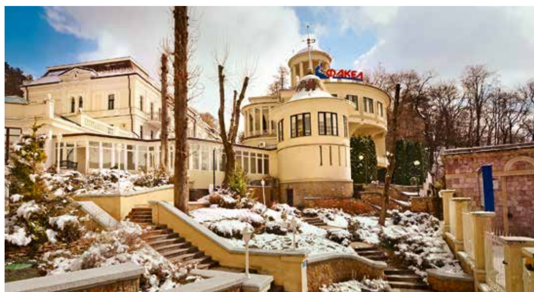
Пансионат санаторного типа «Факел» зимой