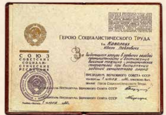
Страница наградной книжки