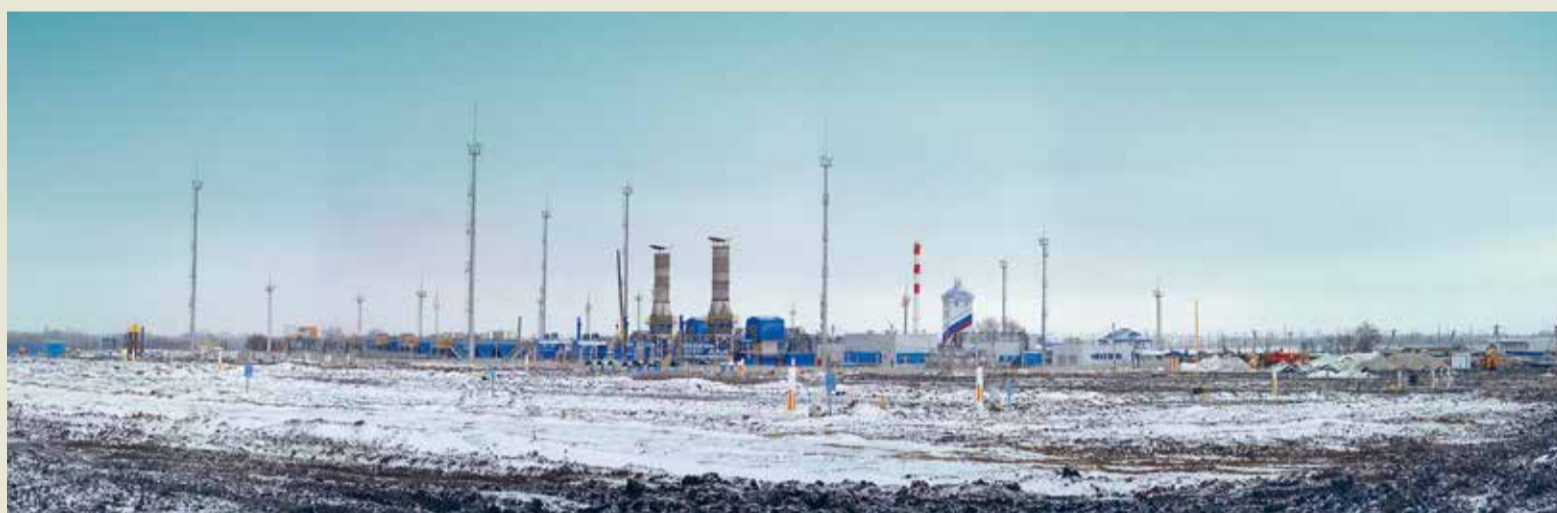
Новый цех КС-8 «Георгиевск»