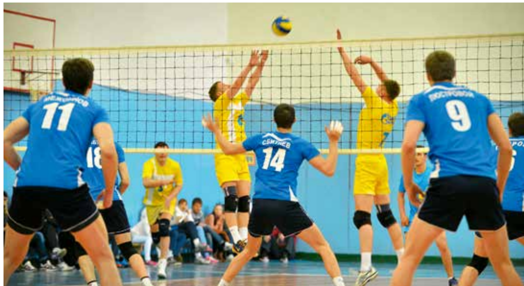
Домашний матч волейбольного клуба «Газпром Ставрополь»