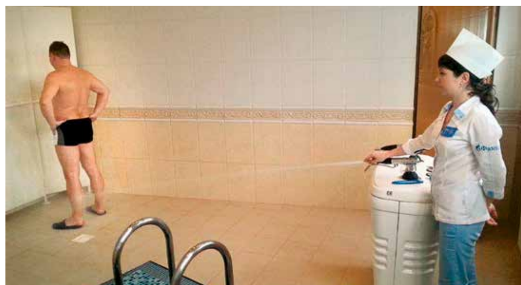
Душ Шарко в действии