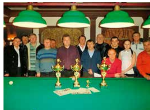
Лучшие бильярдисты УТТиСТ