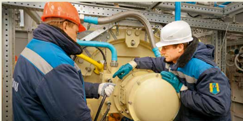
Осмотр центробежного нагнетателя