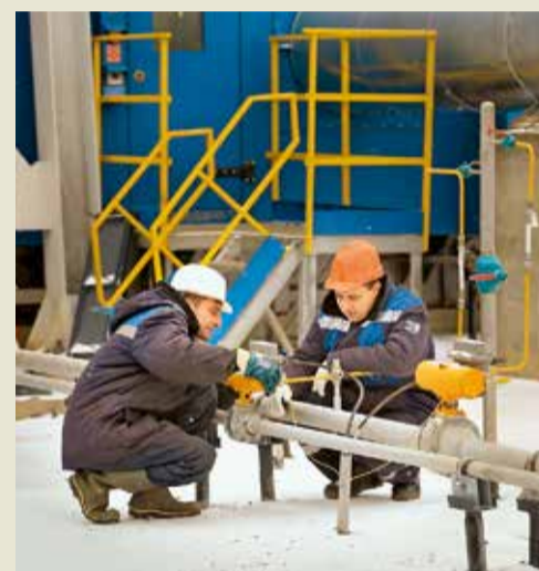
Подготовка ГПА к пуску