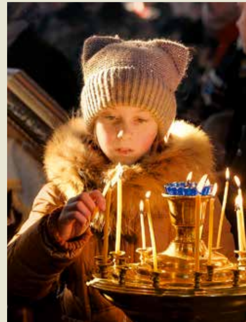
От свечей зажигаются надежды