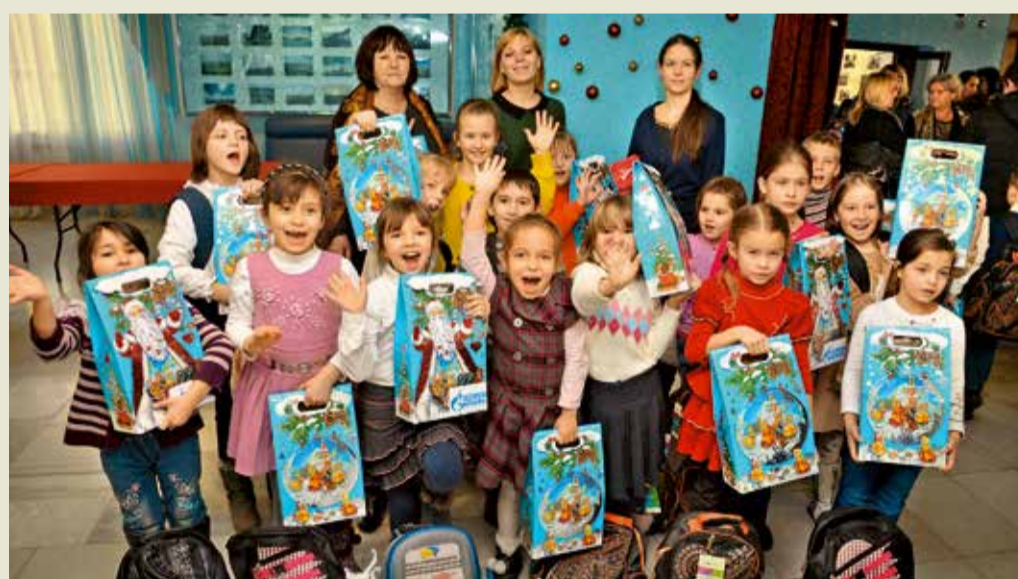
Рождественские подарки от газовиков