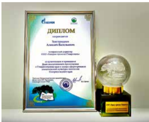
Диплом за проведение Дней экопросвещения в СК