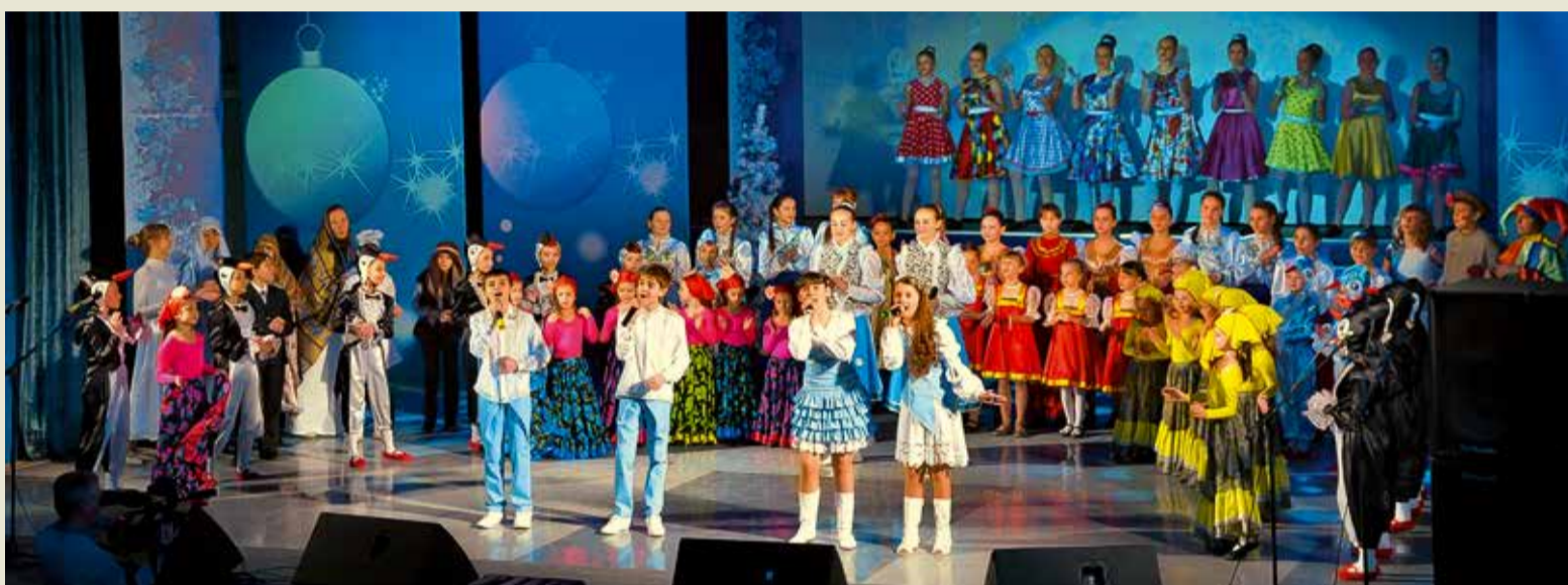
Финал праздничного концерта