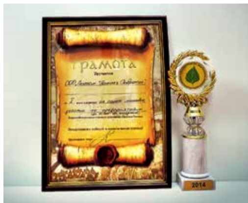
Награды конкурса экосубботника «Зеленая Россия»