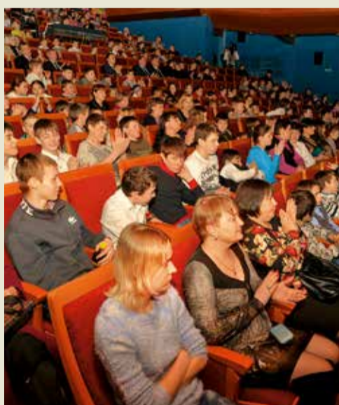
Зрительный зал был практически полон