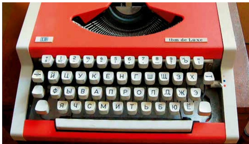
Самая популярная в СССР дорожная пишущая машинка «Unis»