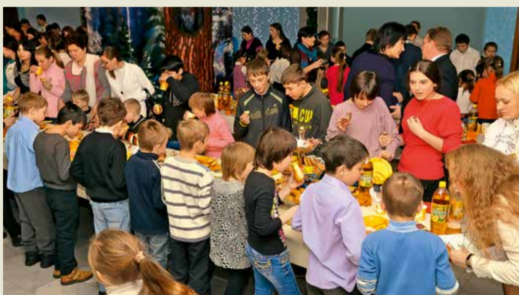
Сладкий стол для детворы