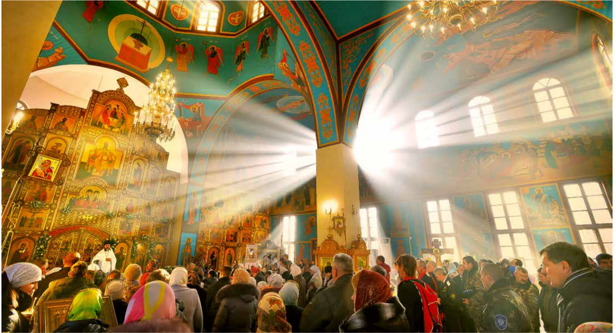
Торжественное богослужение в храме Рождества Христова