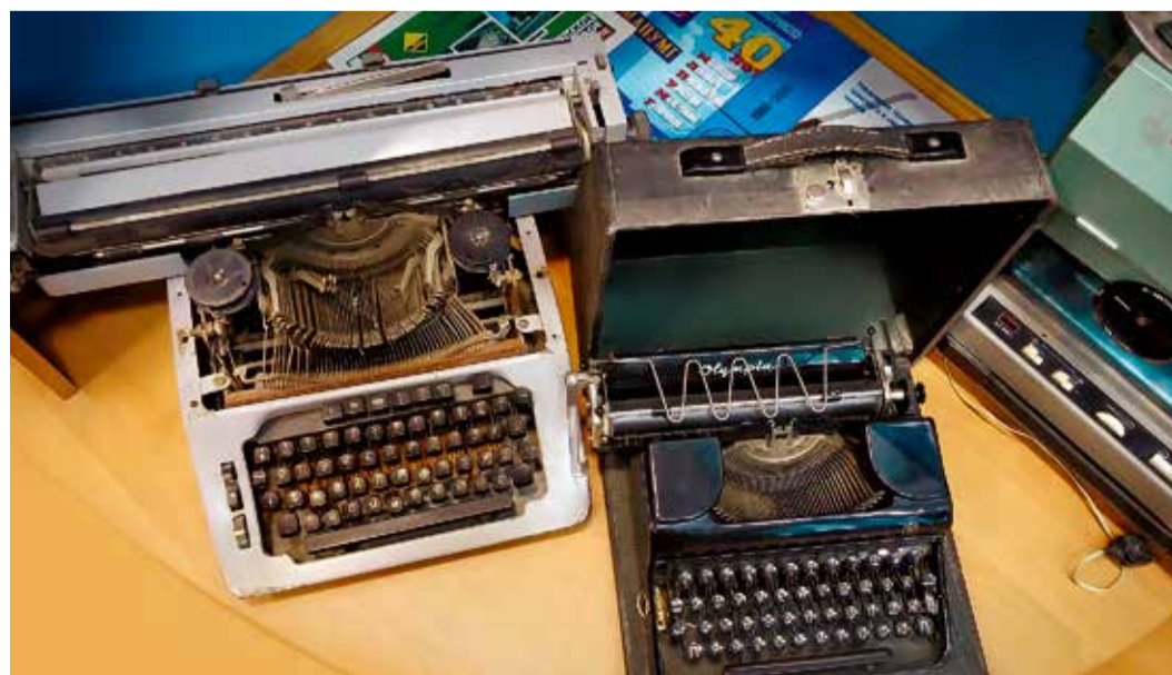
Машинки «Башкирия» и «Olimpia» из Музея истории Невинномысского ЛПУ МГ