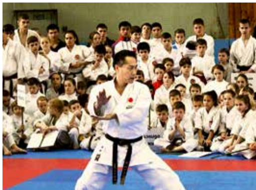
Обладатель 8-го дана Японской ассоциации карате сихан Хидэо Очи

Одиннадцать медалей завоевали бойцы ООО «Газпром трансгаз Ставрополь» на VII Кубке России и Всероссийских соревнованиях по сетокан карате-до, проходивших во Дворце спорта Московского государственного строительного университета.