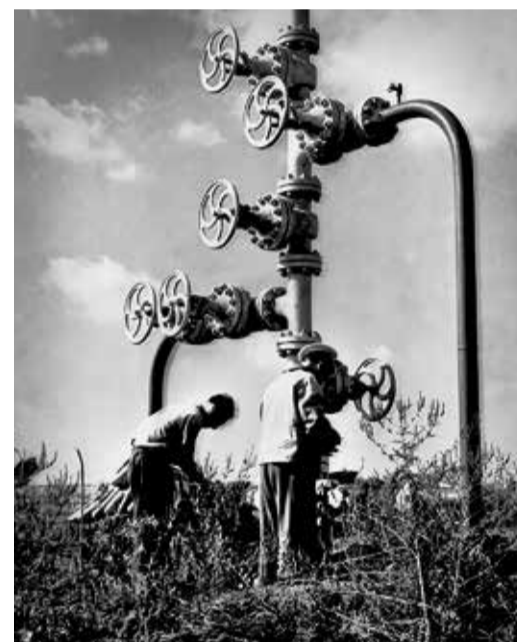
У скважины Северо-Ставропольского газового месторождения, 1950-е годы

нившая топливно-энергетический баланс нашей страны, получила дальнейшее развитие и в других регионах европейской части СССР и Средней Азии. К 1975 году добыча природного газа в СССР увеличилась до 289 млрд куб. м.