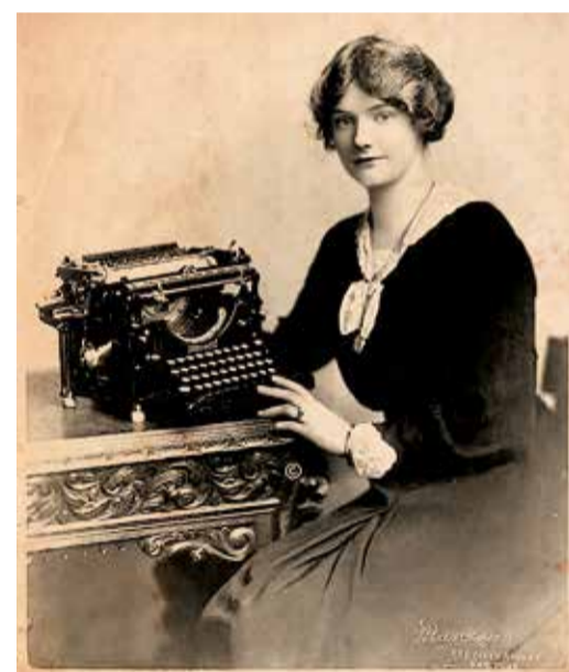
Реклама пишущих машинок начала XX века

Последней произведенной в мире печатной машинкой считается экземпляр, выпущенный в ноябре 2012 года фирмой «Brother» и пода-