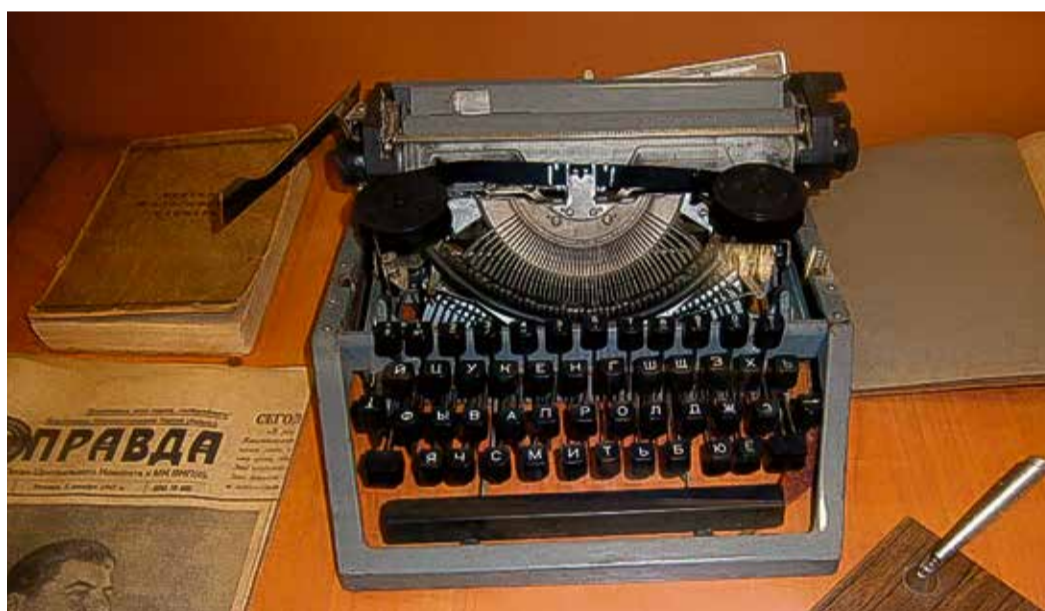
Компактная пишущая машинка «Ортех»

в Комнату трудовой славы предприятия и после – в музей, открытый к 50-летию юбилею Невинномысского ЛПУ МГ.