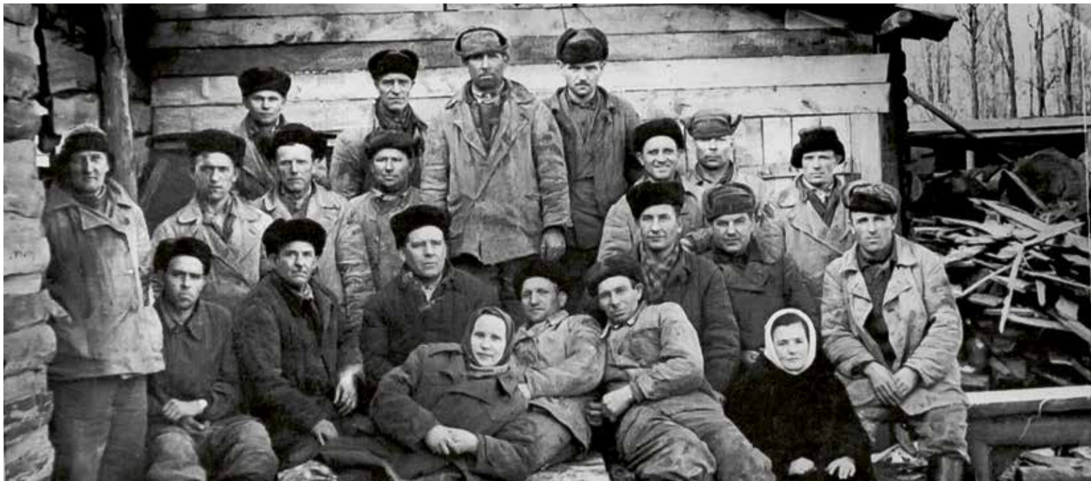
Бригада буровиков, 1950-е годы

Общие первоначальные запасы газа, по подсчетам ученых, составили 220 млрд куб. м. Открытие такого богатого месторождения стало подлинной сенсацией. Первым послевоенным пятилетним планом СССР на 1945 – 1950 годы было рассчитано довести производство газа из угля и сланцев до 1,9 млрд куб. м и природного газа – до 8,4 млрд куб. м, а тут сразу 220 млрд