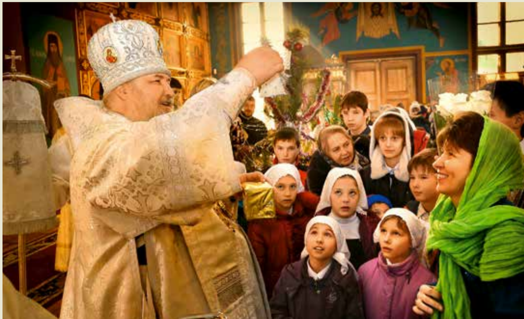
После службы митрополит Ставропольский и Невинномысский Кирилл общается с воспитанниками воскресной школы