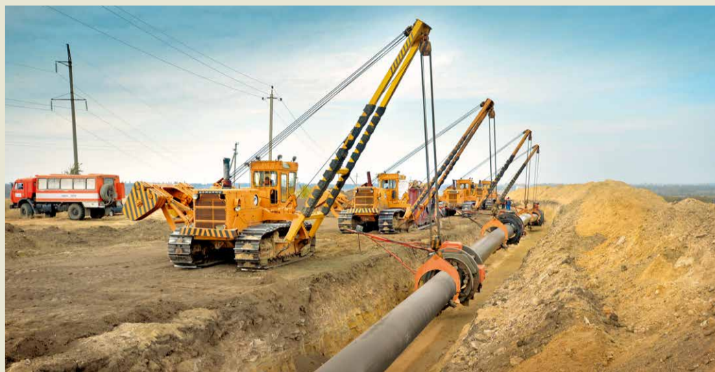
Участок капитального ремонта газопровода