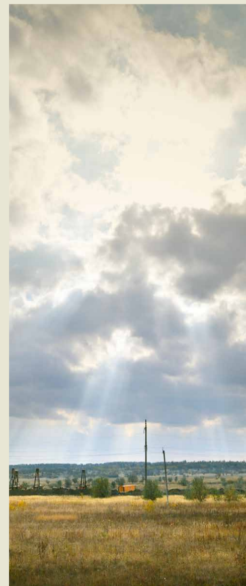
Место проведения работ