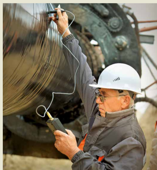
Контроль качества изоляционных работ