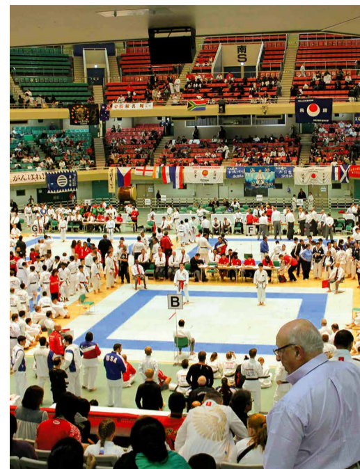
Дворец боевых искусств «Будокаан»

Следующий Кубок Сето будет проведен через три года в Европе. Где – пока еще неизвестно. Зато понятно, что спортсмены, представляющие нашу большую страну, через «золото»