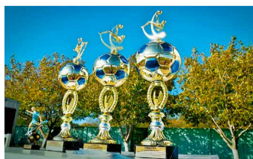
Награды победителей турнира в УТТиСТ