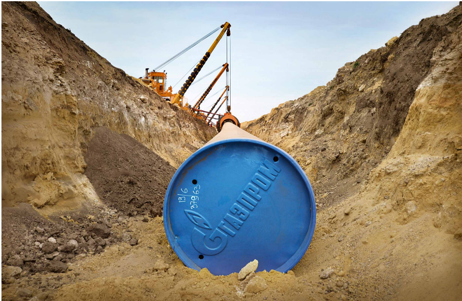
Капитальный ремонт магистрального газопровода Рождественская – Изобильный