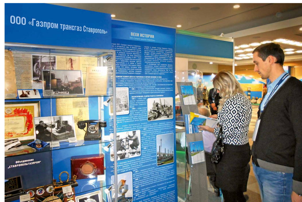
Участники нефтегазового форума у экспозиции ООО «Газпром трансгаз Ставрополь»