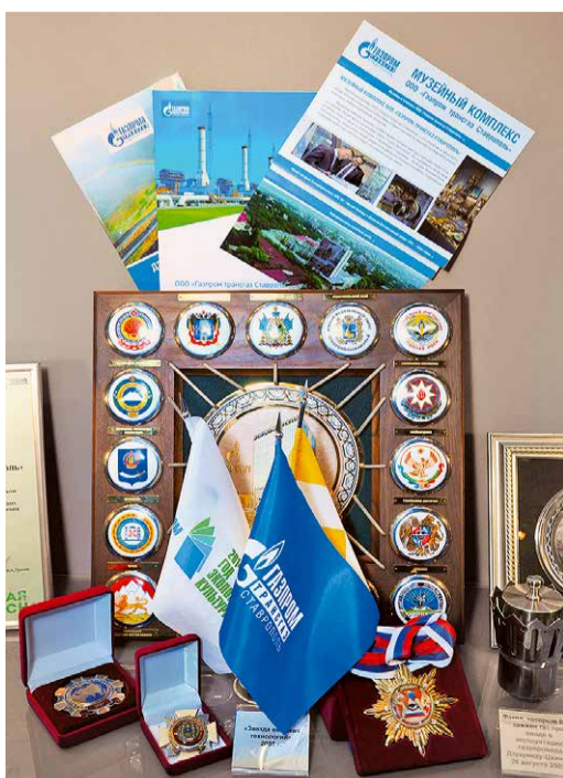
Фрагмент экспозиции Общества