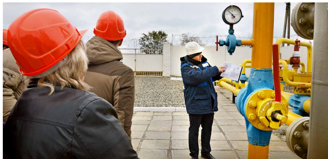
Экскурсия на ГРС Светлоград-2