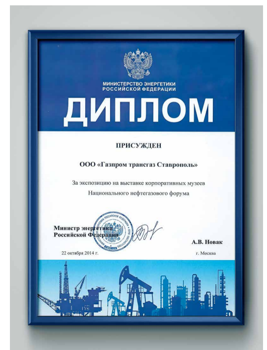
Диплом участника выставки корпоративных музеев