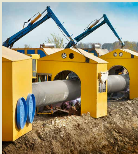
Работа сварочного комплекса

В Изобильненском линейном производственном управлении магистральных газопроводов продолжается капитальный ремонт магистрального газопровода Рождественская – Изобильный, построенного в 1970 году. На момент подписания номера в печать была выполнена переизоляция 2,5 км, полностью заменено 2,9 км трубы. Всего на капремонте трудится более 200 человек, задействовано свыше 20 единиц специальной и вспомогательной техники. Соблюдение выполнения необходимых технологических параметров на объекте постоянно курируют специалисты администрации Общества и УОРРиСОФ.