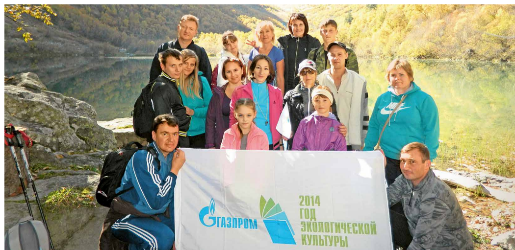
Работники ИТЦ на Будукских озерах