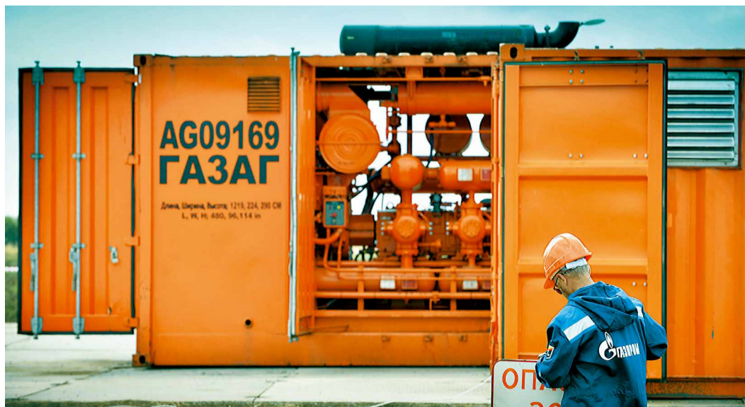
Мобильная компрессорная станция