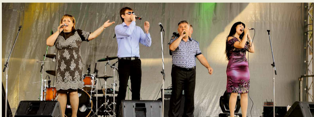
Выступление солистов Дворца культуры и спорта Общества на праздничном концерте на Цхинвальском стадионе