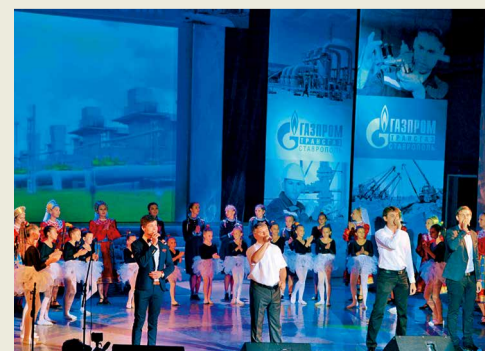
Яркое финальное выступление наших артистов