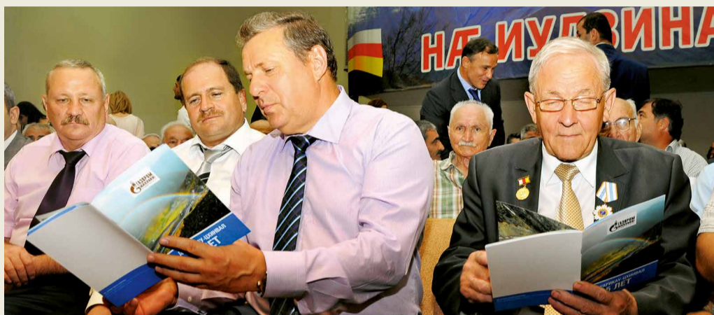
Строители МГ Дзуарикау – Цхинвал читают праздничный буклет о газопроводе