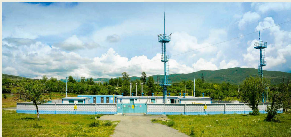
ГРС города Цхинвала