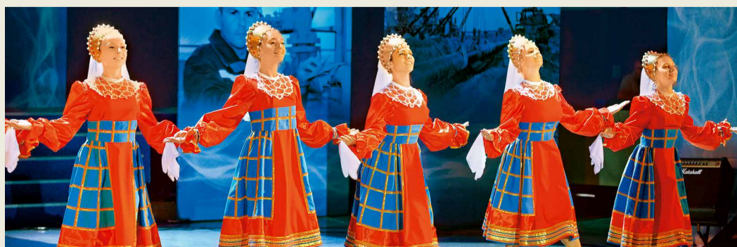
На сцене – творческие коллективы Общества