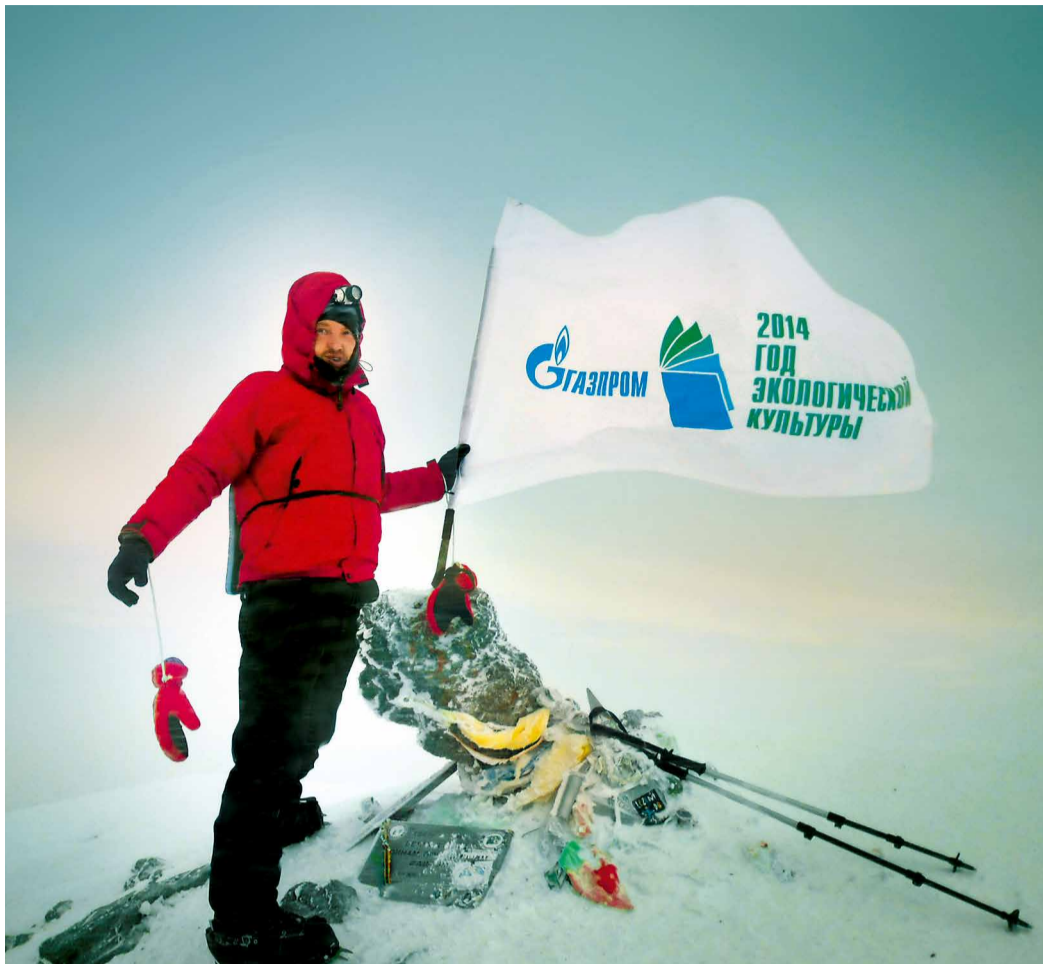
На вершине Эльбруса Игорь Ларионов