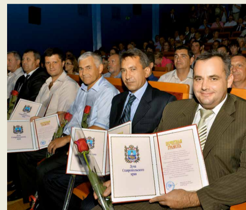
Лучшие работники предприятия