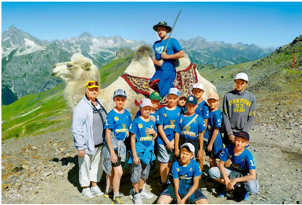
Баскетболисты Общества на тренировочных сборах в п. Домбае