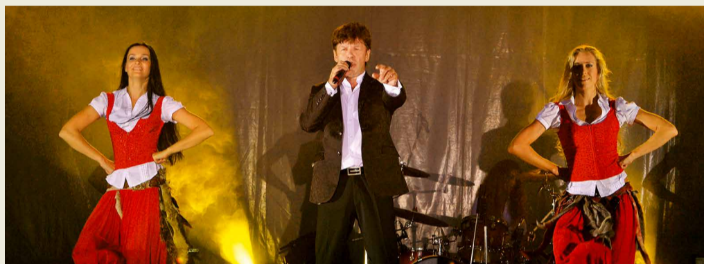
Поет популярный эстрадный артист Феликс Царикати