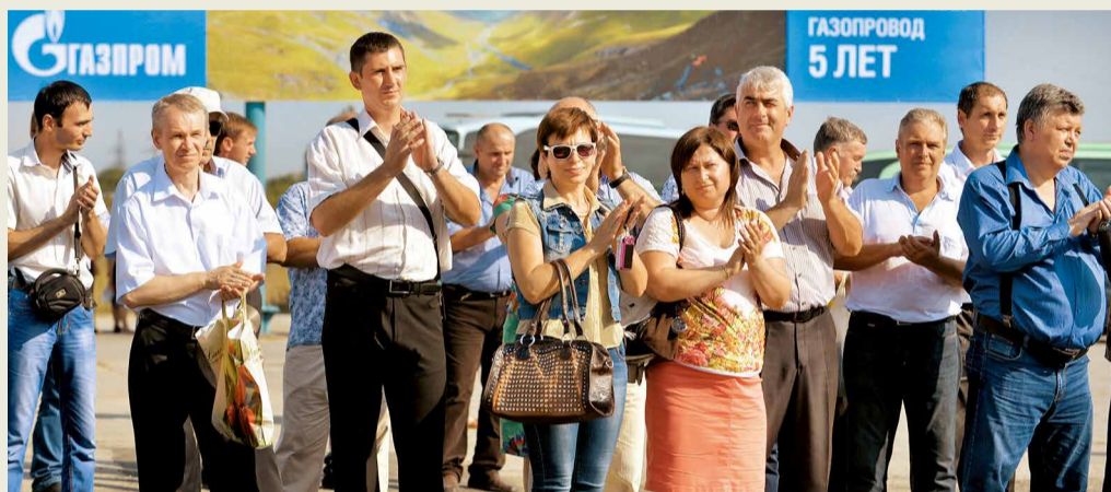
Участники митинга на Цхинвальском РЭП