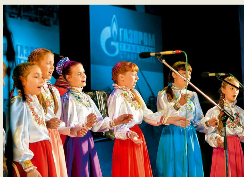
Казачьи песни – газовикам