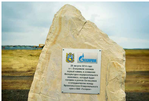
Символический камень на месте будущего строительства Физкультурно-оздоровительного комплекса

В Ставрополе состоялась церемония открытия символического камня на месте будущего строительства многофункционального Физкультурно-оздоровительного комплекса (ФОК).