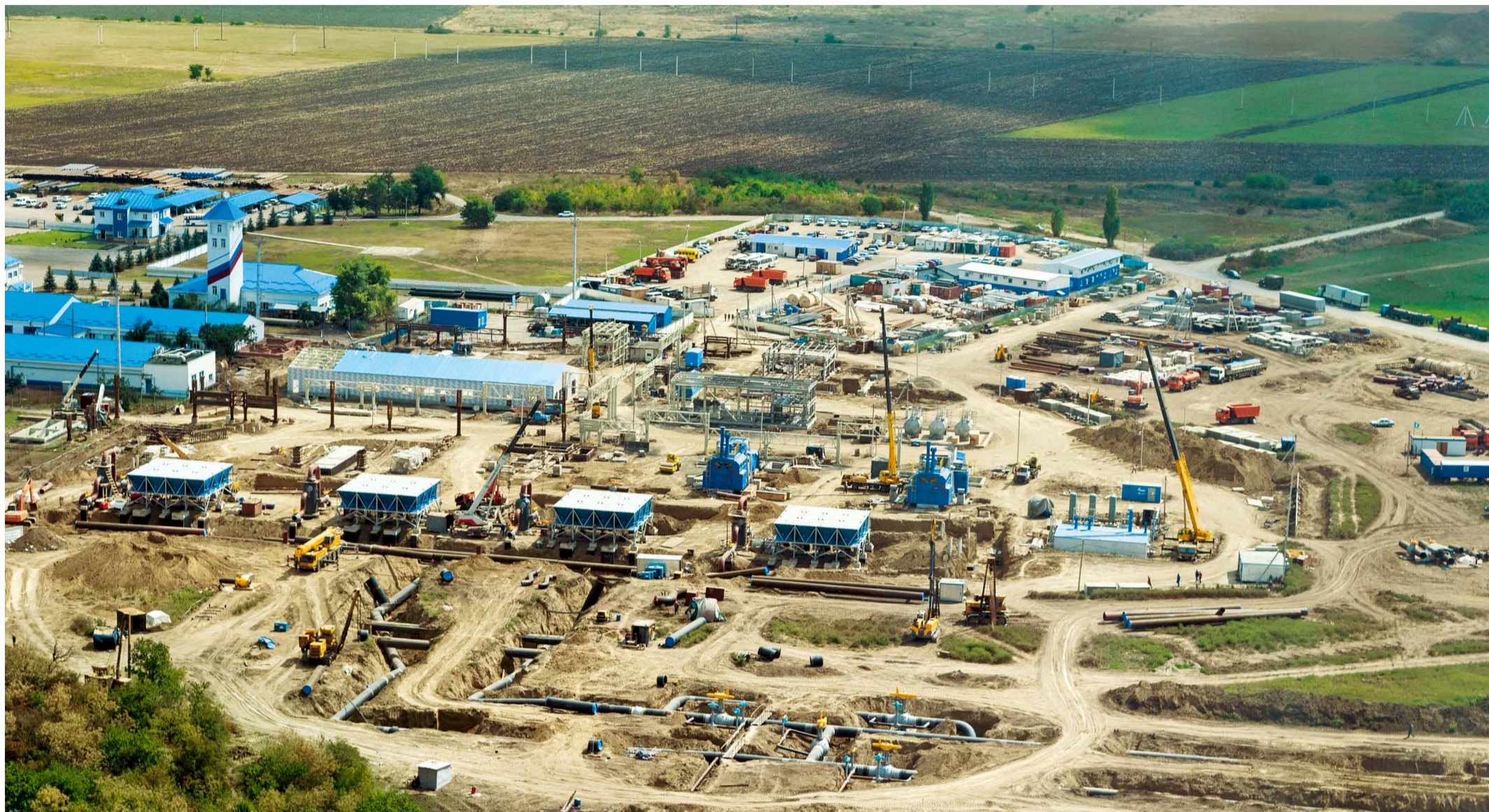
Масштабные ремонтные работы по реконструкции КС-8 в Георгиевске в рамках реализации проекта «Реконструкция КС системы газопроводов Северный Кавказ – Центр на участке Привольное – Моздок»