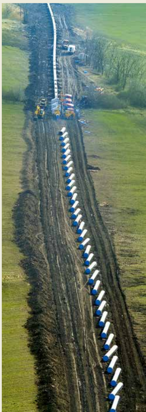
Трубоварочный поток на линейной части строящегося магистрального газопровода КС «Изобильный» – Невинномысск.

В первое воскресенье сентября в России отмечается День работников нефтяной и газовой промышленности – профессиональный праздник всех тех, кто трудится в жизненно важных для страны отраслях экономики.