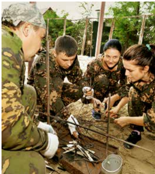
Турэстафета. Этап «Разведение костра»

На вязке узлов все проходило еще быстрее. На выполнение задания отводилась одна ми-