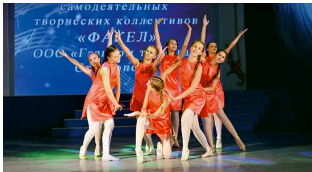
Танцевальный номер «Нельзя забыть»