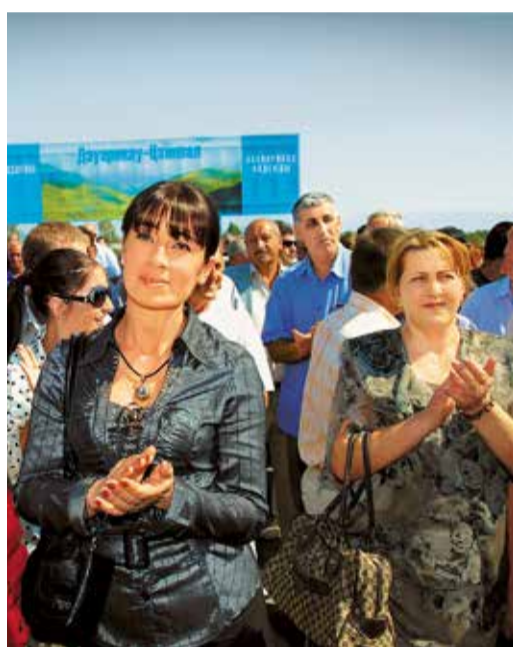
Благодарные жители республики