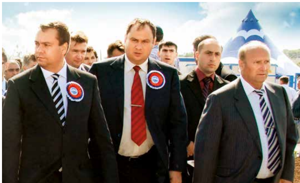
Гости и хозяева праздника на торжественном митинге в г. Цхинвале