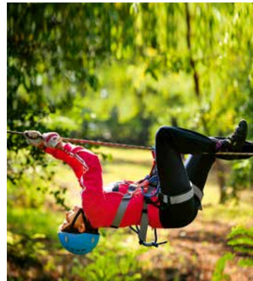
Соревнования по туртехнике