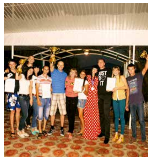
Победители и призеры молодежного турслета