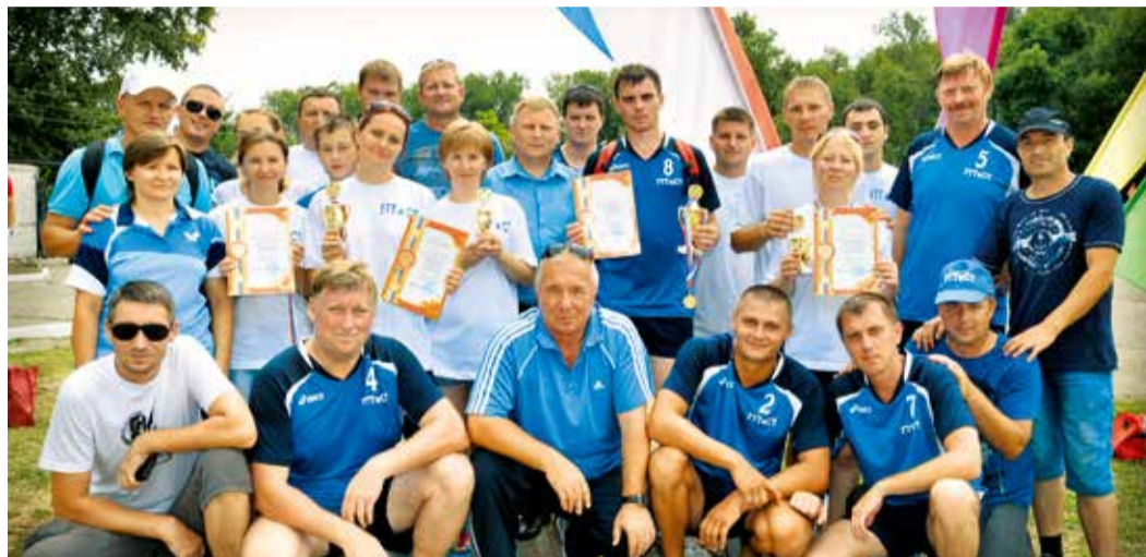
Команда УТТиСТ – призер городской олимпиады