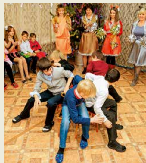
Благотворительная акция в социально-реабилитационном центре для несовершеннолетних детей с. Тищенского.