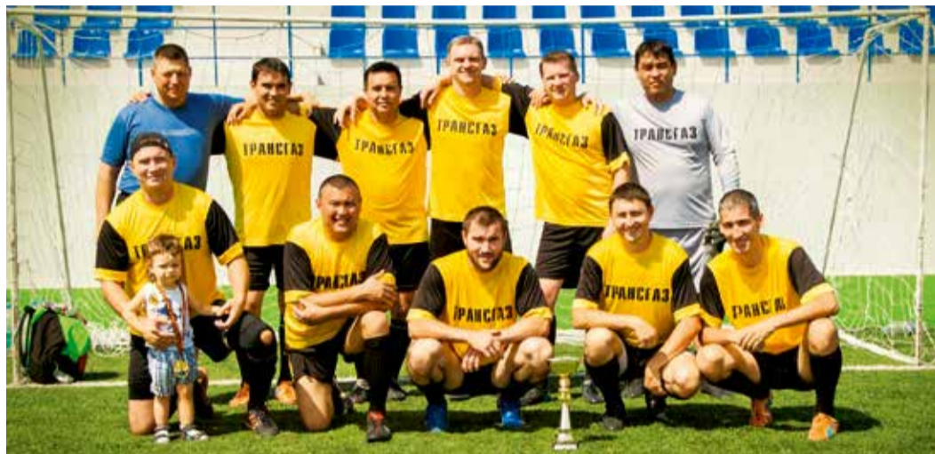
Футболисты Астраханского ЛПУ МГ на турнире ветеранов