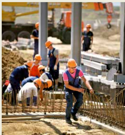
Подготовительные работы для монтажа оборудования на КС «Георгиевск».