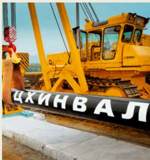
В 2014 году исполнилось пять лет со дня ввода в эксплуатацию самого высокогорного газопровода в мире «Дзуарикау – Цхинвал».