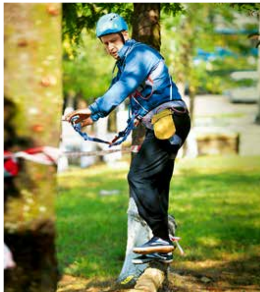
Переправа по бревну

Такое жесткое, но справедливое судейство обеспечивала коллегия из Службы спасения города Ставрополя. В итоге победителя-