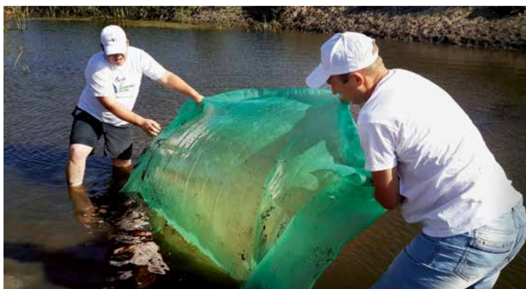
Экологическая акция в Астраханской области