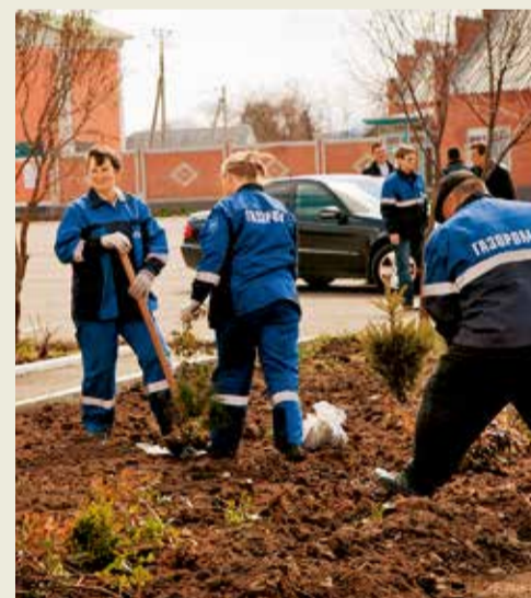
Всероссийский субботник «Зеленая Весна – 2014», проводившийся в рамках Года экологической культуры в ОАО «Газпром», охватил все филиалы Общества.