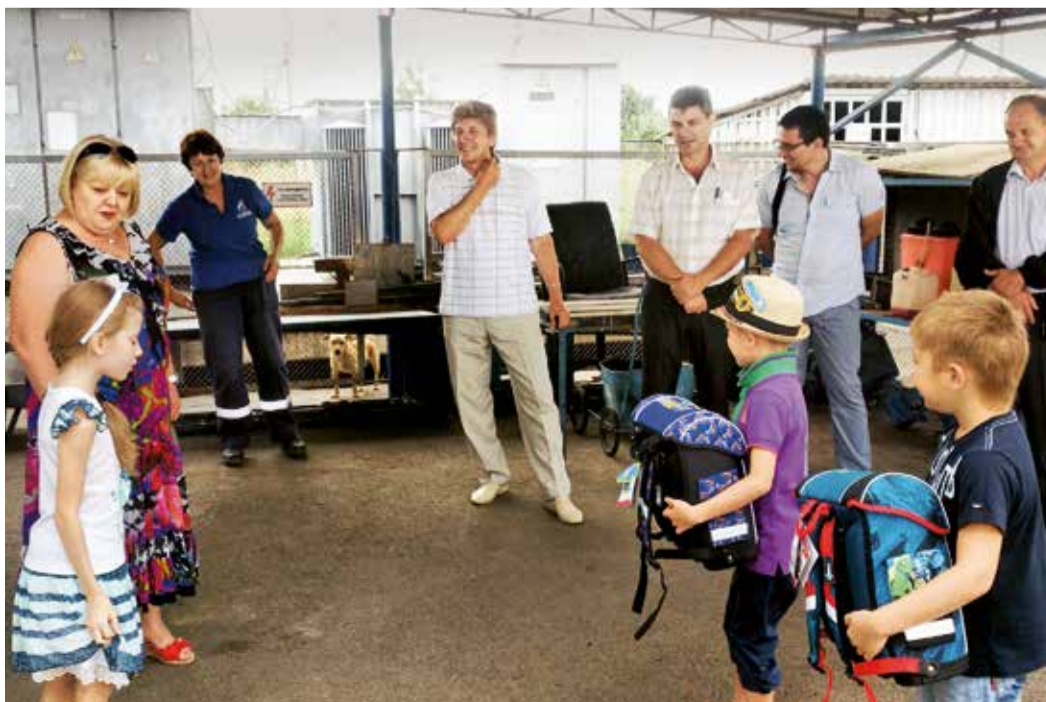
Первоклассников поздравляют работники «Кавказавтогаза»