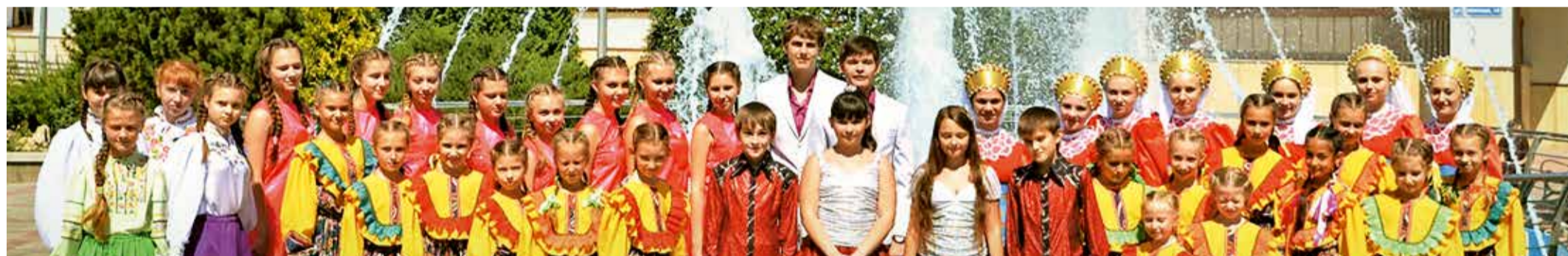
Победители и призеры отборочного тура корпоративного фестиваля «Факел» среди творческих коллективов и исполнителей ООО «Газпром трансгаз Ставрополь»