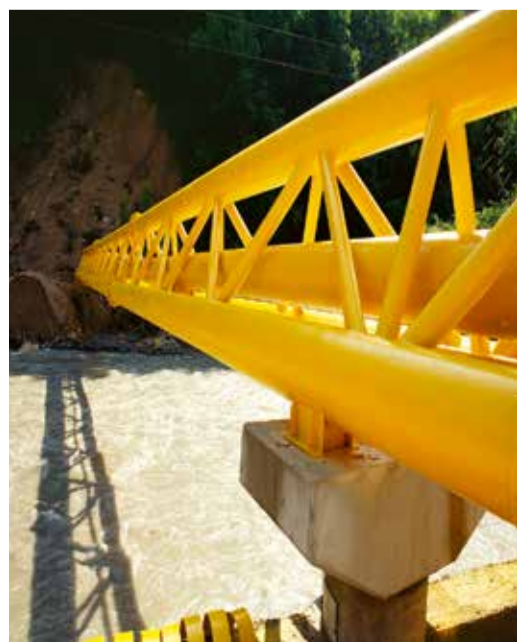
Переход через горную реку