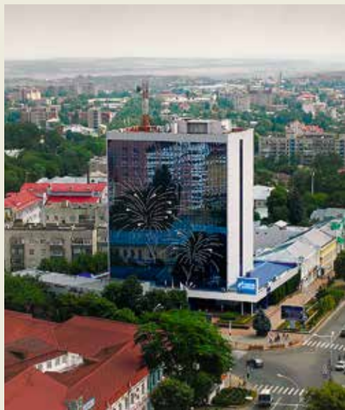
Административное здание ООО «Газпром трансгаз Ставрополь».