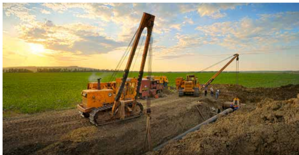
Место проведения огневых работ

чества времени, выделенного на их проведение.