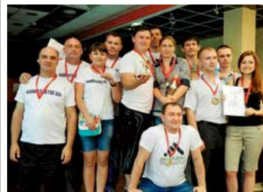
Призеры «Лиги чемпионов» по боулингу