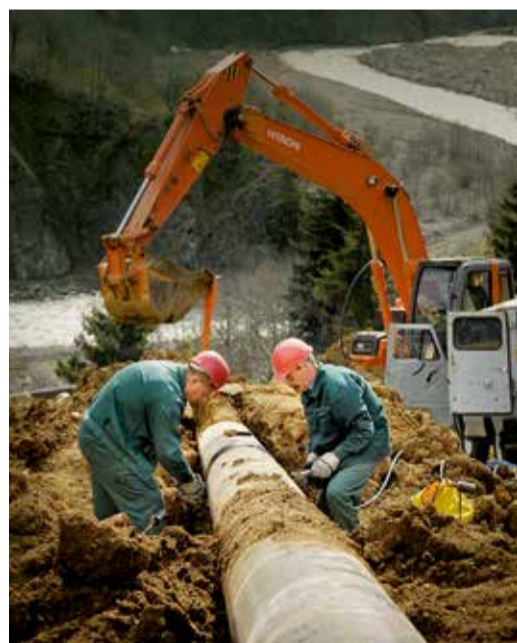
Строительные работы на линейной части