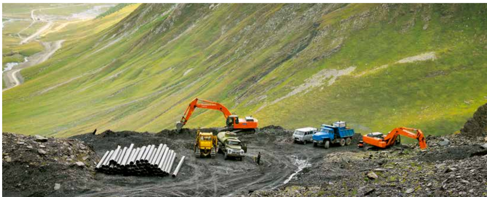
Магистральный газопровод «Дзуарикау – Цхинвал» – уникальный проект Газпрома