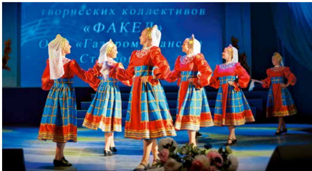
На сцене детский хореографический ансамбль «Задумка»