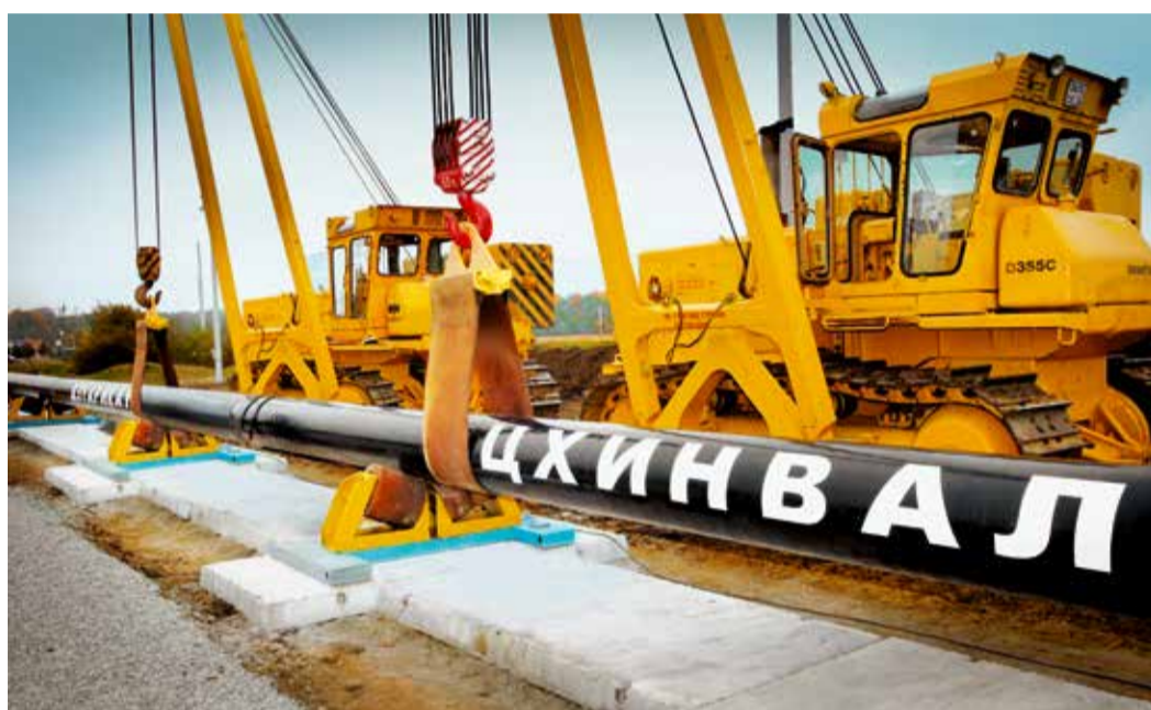
Газ подарил Южной Осетии новую жизнь