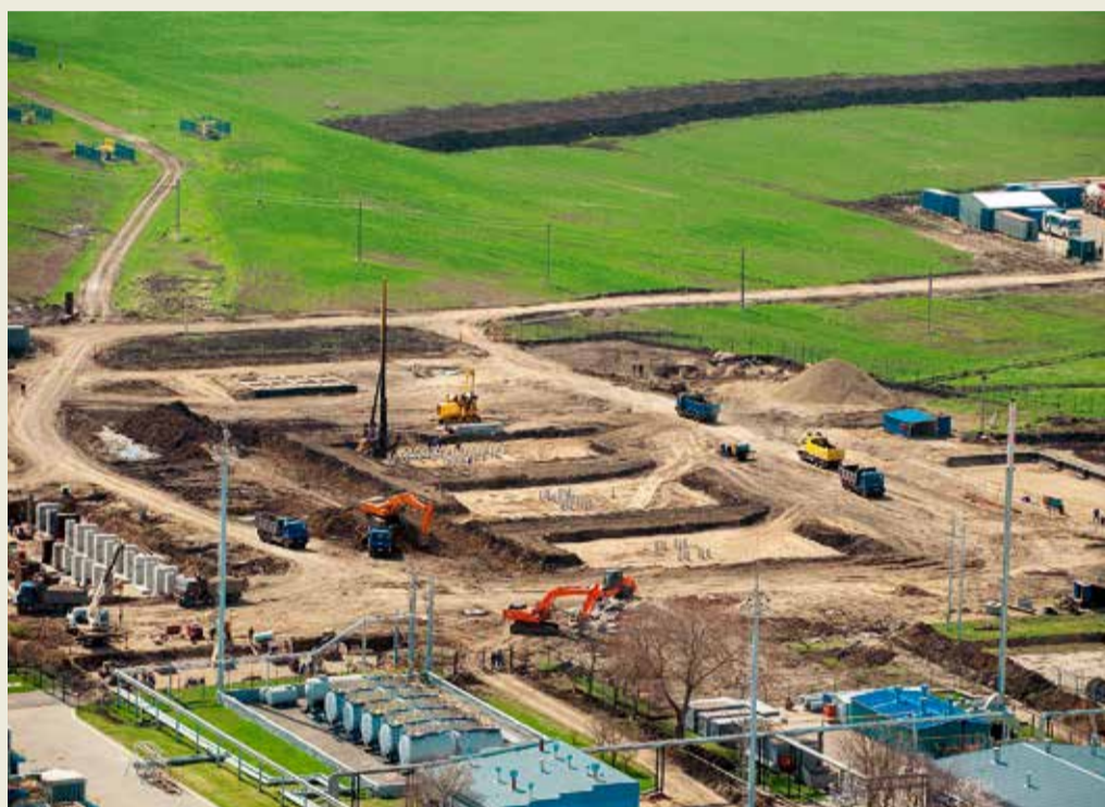
Общестроительные работы на новой площадке при реконструкции КС «Невинномысск».

Деятельность газовиков Общества также масштабна и многообразна. Строительство магистральных газопроводов, реконструкция компрессорных и газораспределительных станций, многочисленные природоохранные акции, пятилетие самого высокогорного газопровода в мире «Дзуарикау – Цхинвал», обширная социальная политика – все это отражено в главных событиях этого года, представленных в нашем фоторепортаже.