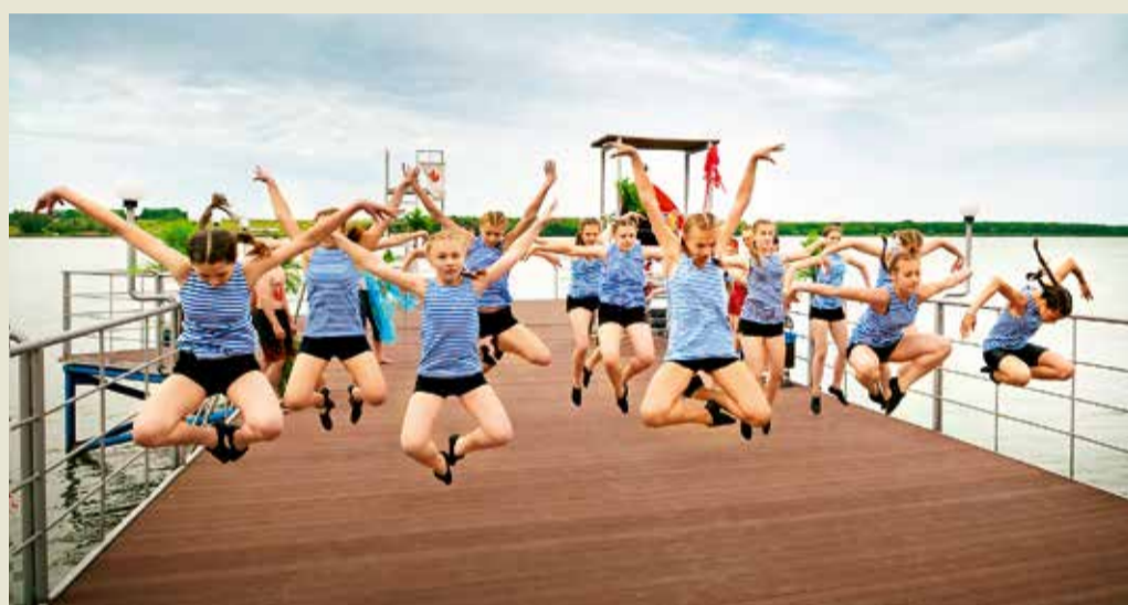
Выступление артистов Дворца культуры и спорта Общества