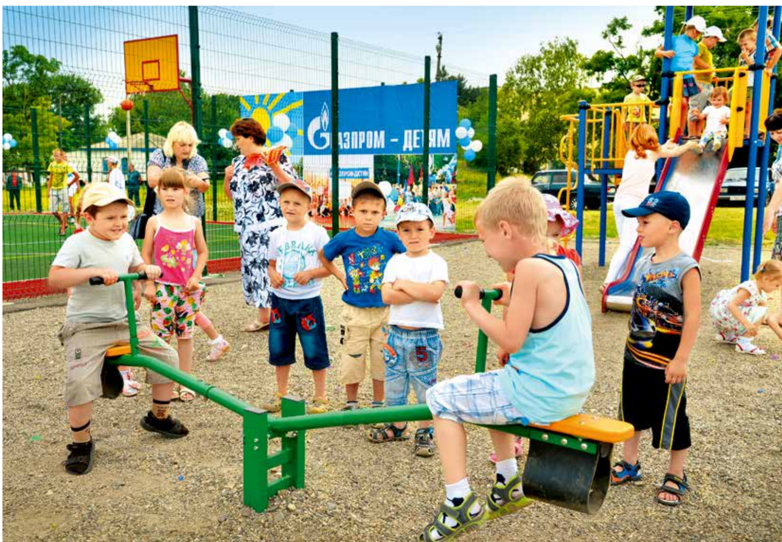
Игровой комплекс для самых маленьких атлетов