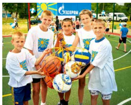
Юные спортсмены с. Птичьего с подарками