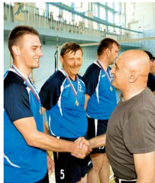
Награждение волейболистов Общества