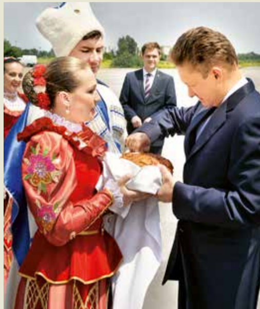
Хлеб-соль – высокому гостю