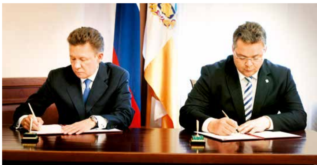
Подписание Дополнения к Соглашению о сотрудничестве между ОАО «Газпром» и правительством края

– Да, конечно, поднимались вопросы социального партнерства. Газпром был и остается социально ответственной компанией. И в подписанном сторонами Дополнении к Соглашению отражено это направление сотрудничества. В частности, в перспективе Газпром планирует построить в Ставрополе физкультурно-оздоровительный комплекс с плавательным бассейном. Также продолжится реализация программы «Газпром – детям», которая достаточно активно осуществлялась в крае еще с 2005 года. Наше Общество реализовало более 60 проектов. Только в этом году