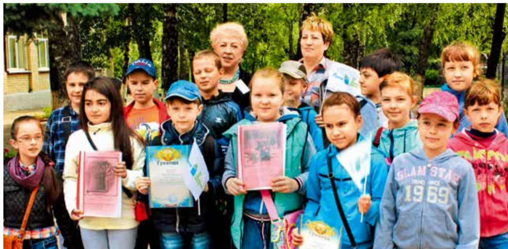
Победители конкурса «Красная книга своими руками»

Кроме того, экологи ИТЦ вместе со студентами экоотряда СКФУ провели открытый урок в седьмых классах средней школы № 34 г. Ставрополя. Тема занятия была посвящена анализу основных экологических проблем Ставропольского края и поиску их реше-