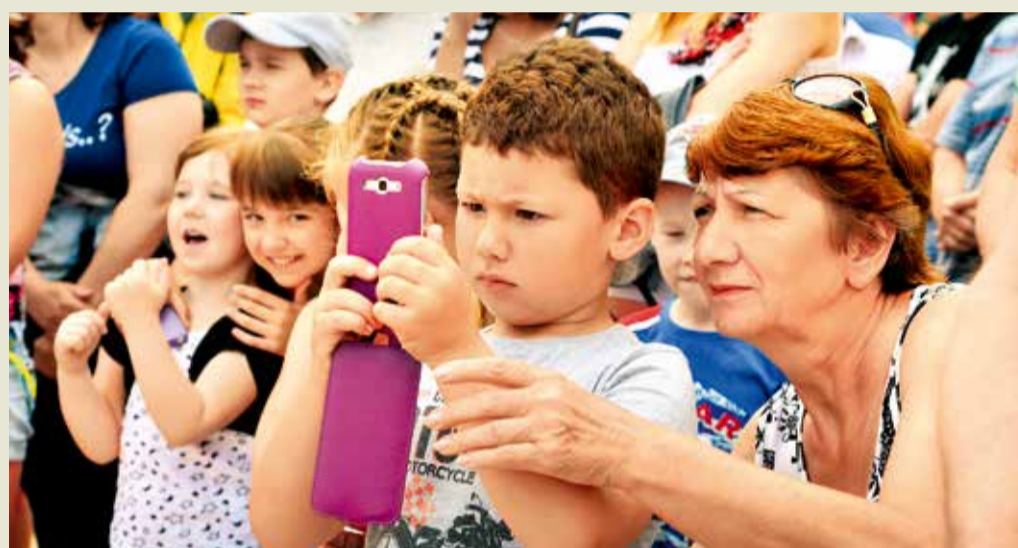
Зрители увлеченно наблюдают за происходящим