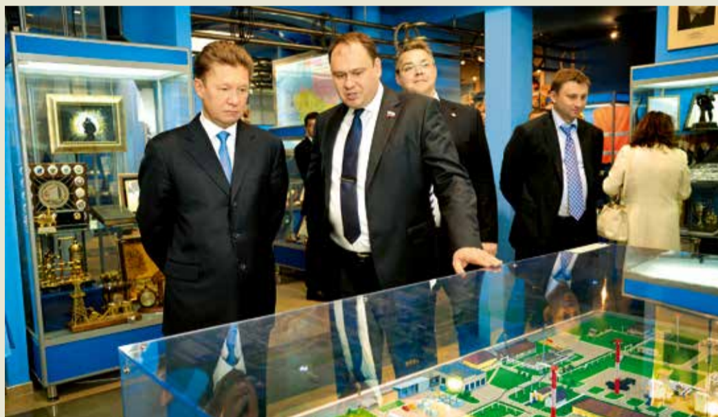
В Информационно-музейном центре ООО «Газпром трансгаз Ставрополь»