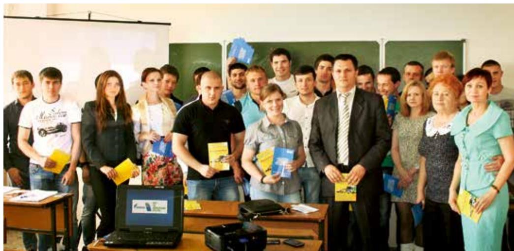
Участники «круглого стола» в СКФУ