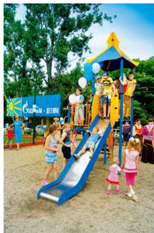
Площадки никогда не пустуют