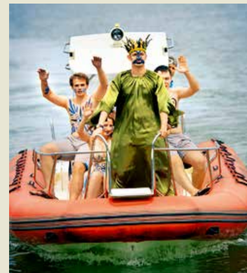
Эффектное появление Нептуна