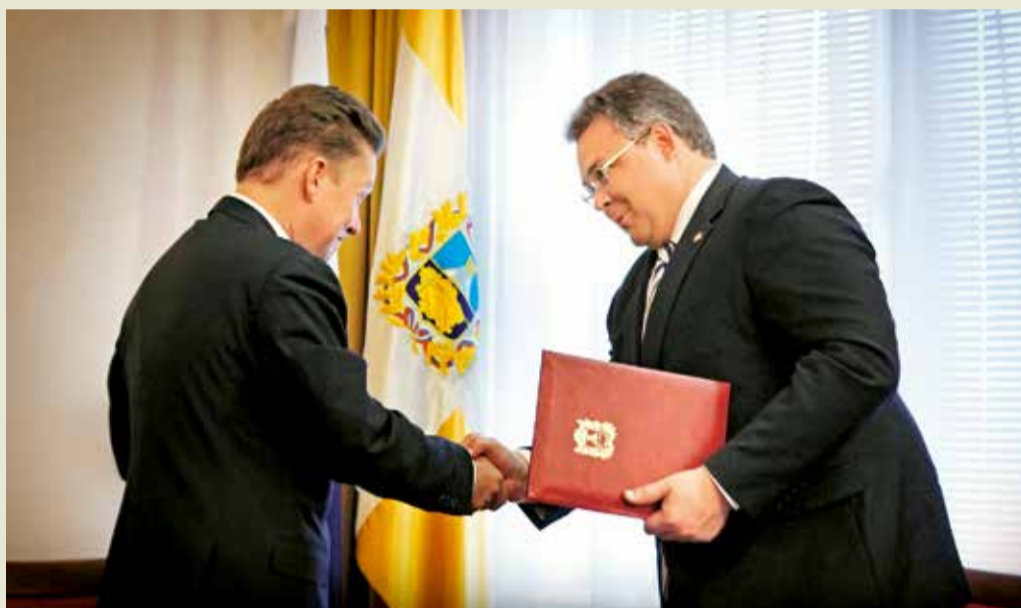
Дополнение к Соглашению о сотрудничестве между ОАО «Газпром» и правительством края подписано