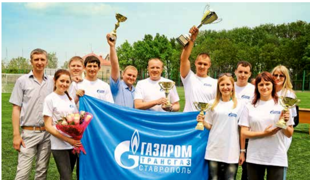
Команда ООО «Газпром трансгаз Ставрополь» — серебряный призер городской Спартакиады