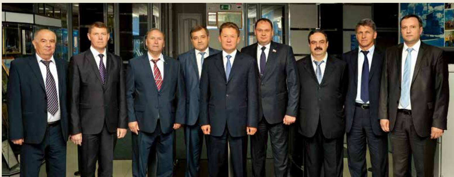
Председатель Правления ОАО «Газпром» Алексей Миллер с руководством Общества