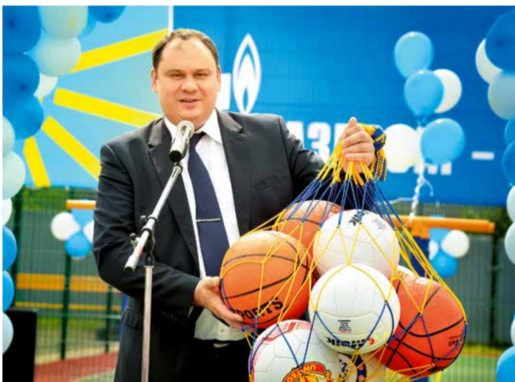
Еще один подарок детворе от нашего Общества