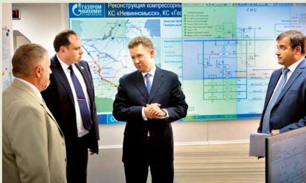
В производственно-диспетчерской службе Общества