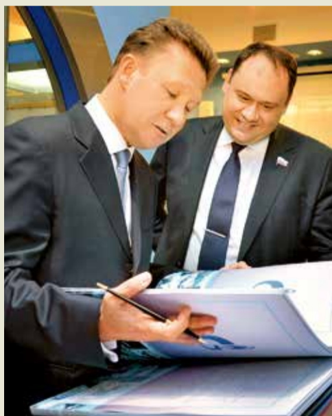
Запись в Книге почетных гостей