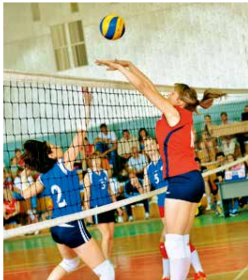
Финал женского турнира