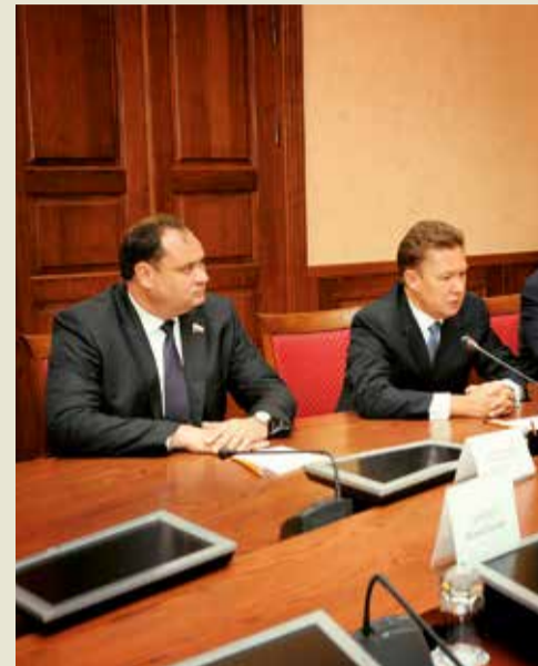
В правительстве Ставропольского края