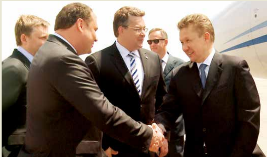
Встреча в аэропорту