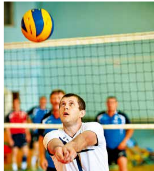
«Принимаю удар на себя!»

В рамках турнира также состоялась показательная встреча между профессиональным клубом «Газпром Ставрополь» (г. Георгиевск) и сборной командой Общества.