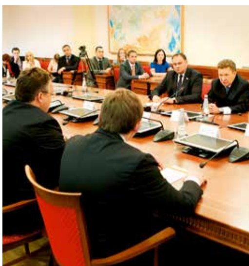
Рабочая встреча в правительстве СК

Алексей Борисович затронул очень важную тему такого мегапроекта Газпрома, как «Южный поток». Наше Общество реконструирует КС «Сальская» на территории Ростовской области и строит участок газопровода протяженностью 250 км. Председатель Правления ОАО «Газпром» отметил, что именно на юге, в зоне ответственности ООО «Газпром трансгаз Ставрополь», система магистральных газопроводов южного коридора стыкуется с системой «Голубого потока».