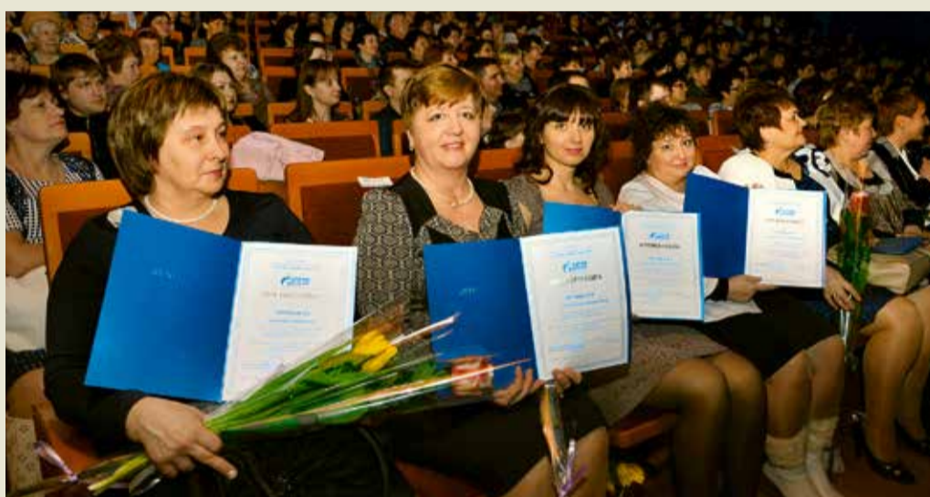
Настоящие труженицы и просто красавицы