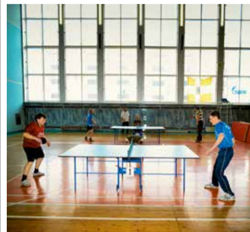
Соревнования в разгаре