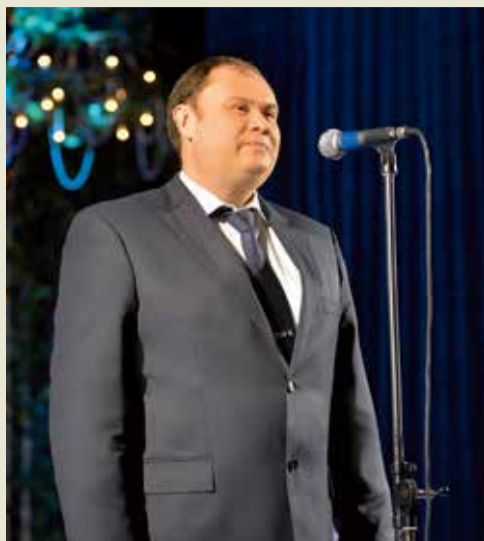
Приветствие генерального директора

работникам предприятия почетные грамоты и благодарности ООО «Газпром трансгаз Ставрополь». Оба мероприятия завершили праздничные концерты, в которых выступили коллективы и солисты Дворца культуры и спорта ООО «Газпром трансгаз Ставрополь» и приглашенные артисты.