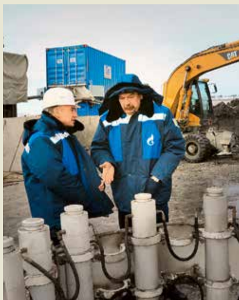
Кураторы Общества на месте проведения работ