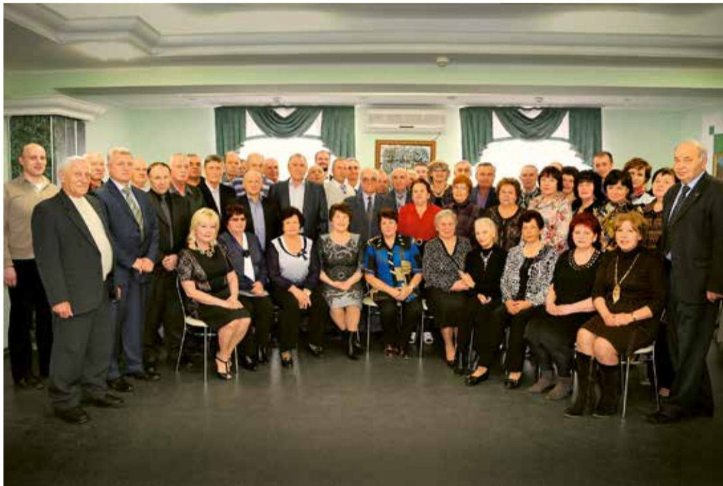
Ветераны Невинномысского ЛПУ МГ с коллегами