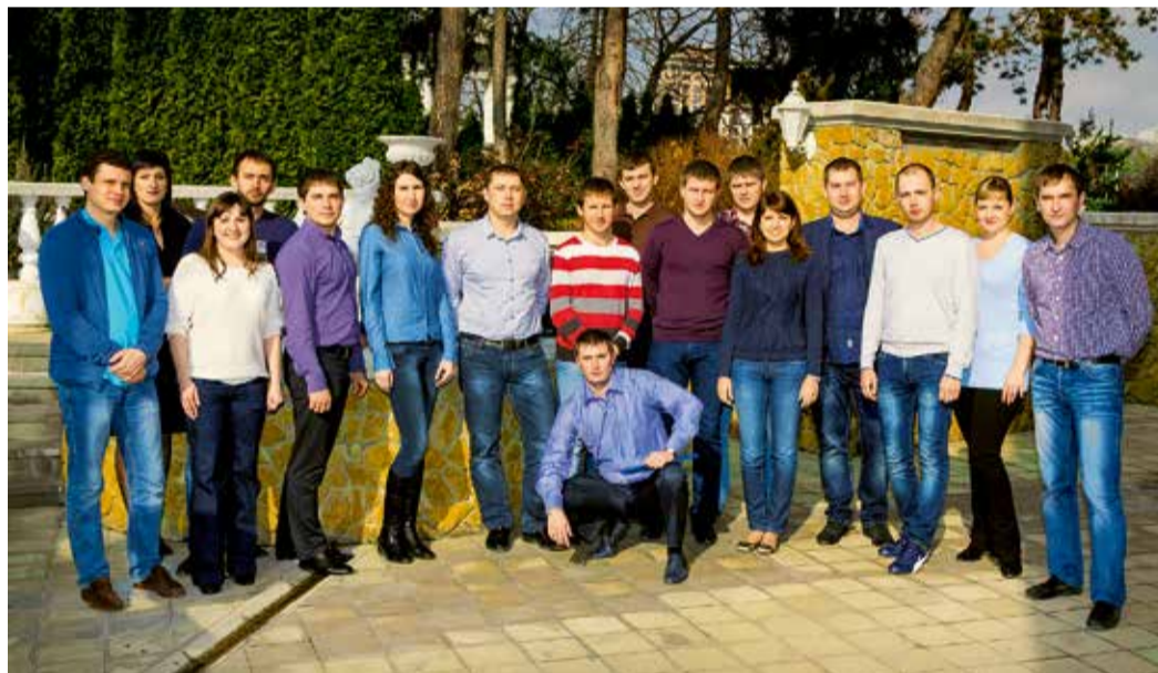
Объединенный совет молодых специалистов Общества

Кстати, во многих филиалах Общества СМС уже приступили к реализации запланированных мероприятий. В Ставропольском ЛПУ МГ молодые работники совместно