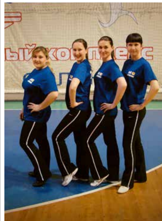
Команда Невинномысского ЛПУ МГ