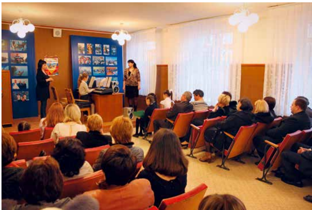
Музыкальный праздник в Привольненском ЛПУ МГ