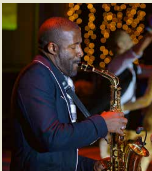
А музыка звучит...