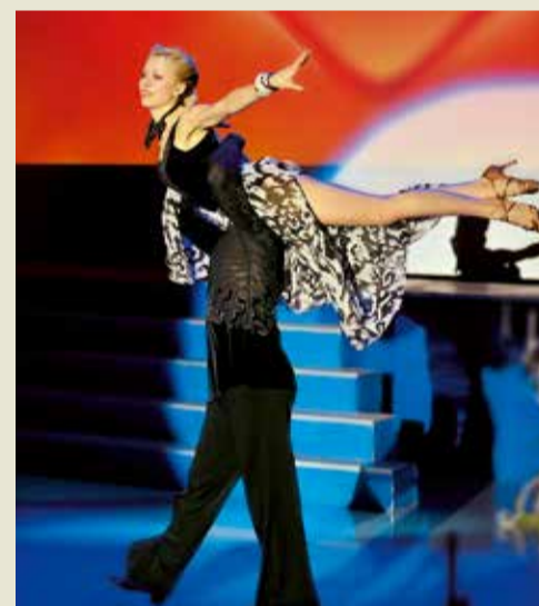
И в танце носят на руках