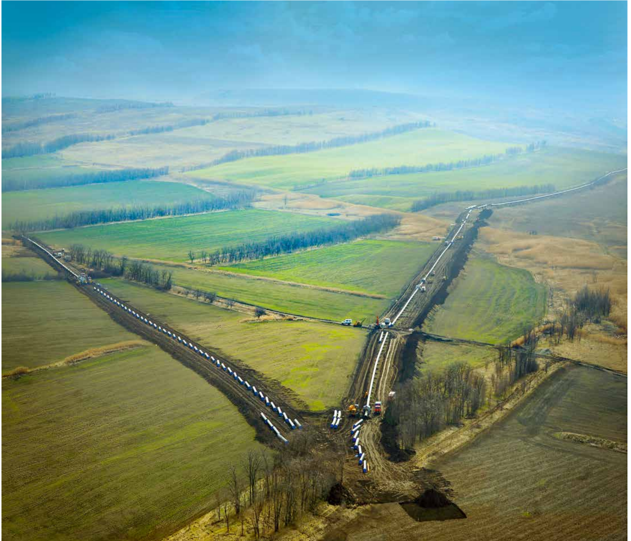
Сварка дюкера для наклонно-направленного бурения на трассе строящегося газопровода КС «Изобильный» – Невинномысск