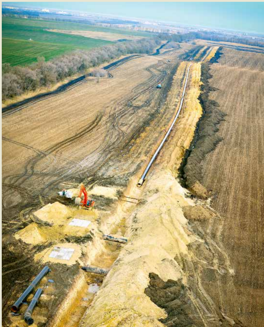
Участок пересечения строящегося газопровода с действующими МГ Общества