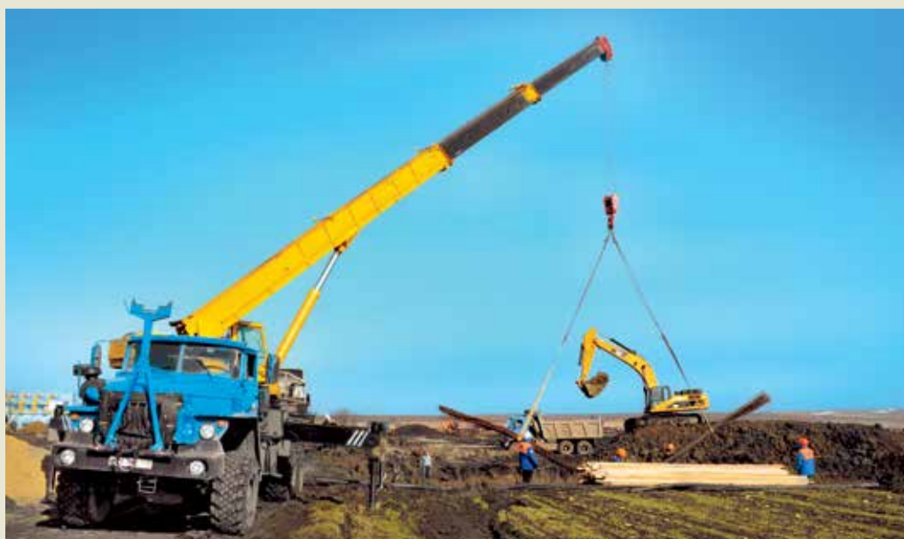
Подготовка фундамента под технологические объекты новой КС в Невинномысске