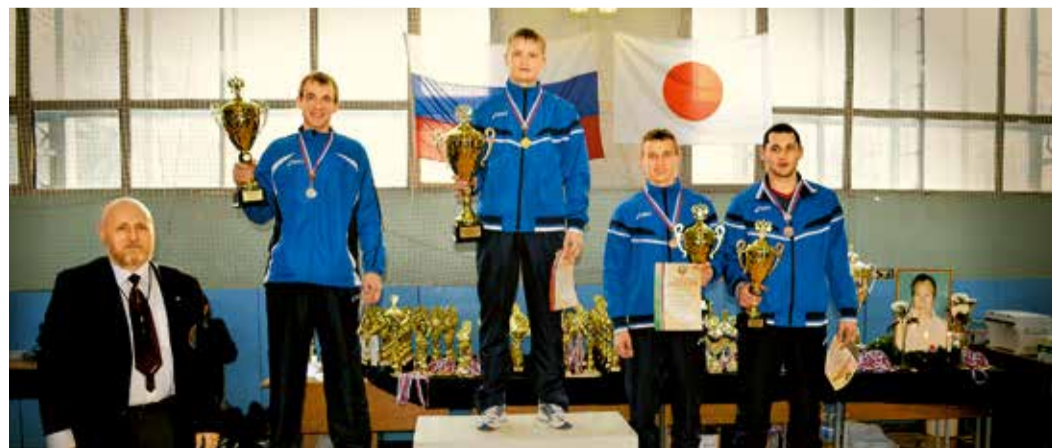
Весь пьедестал почта – за спортсменами Газпрома