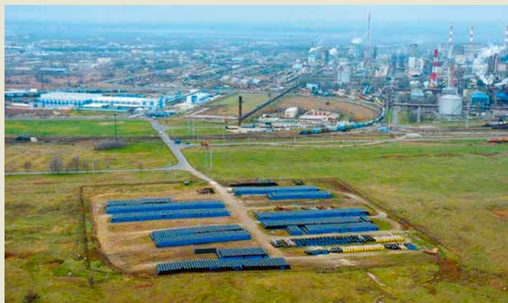
Место складирования МТР у Невинномысского ЛПУ МГ