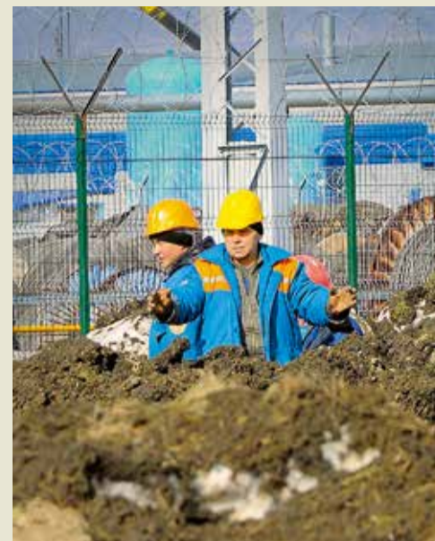
Планирование размещения объектов КС