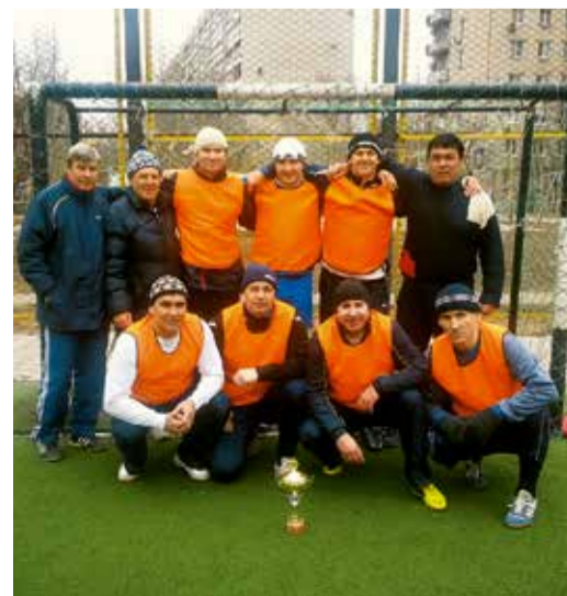
Команда Астраханского ЛПУ МГ