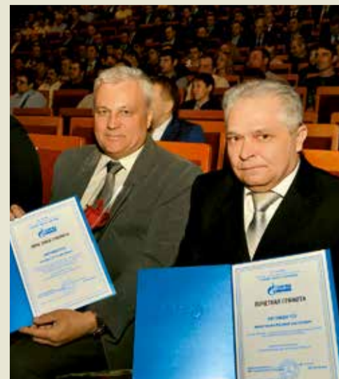
Лучшие – в первом ряду