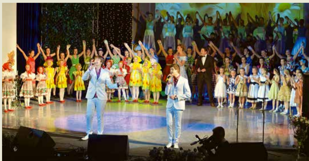
Примите наши поздравления