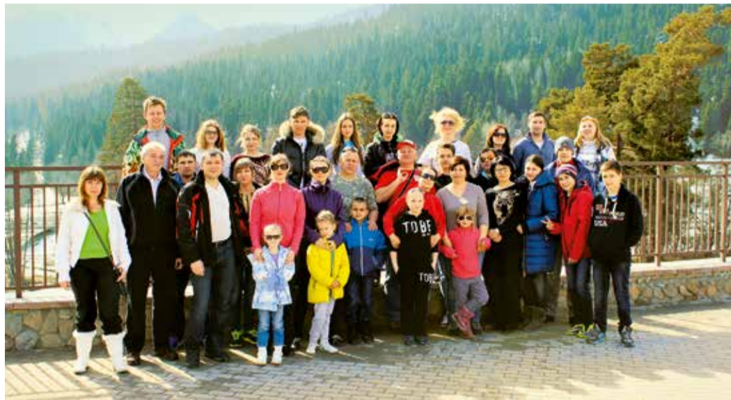
Газовики в Архызе