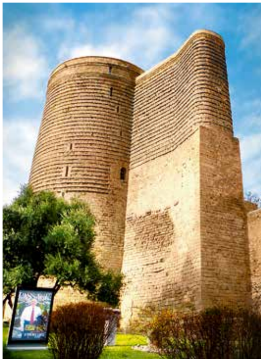
Девичья башня – визитная карточка Баку

Второй день поездки был полностью посвящен знакомству со столицей этой удивительной страны. Путешественники бродили по кривым узеньким улочкам средневековых восточных кварталов Старого города. Там увидели древние караван-сарай персидских и индийских купцов, торговые площади, мастерские и лавки ремесленников, бани, колодцы и мечети, посетили роскошный дворец Ширваншахов – бывшую столичную резиденцию правителей Ширванского го-