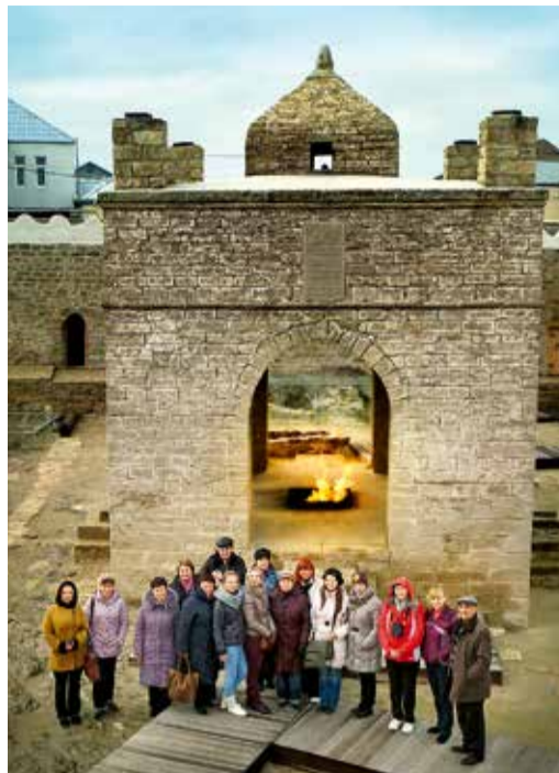
Газовики в храме огнепоклонников Атешигах