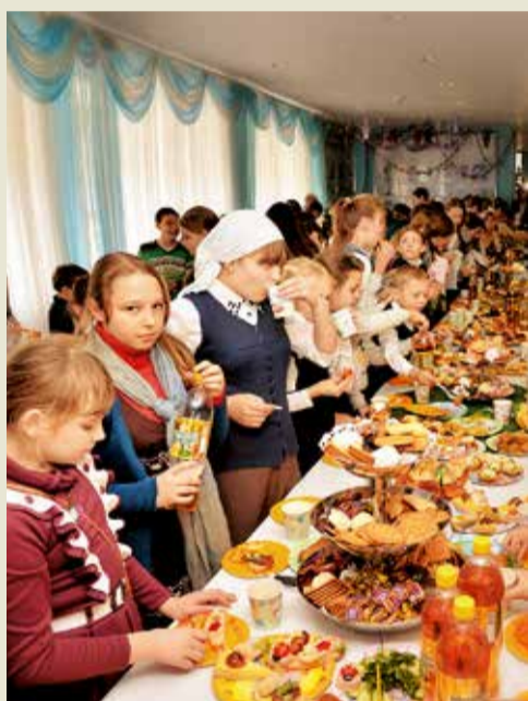
В ДКиС ребята ожидают угощения