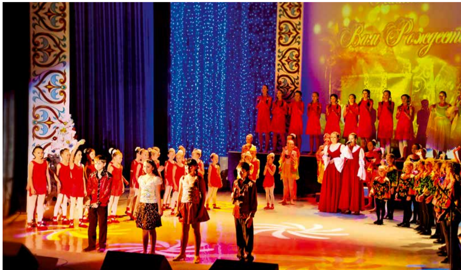
С Рождеством гостей праздника поздравляют творческие коллективы Дворца культуры и спорта Общества