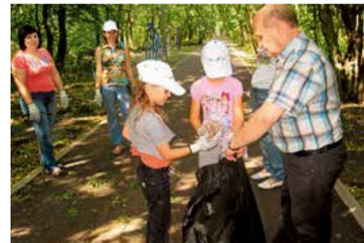
В акции «Зеленая Россия» участвуют сотрудники ИТЦ