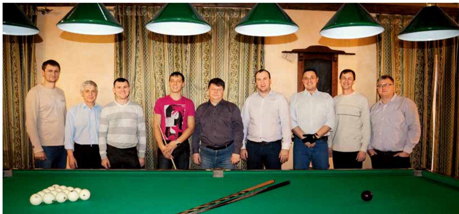
Участники новогоднего турнира по бильярду среди работников администрации Общества