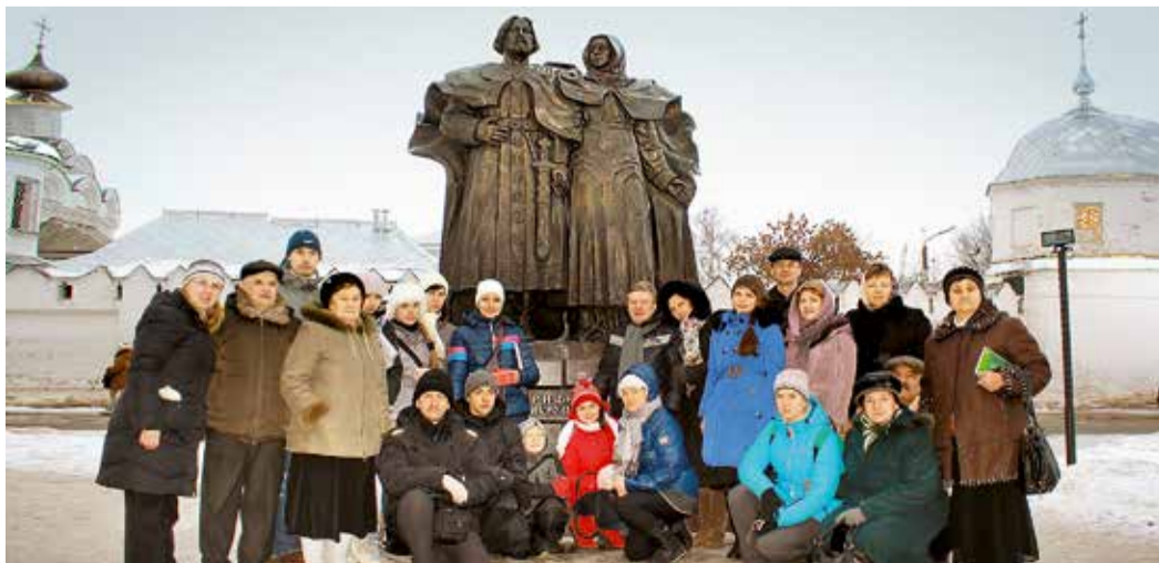
Работники Общества у памятника святым Петру и Февронии, г. Муром