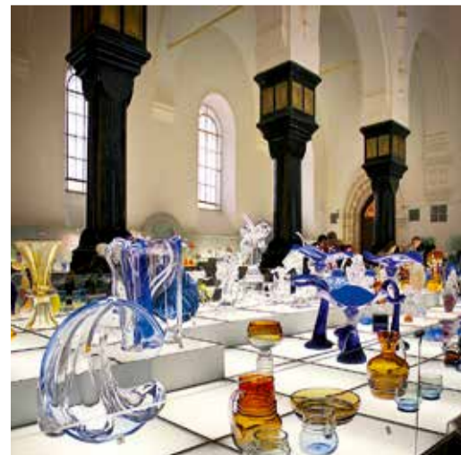
В Музее хрустала, г. Гусь-Хрустальный