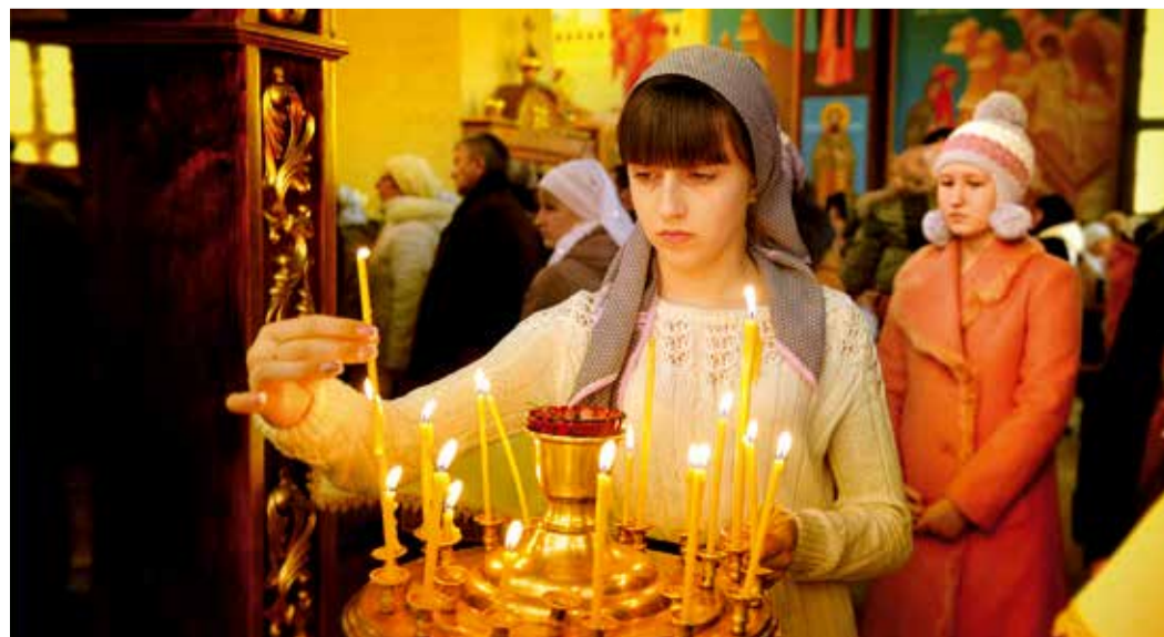
На Божественной литургии в храме Рождества Христова