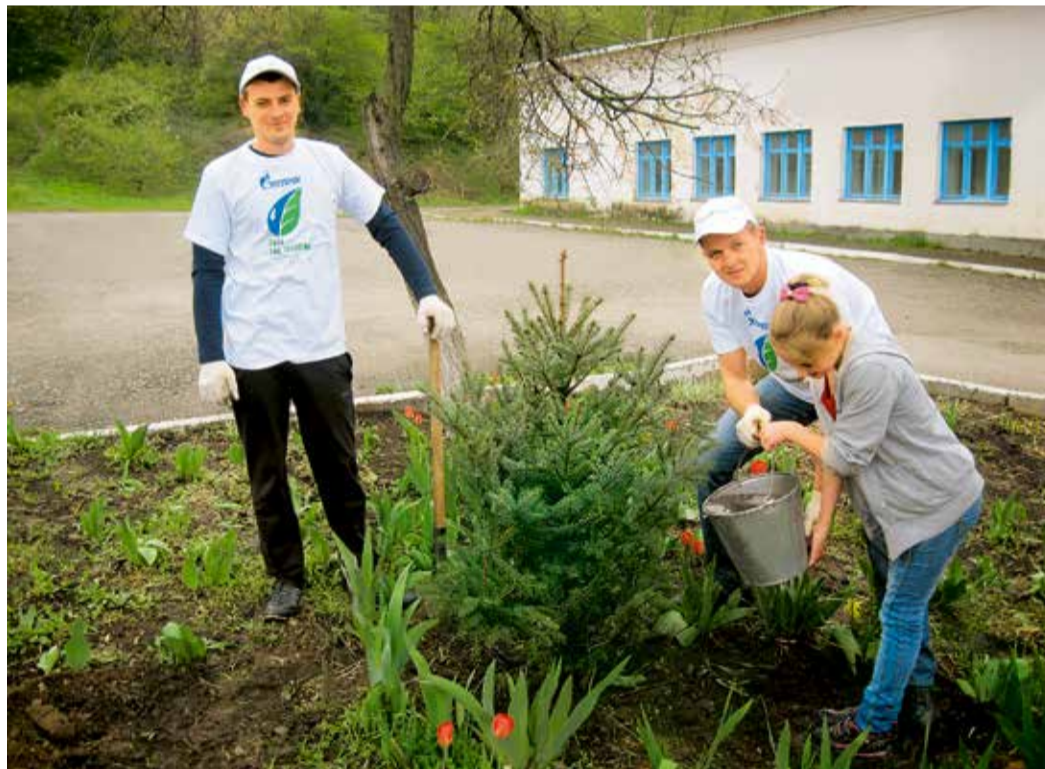
Молодые специалисты Ставропольского ЛПУ МГ высаживают деревья в школе-интернате с. Подлужного