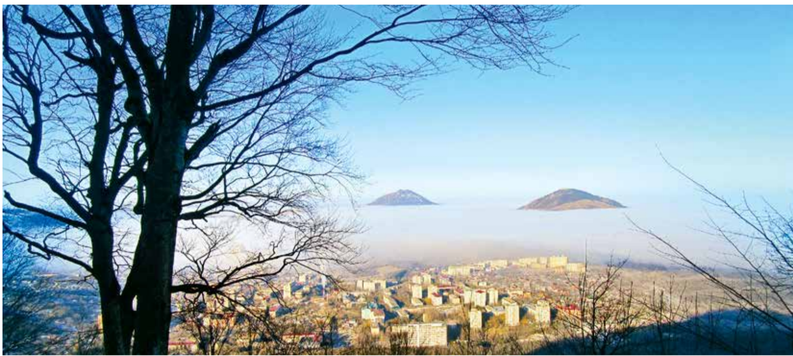
Живописный вид на город Железноводск

рода, и добираться до ее подножия работнице Инженерно-технического центра пришлось с группой велосипедистов. На вершине, как рассказывает героиня, открывается прекрасная картина: бескрайние поля и села – Прикумское, Орбельяновка.