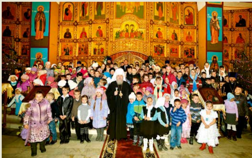
Участники благотворительного рождественского праздника после службы в храме