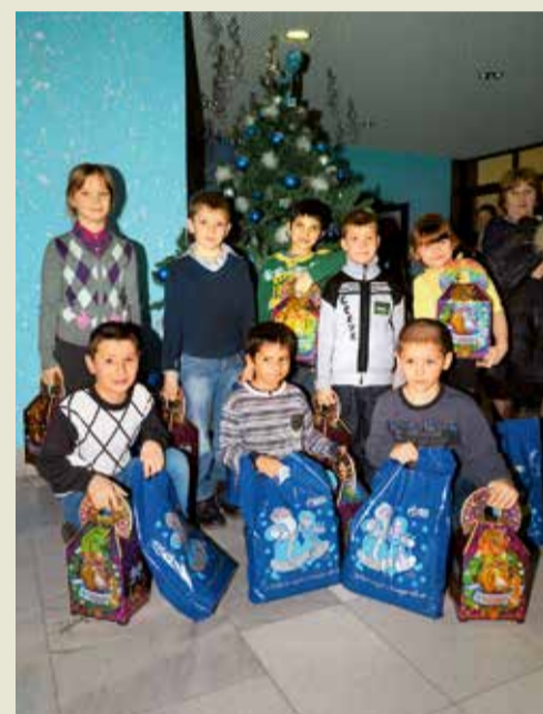
Фотография на память