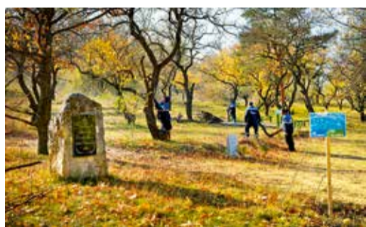
«Тропа здоровья» на горе Куцай Петровского района