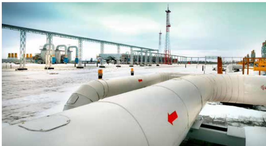
Газокомпрессорная станция «Ставропольская»