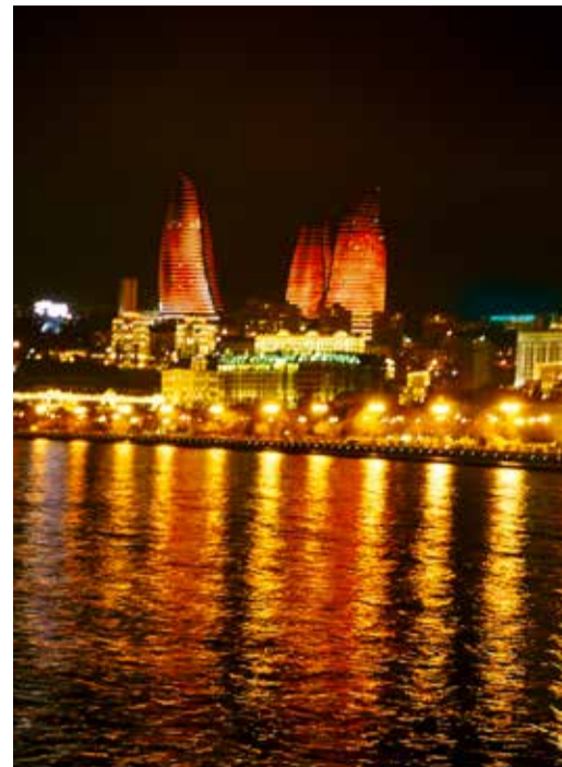
Пламенные башни – современный символ Баку

сударства. Затем забрались на величественную Девичью башню, являющуюся визитной карточкой Баку. Экскурсовод показал гостям из России и места Старого города, где снимались сцены фильма «Бриллиантовая рука». Также ставропольцы прогулялись по Нагорному парку, где находится лучшая смотровая площадка Баку. С нее открывается захватывающий вид на город, амфитеатром спускающийся к заливу.