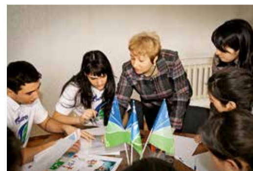
Экологическая деловая игра

Объединенная профсоюзная организация ООО «Газпром трансгаз Ставрополь» и отдел охраны окружающей среды администрации Общества организовали среди работников предприятия фотоконкурс «Мир, окружающий меня». Он проводился по трем номинациям: «Экология производства», «Гармония