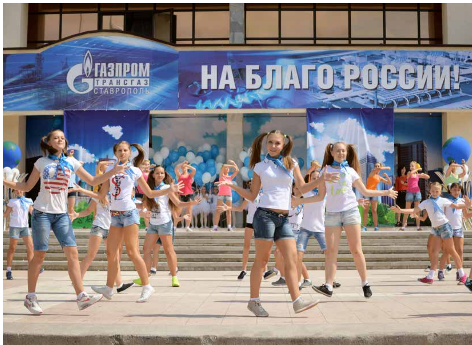
На флешмобе «Я люблю Газпром»