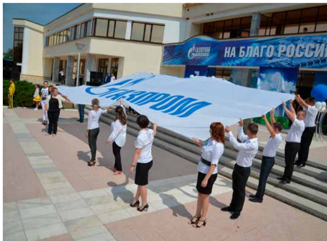
Флаг Газпрома в руках молодых газовиков