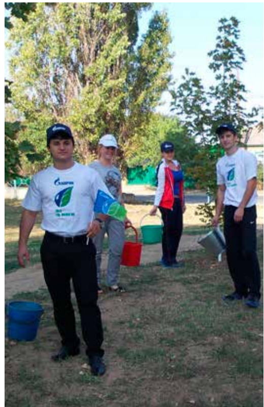
Акция «Зеленая Россия» в Светлоградском ЛПУ МГ