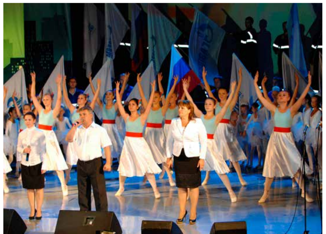
На сцене лучшие творческие коллективы ООО «Газпром трансгаз Ставрополь»