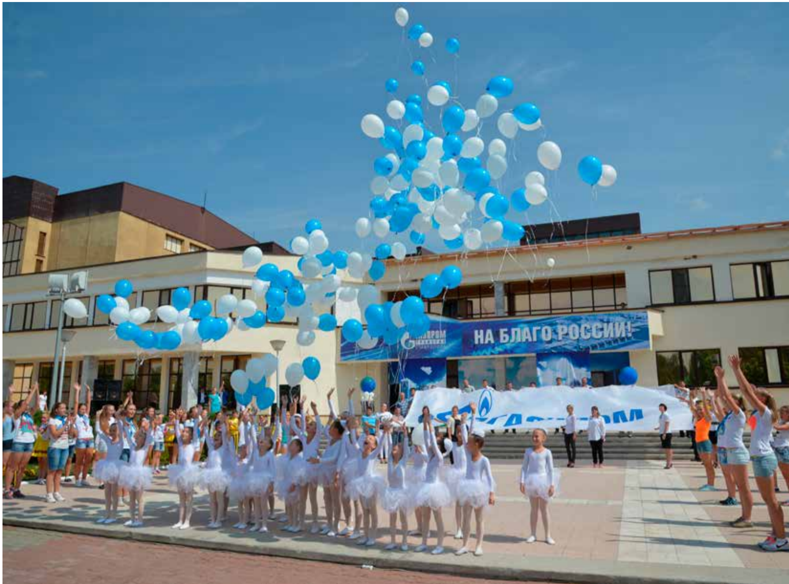
Яркий фрагмент праздника