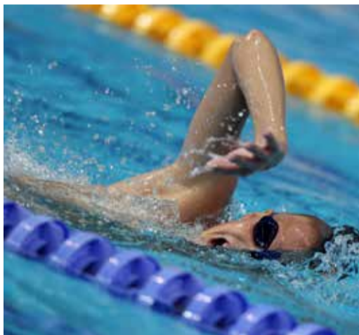
Открылось второе дыхание