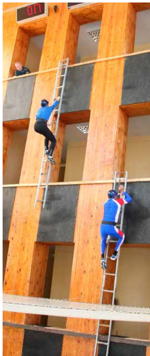
Подъем по штурмовой лестнице

В Нижнем Новгороде состоялся второй этап соревнований по пожарно-прикладному спорту среди дочерних обществ ОАО «Газпром». Команда нашего предприятия финишировала в пятерке лидеров, оставив позади себя еще шесть коллективов.