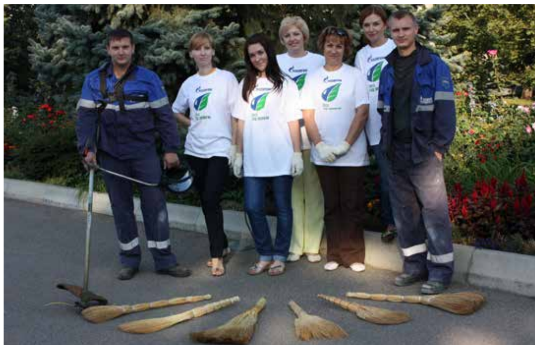
Субботник в Невинномысском ЛПУ МГ

– Мы хотим, чтобы Изобильный стал более комфортным для жизни. Для этого нужно