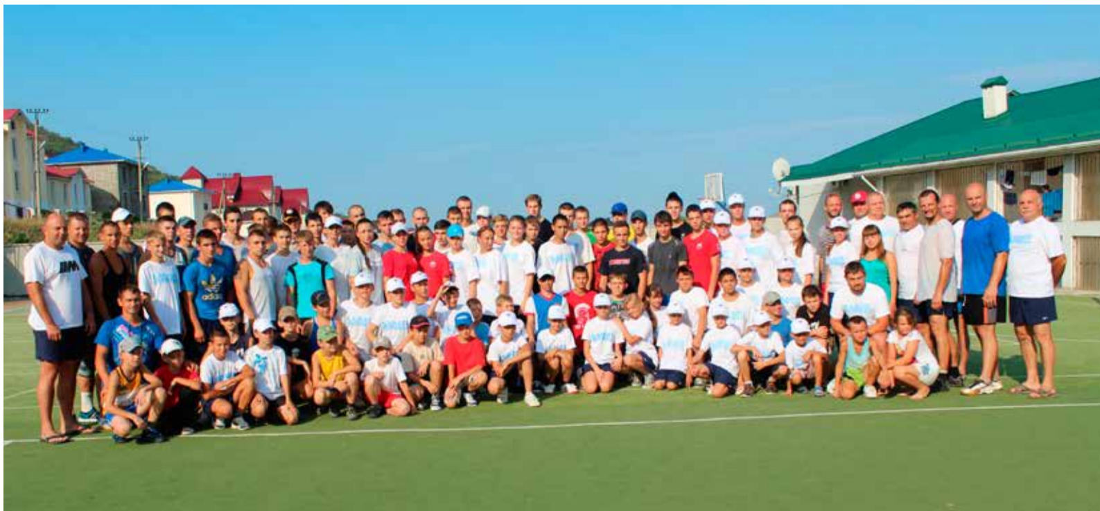
Участники тренировочных сборов по сетокан карате-до в с. Сукко