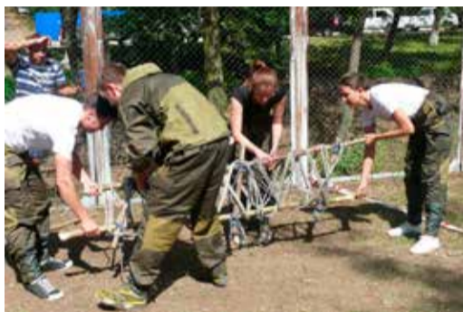
Первый день турслета