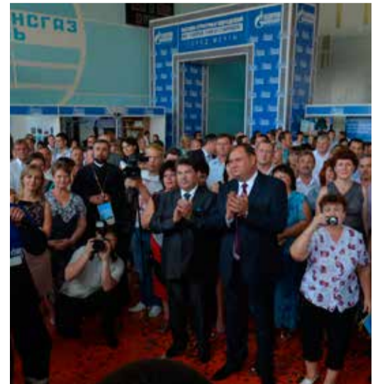
На выставке филиалов Общества