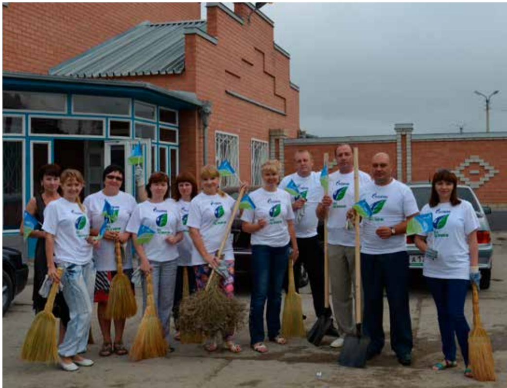
На уборке работники УАВР