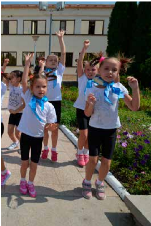
Дети – наше будущее