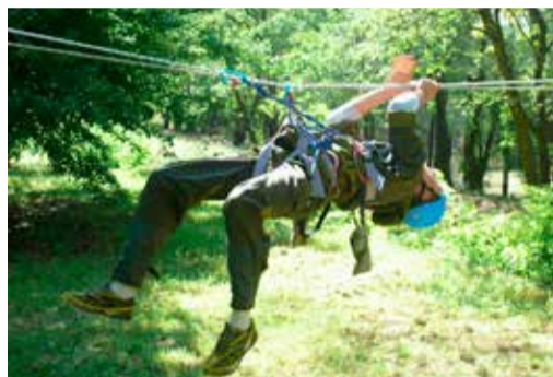
Соревнования по туристической технике