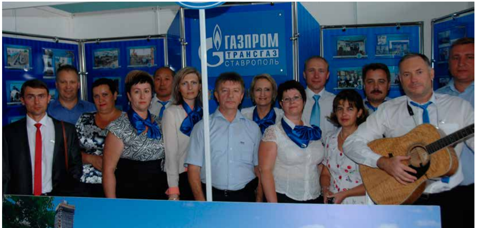
Работники Зензелинского ЛПУ МГ готовятся к презентации филиала