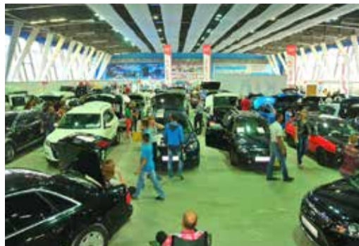
Автомобиль работника УТТиСТ (в центре) на соревнованиях

ся к очередным соревнованиям, на которых он продемонстрирует всю широту диапазонов частот своего «громкоговорителя на колесах».