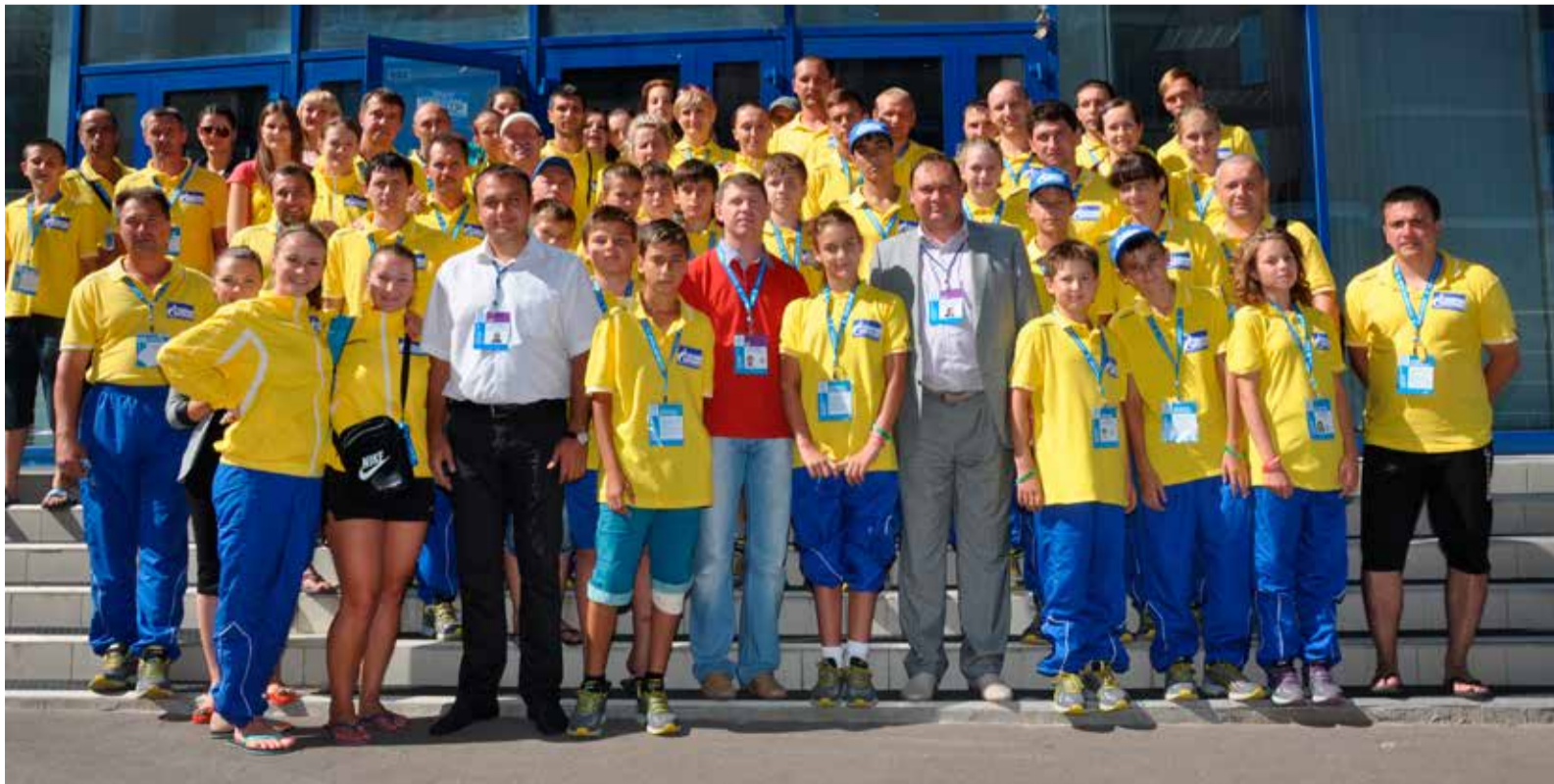
Делегация ООО «Газпром трансгаз Ставрополь» в Казани