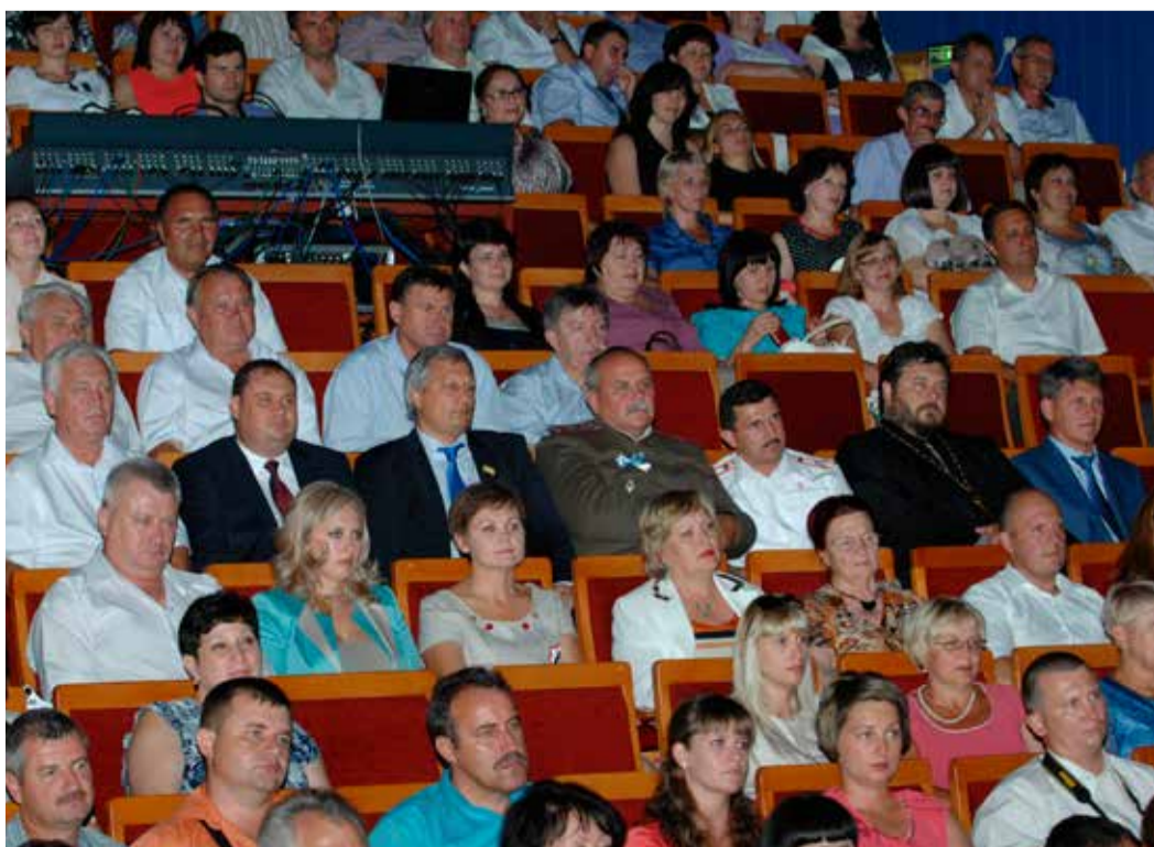
На праздничном концерте