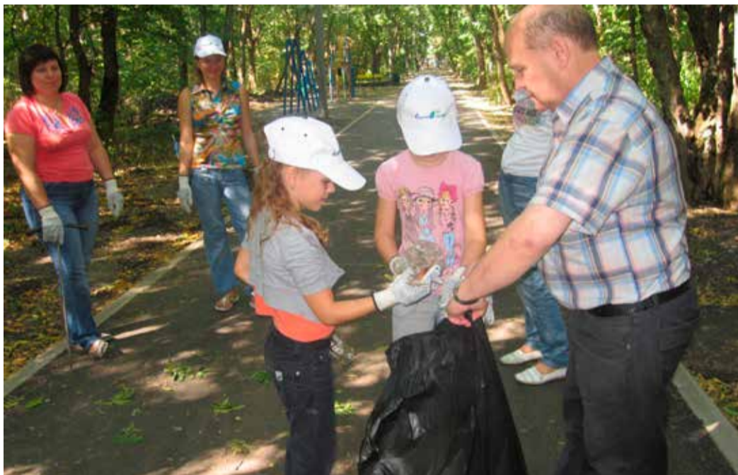
Сотрудники ИТЦ наводят чистоту в Таманском лесу

поддерживать чистоту и порядок, развивать экологическую культуру, а наши работники своей инициативой по наведению порядка показали пример ответственного отношения к природе и среде обитания, – отметила веду-