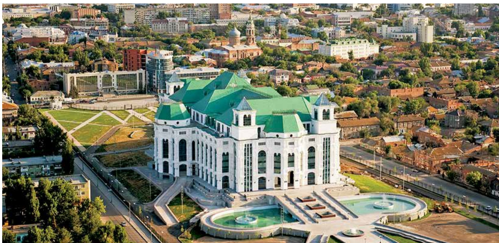
Астраханский государственный театр оперы и балета