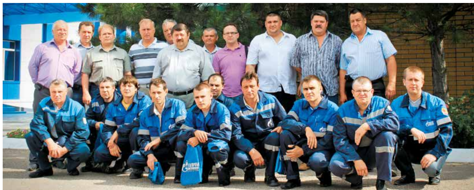
Участники конкурса «Лучший монтер по защите подземных трубопроводов от коррозии»