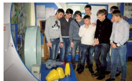
Студенты СКФУ в музее Ставропольского ЛПУ МГ