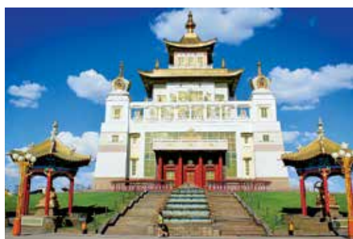
Храм – хурул «Золотая обитель Будды Шакьямуни»