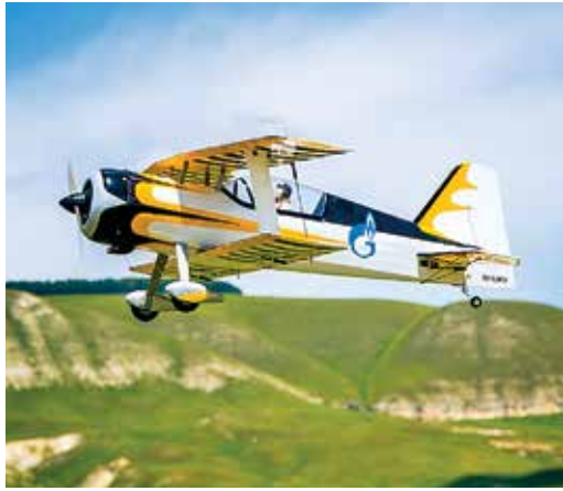
Все выше и выше...