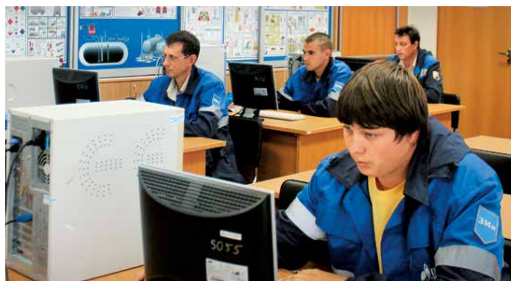
■ Электронное тестирование