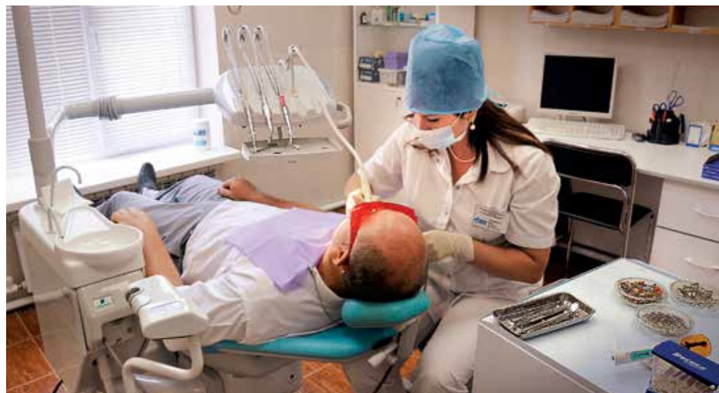
В стоматологическом кабинете