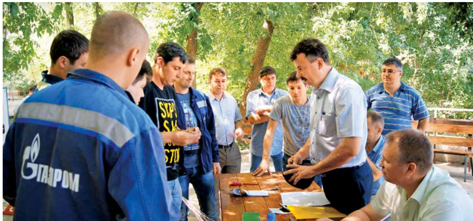
Инструктаж участников перед практическим заданием