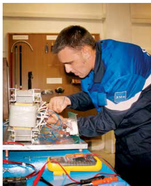
Сборка схемы сетевого выпрямителя