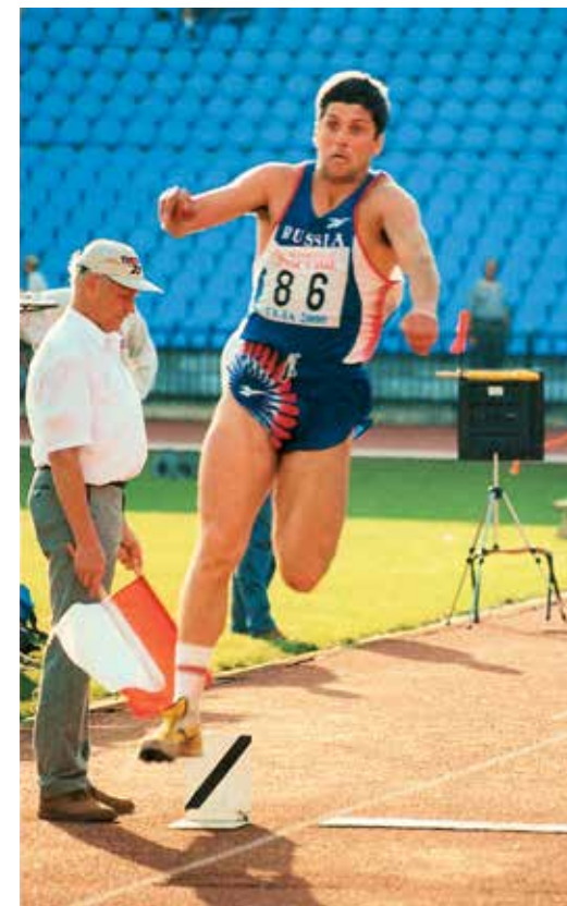
Во время соревнований

– Спорт – это особая часть моей жизни, но выступать на максимуме в течение нескольких олимпийских циклов удается далеко не всем. Конечно, хотелось бы добиться побед не только на чемпионатах страны и Европы, но и завоевать олимпийскую медаль. Однако жизнь распорядилась иначе. В любом случае спорт многому меня научил: упорству, трудолюбию, дисциплинированности, ответственности. После окончания спортивной карьеры немного поработал тренером. Потом позвали в Газпром, и вот уже одиннадцать лет тружусь в Службе корпоративной защиты. Всем