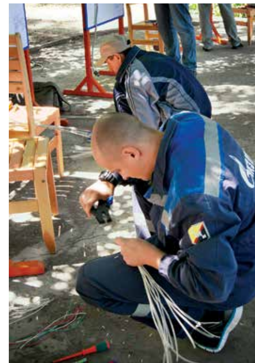
Практическая часть конкурса