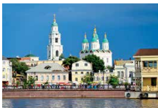
Астрахань. Панорама города с Волги