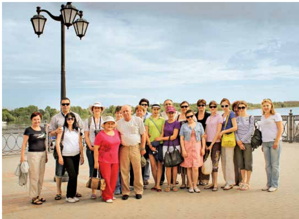
Сотрудники администрации Общества на набережной реки Волги