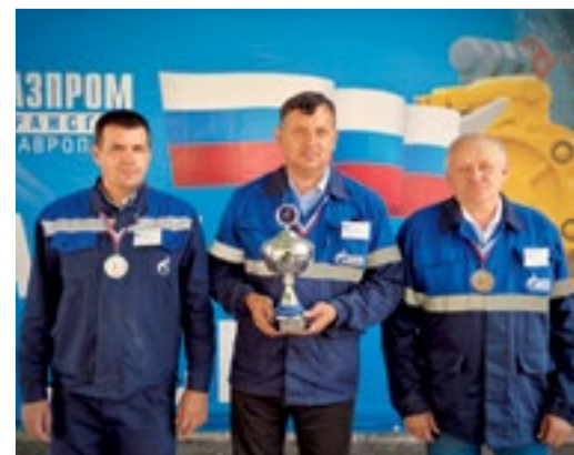
Победитель и призеры конкурса кабельщиков-спайщиков