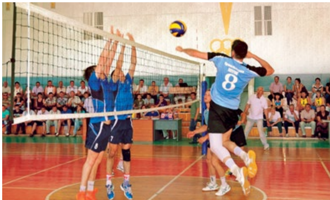
Финальный матч в мужском зачете