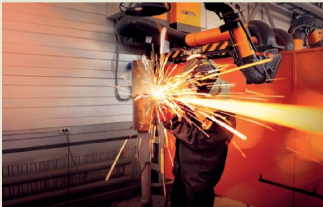
Идет сварка катушки