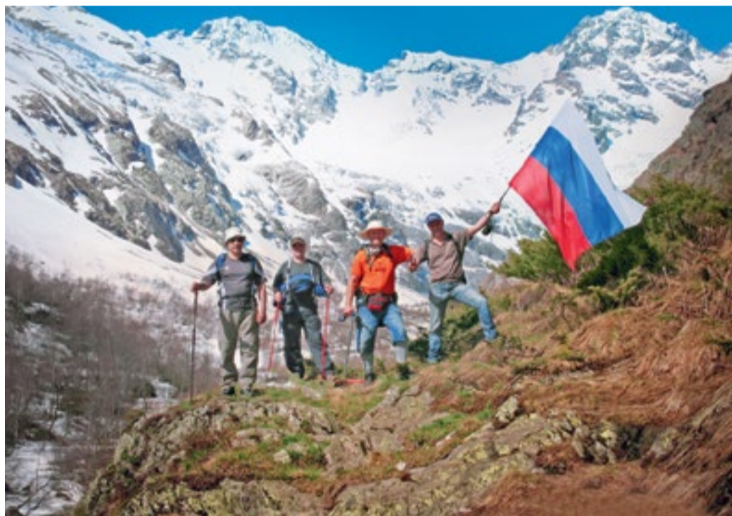
Работники Моздокского ЛПУ МГ в Дигорском ущелье