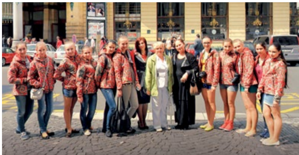
Хореографический ансамбль «Задумка» в Праге