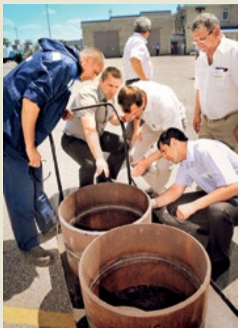
Визуальный контроль качества сварного стыка