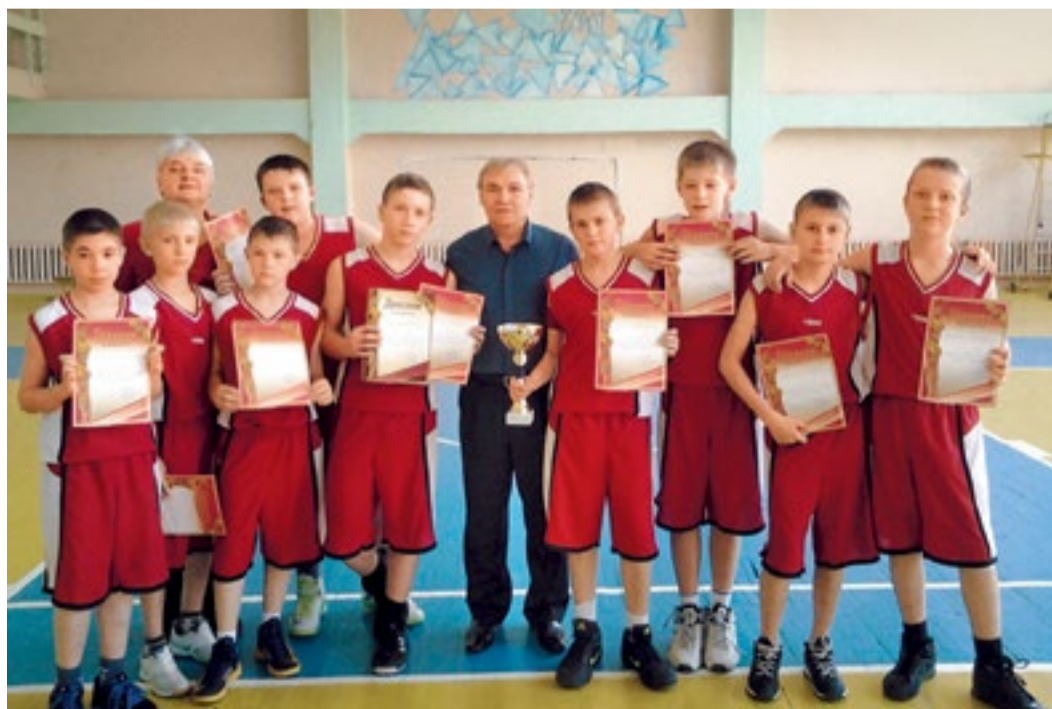
Баскетбольная команда Общества на соревнованиях в Ессентуках