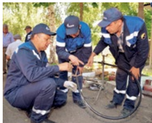
Во время конкурса