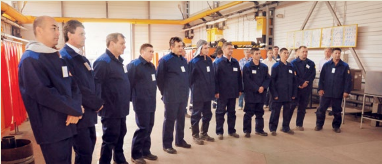
Участники состязаний готовы к выполнению заданий