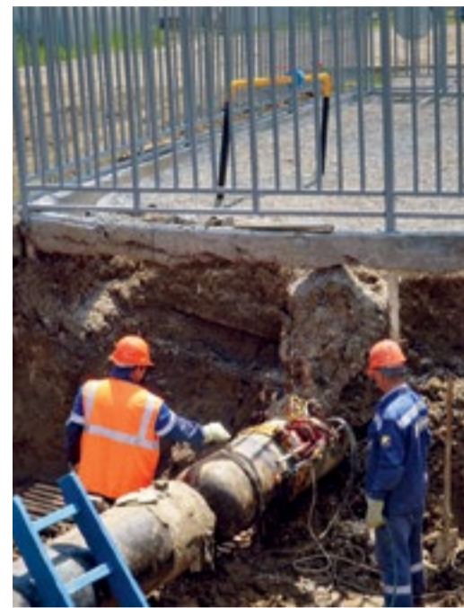
Во время огневых работ