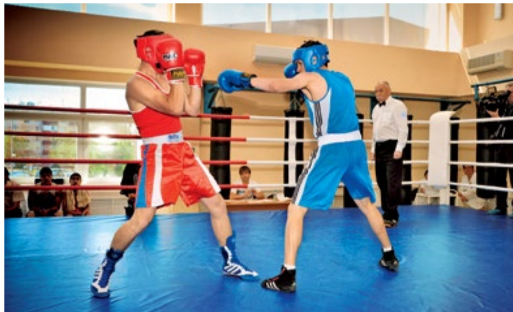
Во время поединка