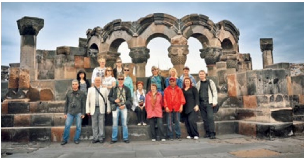
Сотрудники ООО «Газпром трансгаз Ставрополь» у храма Звартноц

Безусловно, самые яркие впечатления на газовиков произвели древние храмы и монастыри. Кафедральный собор Св. Эчмиадзина, построенный в 303 году сразу после провозглашения христианства государственной религией в Армении, располагающийся в цент-