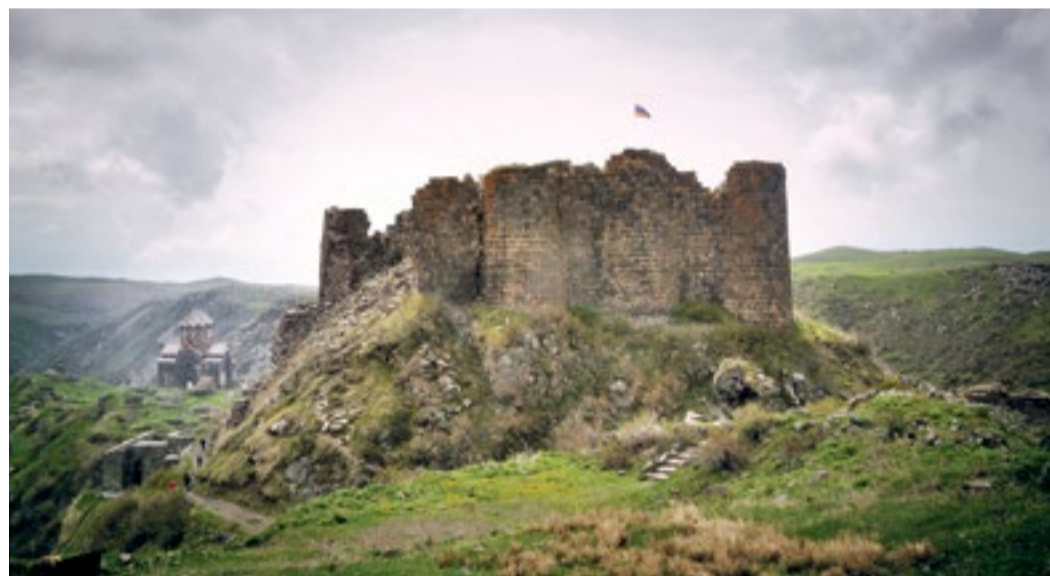
Крепость Амберд, VII век