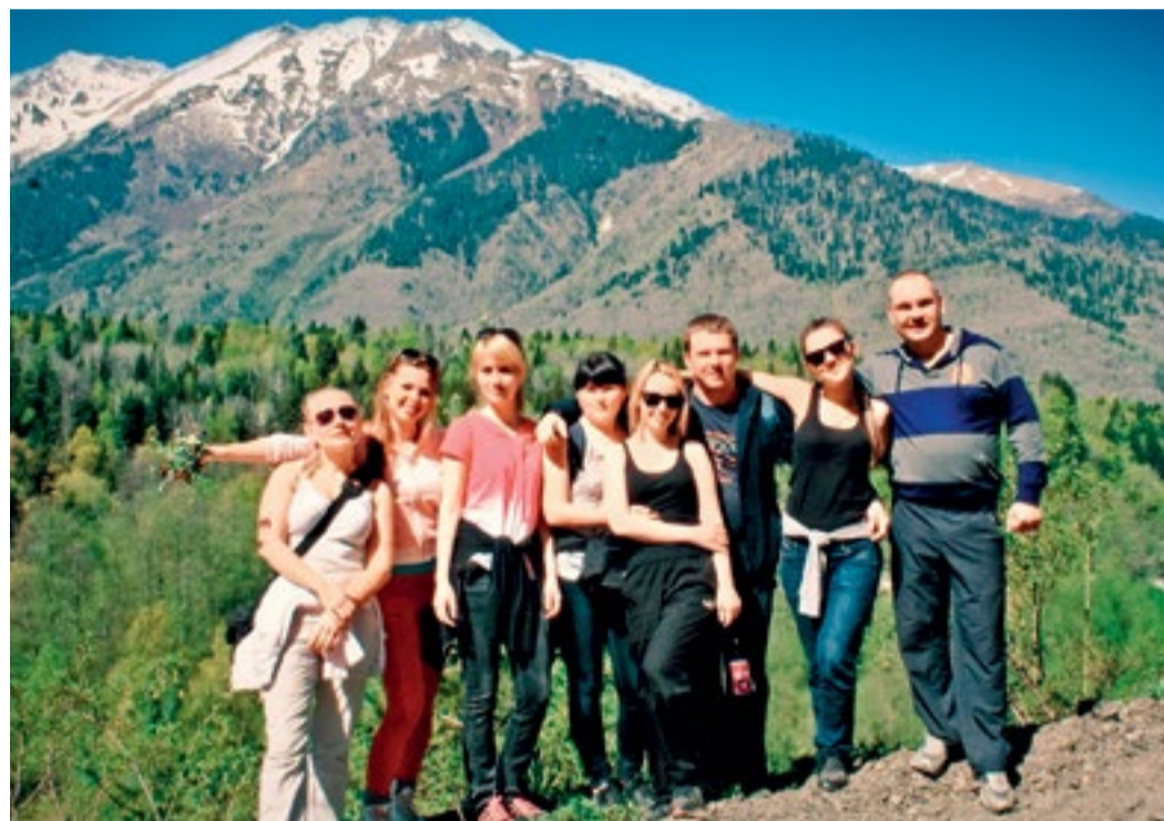
Специалисты «Кавказавтогаза» в горах Карачаево-Черкесии