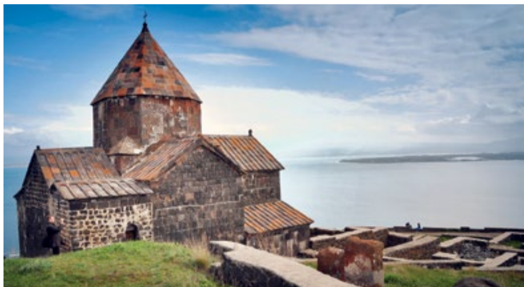
Монастырь Севанаванк основан в 874 году