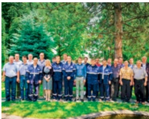
Лучшие слесари КИПиА Общества