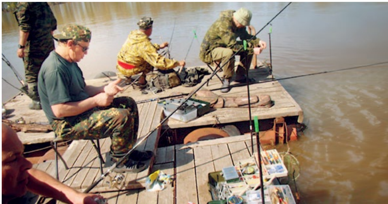
Соревнования в Управлении аварийно-восстановительных работ