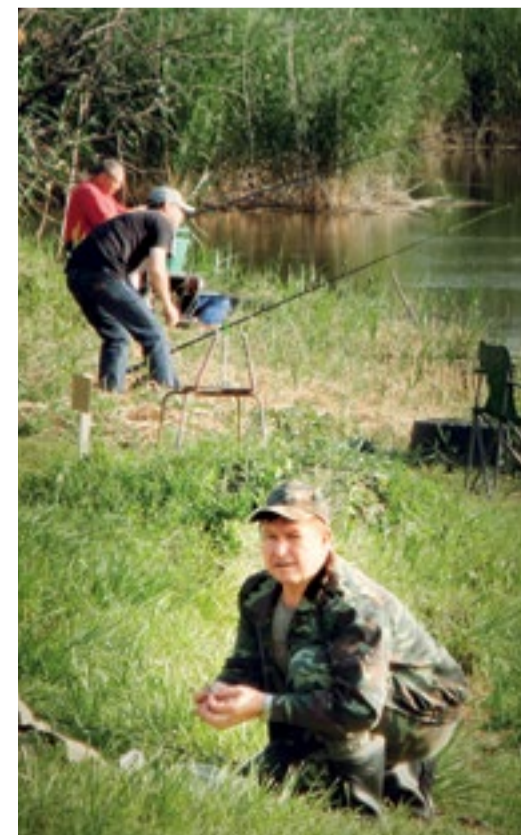
Рыбаки Инженерно-технического центра