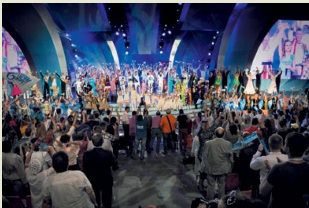
Показательные выступления творческих коллективов на фестивале «Факел»