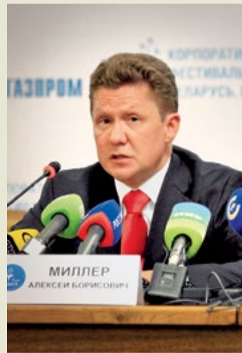
Алексей Миллер на пресс-конференции