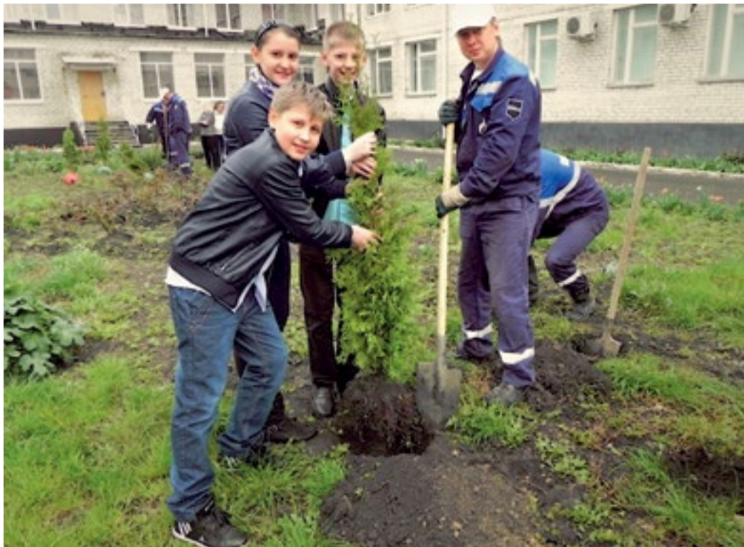
Акция в Ставропольском ЛПУ МГ

Саженцы клена, тополя, ясеня, голубой ели, можжевельника, живая изгородь из барбариса, скумпии и бирючины, клумбы чайно-гибридных роз и гвоздик – это далеко не полный перечень всех зеленых насаждений, украсивших компрессорные станции «Замьяны» и «Зензели», а также территорию базы «Стоянка теплохода для обслуживания дюкерного перехода через реку Волга» Зензелинского филиала Общества. В общей сложности было высажено 756 деревьев, кустарников и цветов.