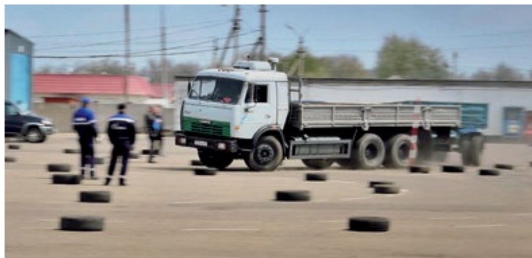
Конкурс водителей в УТТиСТ