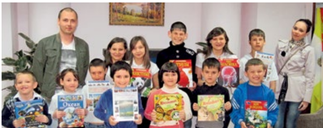
Воспитанники школы-интерната села Подлужного с газовиками