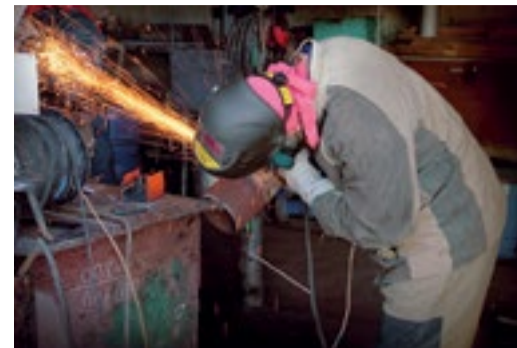
Конкурс в «Кавказавтогазе»

Все электромонтеры справились с полученными конкурсными заданиями, но по-