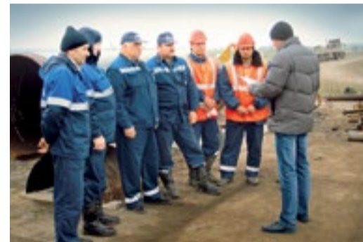
Соревнования в УАВР