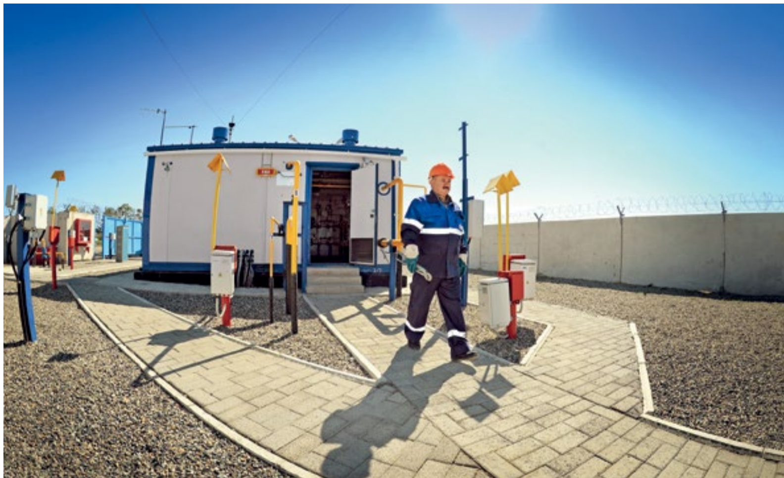
Автоматическая ГРС села Бурукиун после капитального ремонта