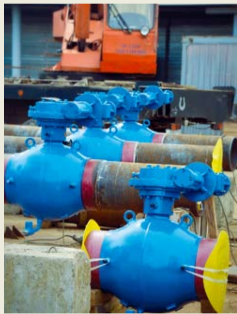
Запорная арматура готова к монтажу

низация оборудования в цехе осушки. Всего в работах на станции занято около 200 специалистов, в том числе сотрудники ЛЭС Ставропольского ЛПУ МГ и АВП-3 УАВР. Реконструкция оборудования ДКС-1 направлена на улучшение экономических показателей работы станции и повышение надежности ее эксплуатации.