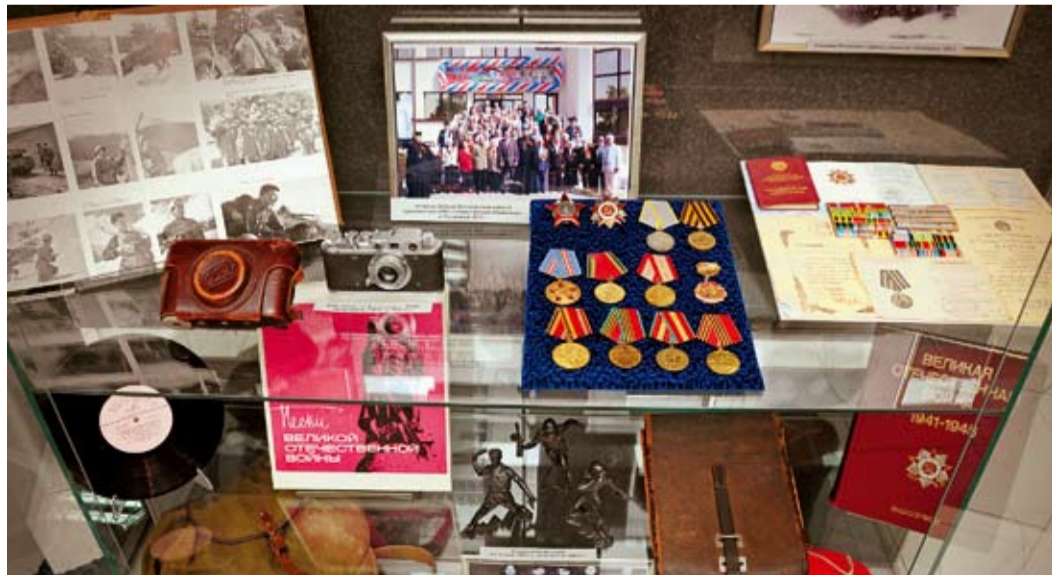
Новая экспозиция в холле здания администрации Общества