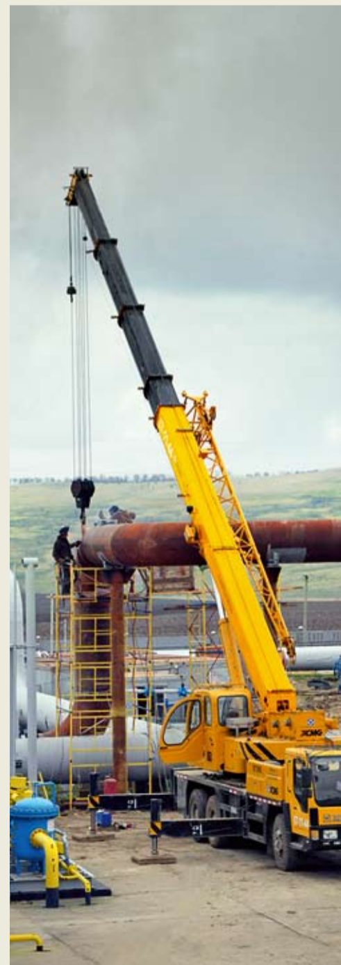
Монтаж коллекторов АВО газа