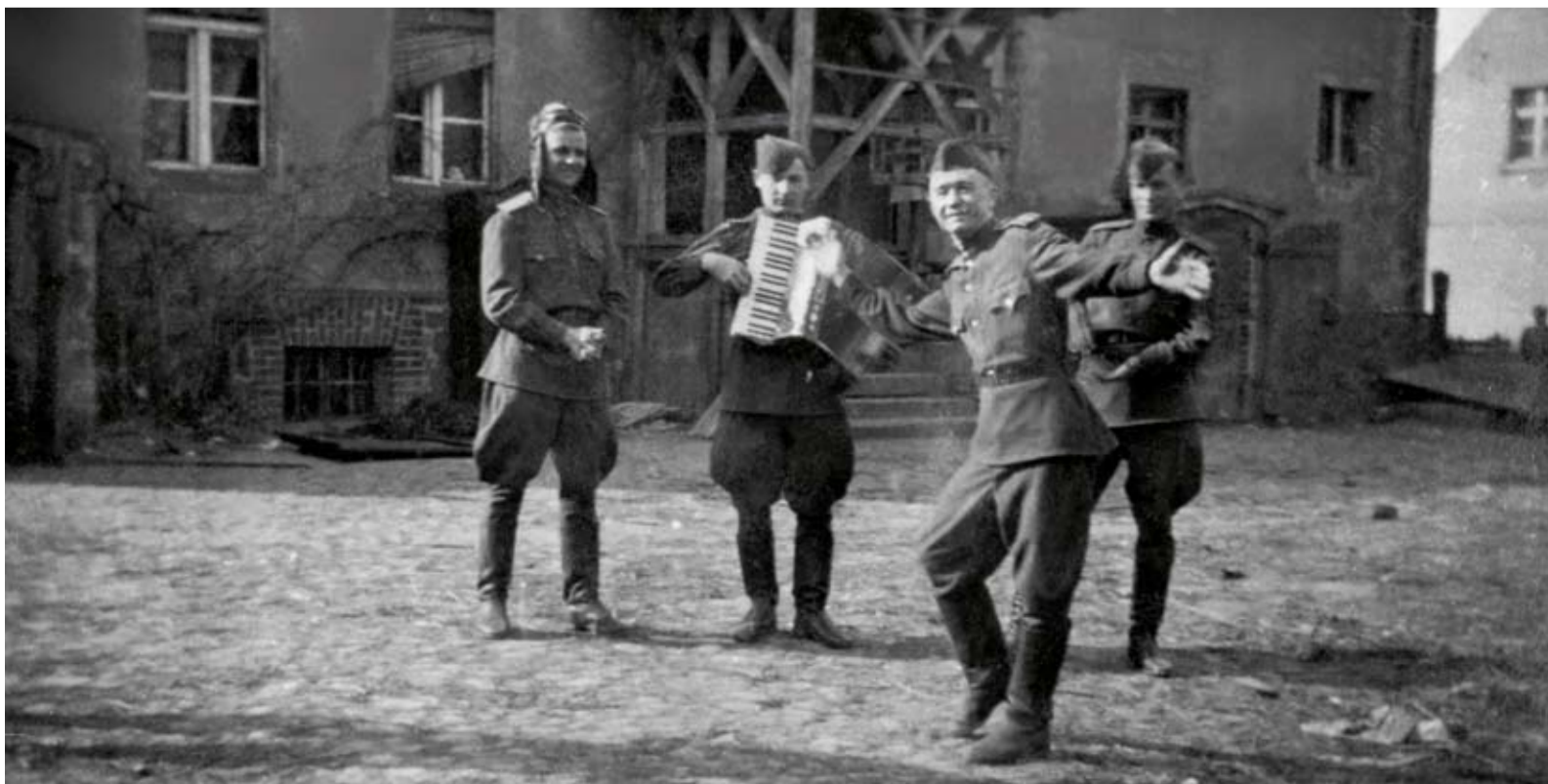
В минуты отдыха на фронте.